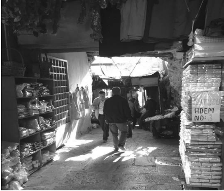
Resim I. Suluhan'dan Hacı Dođan Mahallesi'ne Açılan Kapı

Hasan Paşa vakıflarından olan ve önceki adı Hasan Paşa Hanı olarak geöen Suluhan, araştırma konumuz olan Hacı Dođan Mahallesi'nde bulunan İbadullah Camiinin yanında yer almaktadır ve Vakıflar Genel Müdürlüğü tarafından restore edilmiştir. 1