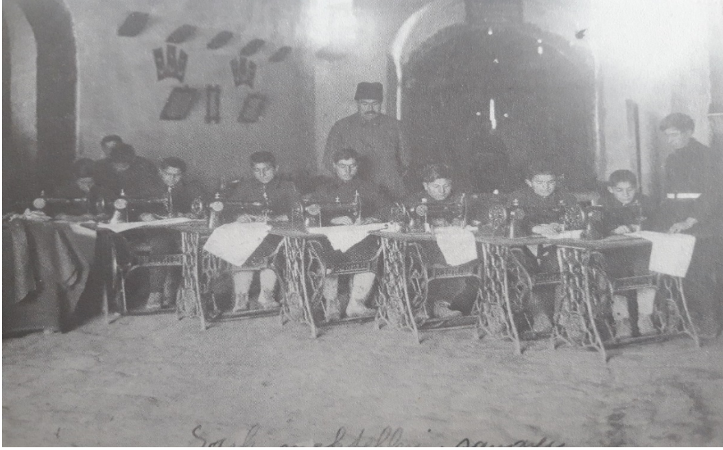
EK-1- Sanayi Mektebi Terzilik Şubesi talebeleri.

(Kaynak: KARABEKİR, Kazım, Çocuk Davamız , Y.K.Y, İstanbul 2019, s. 451.)