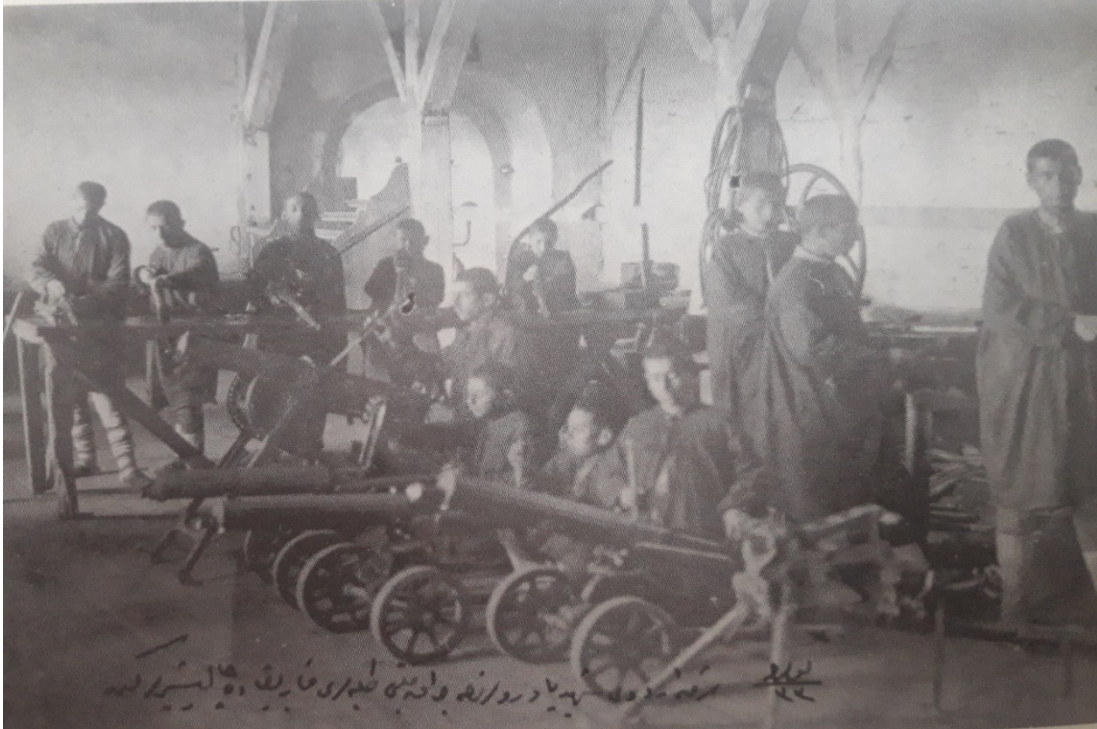
EK-6- Çıraklık Eğitimi Alan Çocuklar.

(Kaynak: KARABEKİR, Kazım, Çocuk Davamız , Y.K.Y, İstanbul 2019, s. 458.)