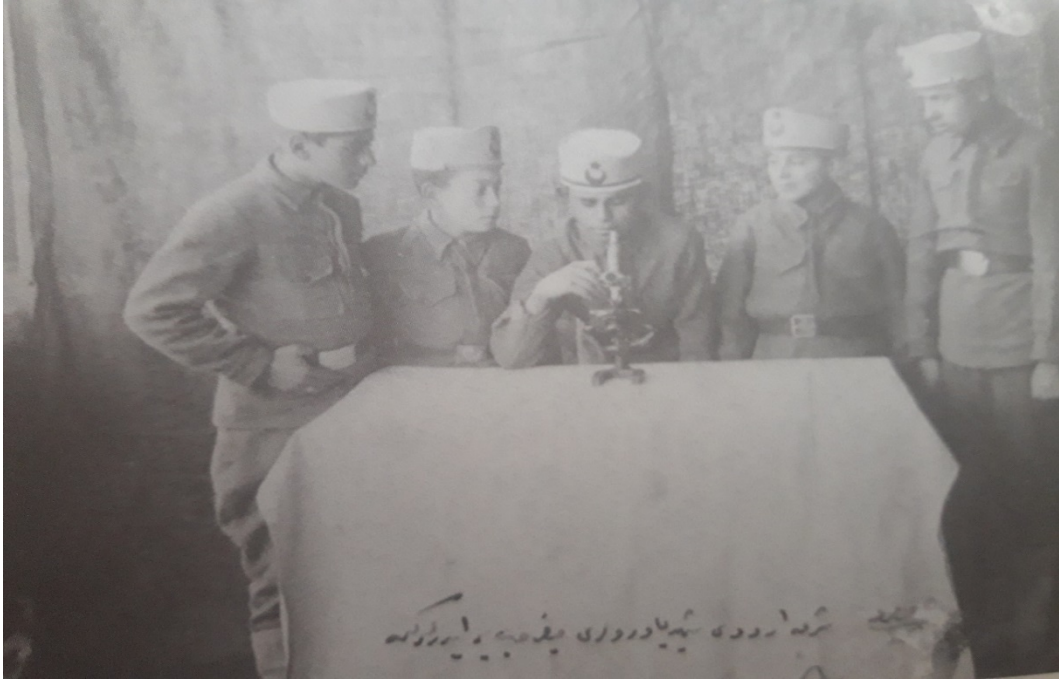
EK-5- Çocuklar Kasabası'nda Öğrenciler Mikroskopu İncelerken.

(Kaynak: KARABEKİR, Kazım, Çocuk Davamız , Y.K.Y, İstanbul 2019, s. 458.)