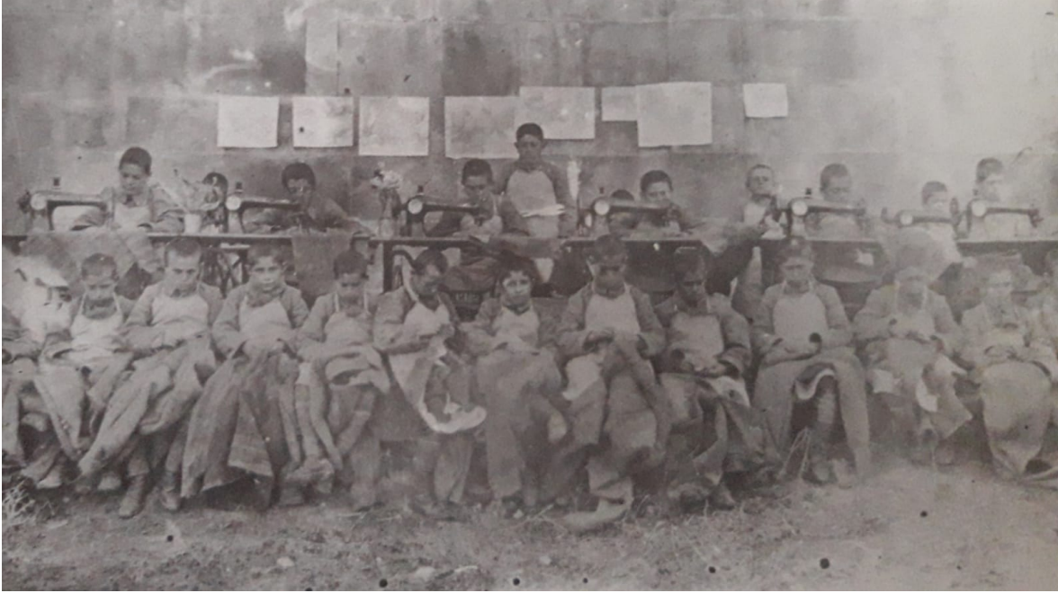
EK-10- Dericilik Bölümü Öğrencileri.

(Kaynak: KARABEKİR, Kazım, Çocuk Davamız , Y.K.Y, İstanbul 2019, s. 455.)