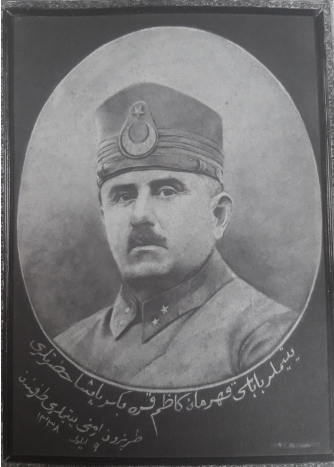
EK-11- Trabzon Ermeni Yetimhanesindeki Çocukların Paşa'ya Hediyelediği (Kaynak: KARABEKİR, Kazım, Çocuk Davamız , Y.K.Y, İstanbul 2019, s. 445.)