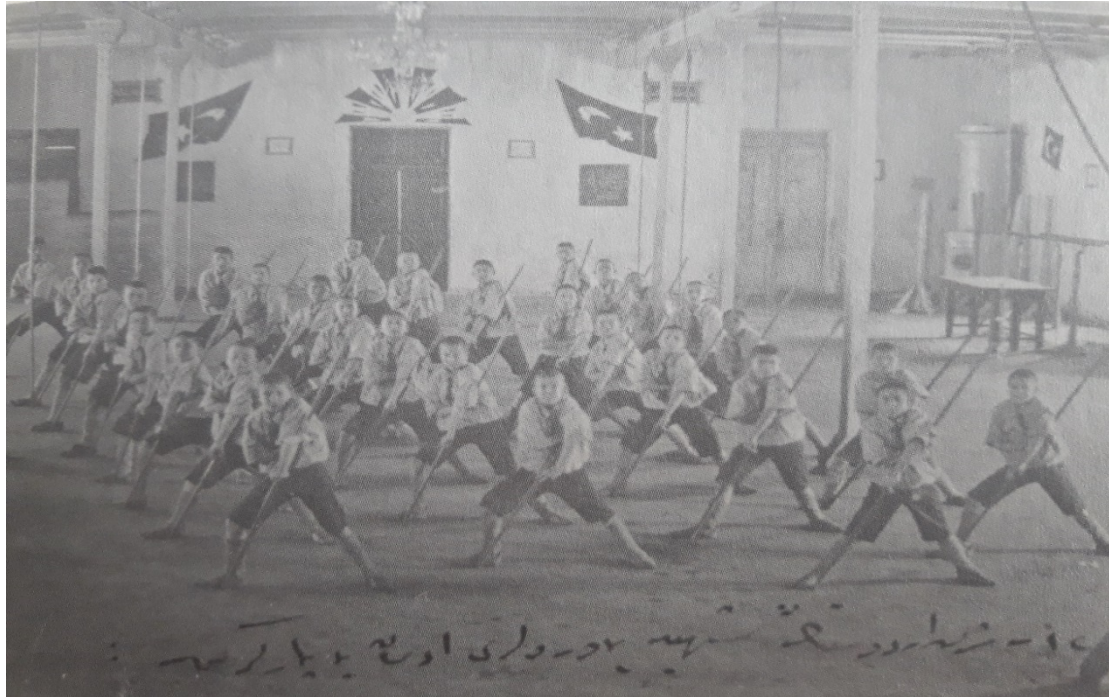
EK-4- Sanayi Mektebi Öğrencilerinin Jimnastik Dersleri.

(Kaynak: KARABEKİR, Kazım, Çocuk Davamız , Y.K.Y, İstanbul 2019, s. 461.)