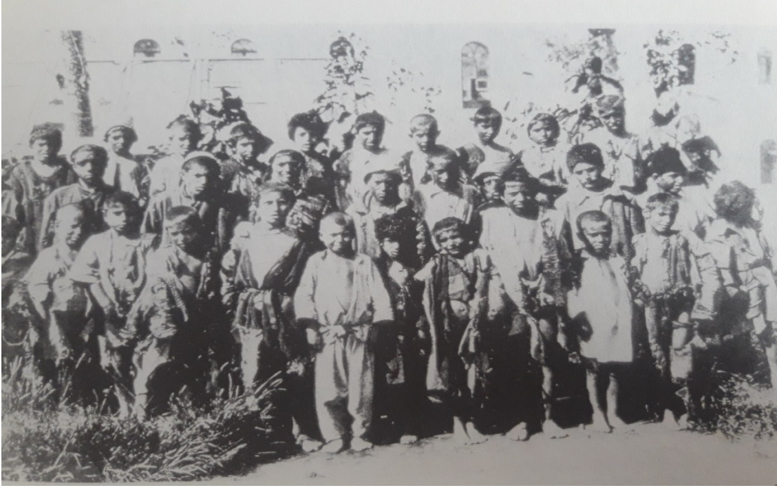
EK-3-Erzurum Yetimler Evinden Alınan ilk Çocuklar.

(Kaynak: KARABEKİR, Kazım, Çocuk Davamız , Y.K.Y, İstanbul 2019, s. 461.)