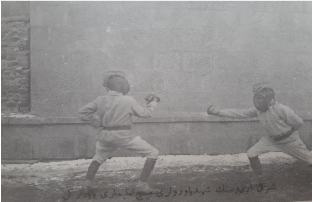
EK-2- Meç Talimi Yaparlarken.

(Kaynak: KARABEKİR, Kazım, Çocuk Davamız , Y.K.Y, İstanbul 2019, s. 451.)