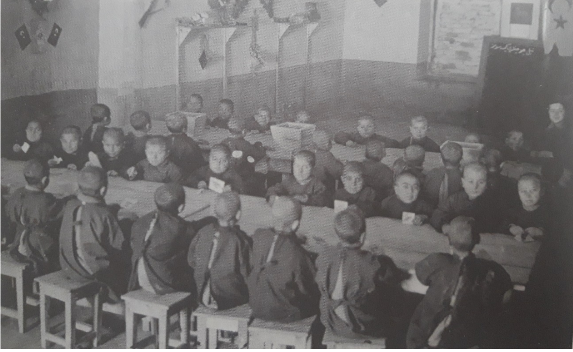
EK-9- Sarıkamış Çocuklar Kasabası Ana Mektebi.

(Kaynak: KARABEKİR, Kazım, Çocuk Davamız , Y.K.Y, İstanbul 2019, s. 455.)