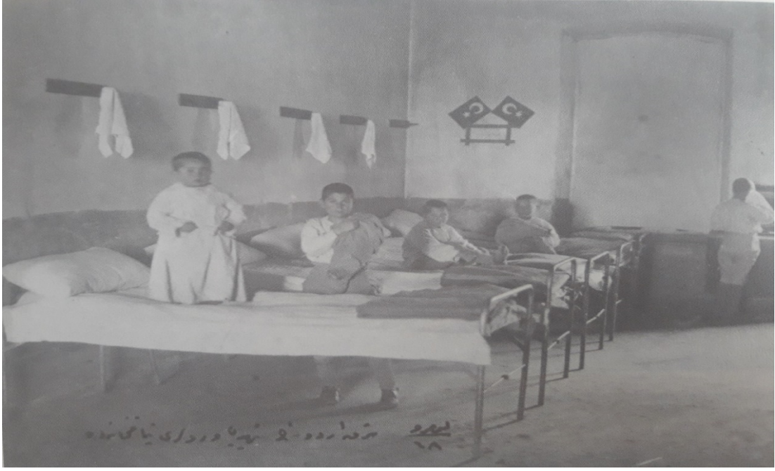
EK-7- Sarıkamış Çocuklar Kasabası Yatakhanesi.

(Kaynak: KARABEKİR, Kazım, Çocuk Davamız , Y.K.Y, İstanbul 2019, s. 459.)