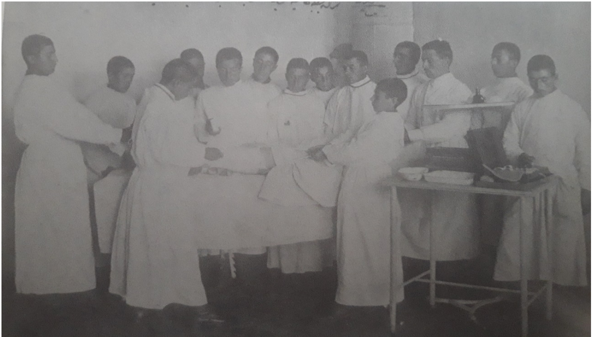
EK-8- Sıhhiye Mektebi Öğrencileri.

(Kaynak: KARABEKİR, Kazım, Çocuk Davamız , Y.K.Y, İstanbul 2019, s. 459.)