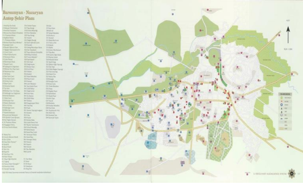
Resim 2. Barsumyan - Nazaryan Antep Şehir Planı

Tanzimat reformları kapsamında gösterişli bir hükûmet konağının yapılması Osmanlı'nın son dönemlerinde hatta Cumhuriyet'in ilk yıllarında dahi mümkün olmamıştır. Bunun nedeninin ise maddi imkânsızlıklardan kaynaklanmış olması muhtemeldir.