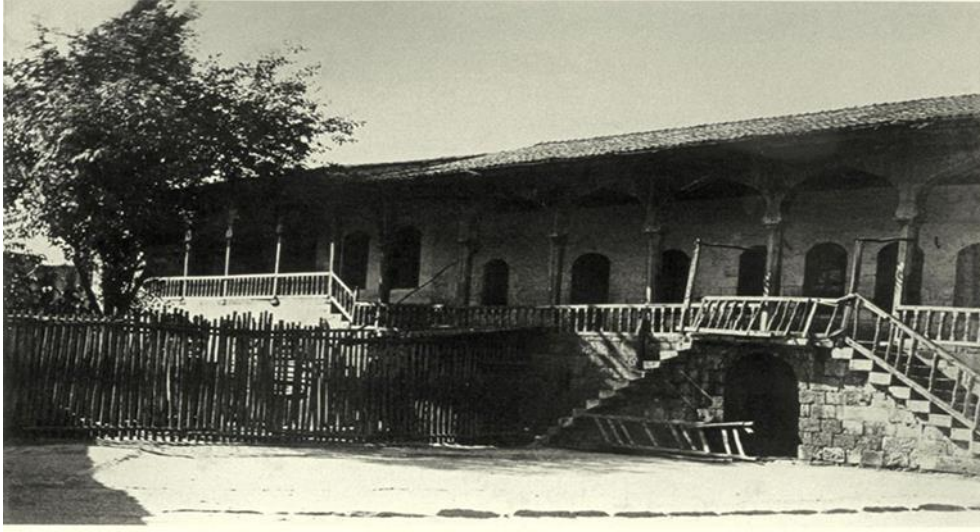
Resim 1. 17.yüzyıldan beri Ayıntab'da yönetim binası olarak kullanılan Eski Saray 26 .