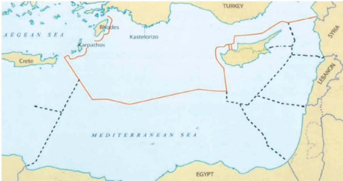
خريطة رقم (2) الحدود البحرية الجديدة لتركيا بعد توقيع مذكرة التفاهم مع ليبيا