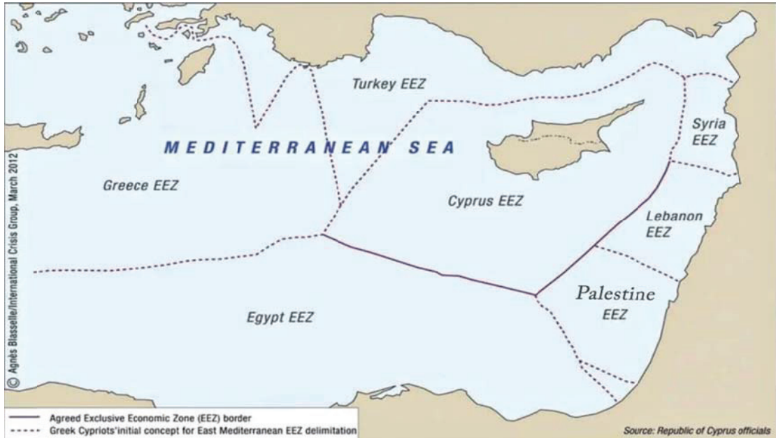
خريطة رقم (1) الحدود البحرية شرق المتوسط قبل توقيع مذكرة التفاهم التركية-الليبية

تشير الخرائط التي نتجت عن توقيع مذكرة التفاهم الخاصة بتحديد مجالات الصلاحية البحرية في البحر الأبيض المتوسط إلى تغيير واضح وكبير في الخرائط الخاصة بالأطراف الأخرى في الحوض الشرقي للمتوسط، الأمر الذي أحدث تغييراً واضحاً في تصورات العديد من دول الحوض الشرقي للمتوسط.