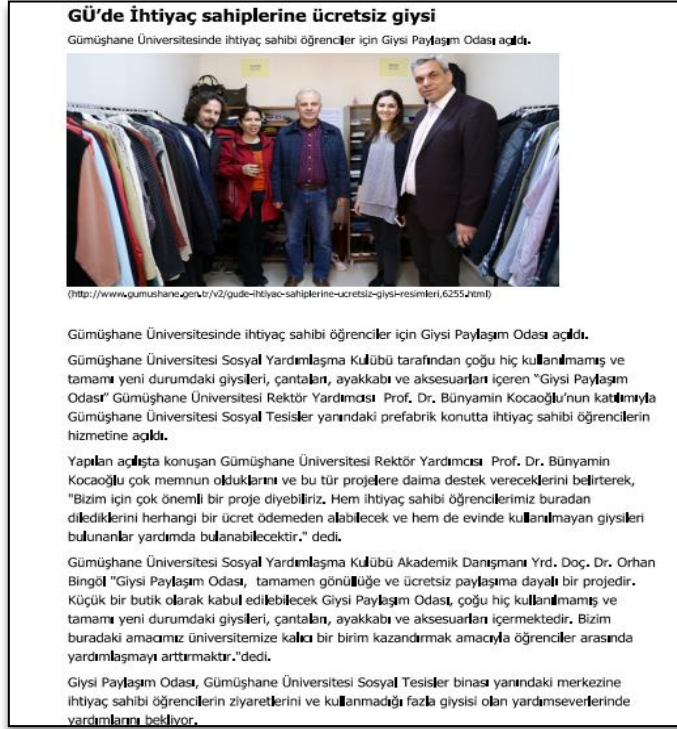
Resim 1: Giysi Paylaşım Odası'nın Açılışı