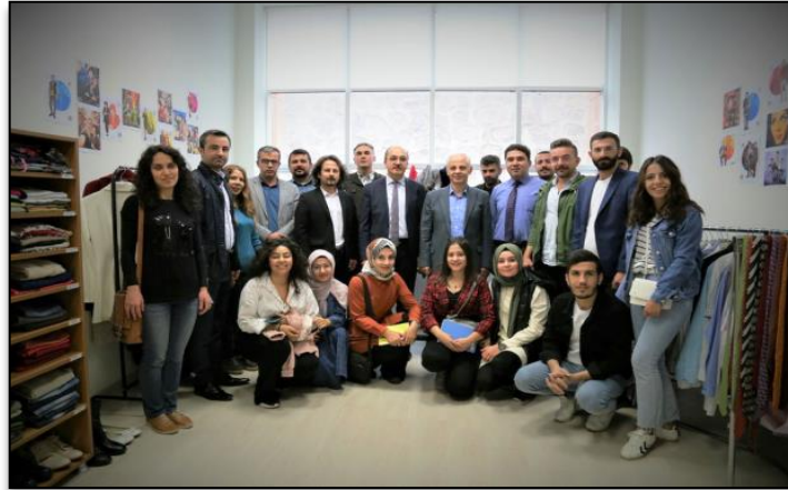
Resim 5 ve 6: Giysi Paylaşım Odası'nın 3. Yaş Kutlaması

Giysi Paylaşım Odası 2019-2020 eğitim öğretim yılı itibariyle 3. yaşına girmiştir. Kuruluşundan itibaren 15'i aktif, diğerleri geri planda olmak üzere onlarca öğrenci Giysi Paylaşım Odası'nda görev almıştır. Bununla beraber oda, açıldığı tarihten bu yana başta üniversite personelinin ve öğrencilerinin bağışladığı 2000'den fazla giyim eşyasını yoksul ve ihtiyaç sahibi öğrencilere tamamen ücretsiz bir biçimde hediye etmiştir. Gümüşhane Üniversitesi'nin merkezi yerleşkesinde aynı yıl yaklaşık 16.000 öğrencinin bulunduğu 4 göz önüne alınırsa, bu sayı, görece yüksek bir orana tekabül etmektedir. Giysi Paylaşım Odası'nın üç yılda aldığı yol ve gerçekleştirdiği yardımlar, Ekim 2019 tarihinde Gümüşhane Üniversitesi Rektörü Prof. Dr. Halil İbrahim ZEYBEK ve üniversitenin diğer yöneticileri ile Edebiyat Fakültesi akademik personeli ve öğrencilerinin teşrifıyla hep birlikte kutlanmıştır 5 .