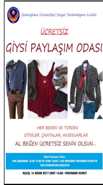
Resim 2: Giysi Paylaşım Odası'nın İlk Afışı

Giysi Paylaşım Odası, Gümüşhane Üniversitesi'nde eğitim gören başta yoksul ve ihtiyaç sahipleri olmak üzere tüm öğrencilere hizmet veren bir butik şeklinde işlemektedir. Odanın temel ve değişmez gayesi sosyal yardımlaşma ve paylaşımdır. Odada hemen her türden ve bedenden kadın ve erkek giysileri, ayakkabıları, çantaları, aksesuarları yer almaktadır. Öğrencilerin beğenisine sunulan ürünlerin tamamı ücretsizdir. Bu, Giysi Paylaşım Odası'nın en önemli prensiplerinden biridir. Benzer şekilde, Giysi Paylaşım Odası'nda öğrencilere hediye edilecek olan ürünler, odaya yardım yapmak isteyen herkesen (üniversite yönetiminden, akademik ve idari personelden, öğrencilerden) yine karşılıksız olarak kabul edilmektedir. Bu da Giysi Paylaşım Odası'nı karşılıksız, aktif ve devamlı kılan temel niteliklerdendir.