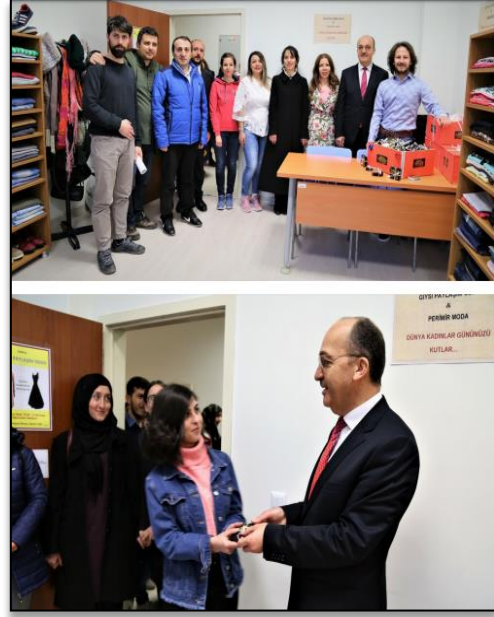
Resim 3 ve 4: 8 Mart Dünya Kadınlar Günü Kutlaması

Yeni yerinde öğrencilere hizmet veren Giysi Paylaşım Odası'nda öğrencilerimiz; beğendiği bir giysiyi, elbiseyi vb. kullanım malzemelerini herhangi bir ücret ödemedene alabiliyor. Başta üniversitemiz personeli olmak üzere, isteyen herkes artık kullanmadığı bu tür eşyalarını üniversitemizde bulunan Giysi Paylaşım Odası'na bağışlayarak, ihtiyacı olan öğrencilerle buluşmasına katkı sağlayabilir.