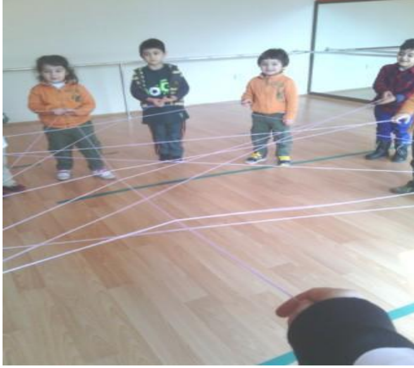
Şekil 9. Arapsaçı Oyunu ( http://www.dogakoleji.k12.tr/kampusetkinlikleri/elazig-kampusu/geleneksel-oyunumuz-arapsaci/89321 )

3.3.11. Sayıcı-Beşbeş: Kadın oyuncu rolünü erkeklerin üstlendiği bir orta oyundur. Sadece çocukların değil, genç ve yaşlıların da oynadıkları eğlenceli bir oyundur. Bir deveci, bir arap, bir sayıcı (kambur ya da hoca), üç veya dört soytarı ve beş kız (aslında erkek) oyuncu ile oynanır. Oyunun adı beş kızdan gelmektedir. Bir de davulcu eklenir. Sayıcı rolü oyunun en önemli karakteridir. Deveci zengin bir tüccardır. Arap ise devecinin kızlarını korumakla görevlidir. Arabın sırtında kalın bir post veya saman çuvalı vardır. Devecinin kızlarından kaybolanlar olunca araba ceza verilir. Yere yatırılır ve deveci tarafından sırtına vurulur. Bu sırada arap bayılır. Ardından sayıcı (hoca) çağırılıp muska yazdırılır ve arap iyileşir. Kızlar da bulunur. Davul eşliğinde soytarılarla birlikte kızlar ve arap oynar. Genellikle ay ışığının olduğu açık havalarda oynanan oyunlarda farklı köylerde farklı konular işlenir. Oyunun oynandığı yere dışarıdan gelen misafirlerin de katılımı oyunu daha ilgi çekici ve sürprizli bir hale getirmektedir. Gösterilerden memnun kalan bu izleyiciler, oyuncular ile birlikte köyü gezerler. Gösteri karşılığında evlerden bahşiş veya ürün alırlar. Bu gelir oyunda oynayanlar arasında paylaşılır. Bu oyun mübadeleden sonra yaklaşık 25 yıl kadar oynanmaya devam etmiş ve sonrasında bırakılmıştır.