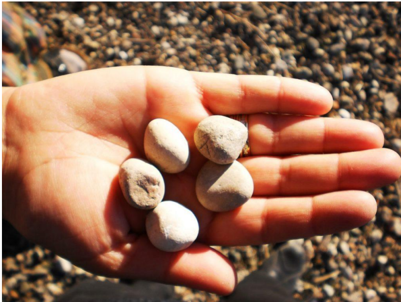
Şekil 8. Beştaş Oyunu ( https://ecdad.org.tr/kulturumuz/cocukluk-donemi-oyunlarimiz/bes-tas-oyunu/ )

3.3.9. Beştaş: Yuvarlak ve misket büyüklüğünde beş tane taş ile oynanır. İki veya daha fazla kişiyle oynanabilir. Oyuna başlamadan önce kimin ilk yarışacağını belirlemek için kura çekilir. Kişi belirlendikten sonra, ilk oyuncu taşlardan birini eline alıp kalanlarını yere dizer. Aldığı taşı havaya fırlatır ve bu sırada yerdeki taşlardan birini eline almaya çalışır. Amacı, havadaki taş düşmeden eline kalan dört taştan birini daha alıp havadakini yakalayabilmektir. Bir sonrakinde havaya taşı attıktan sonra yerden iki taş alabilmelidir. Bu şekilde sayı artarak devam eder. Tüm taşlar bittiğinde, oyuncu işaret parmağını orta parmağının altına koyup, yuvarlak şekli aldırılır. Ardından tüm taşları o yuvarlaktan geçirir. Eğer tüm bu süre boyunca taşları düşürmeden ve doğru şekilde yaparsa oyuncu kazanır. Şayet başarısız olursa sıra rakibine geçer.