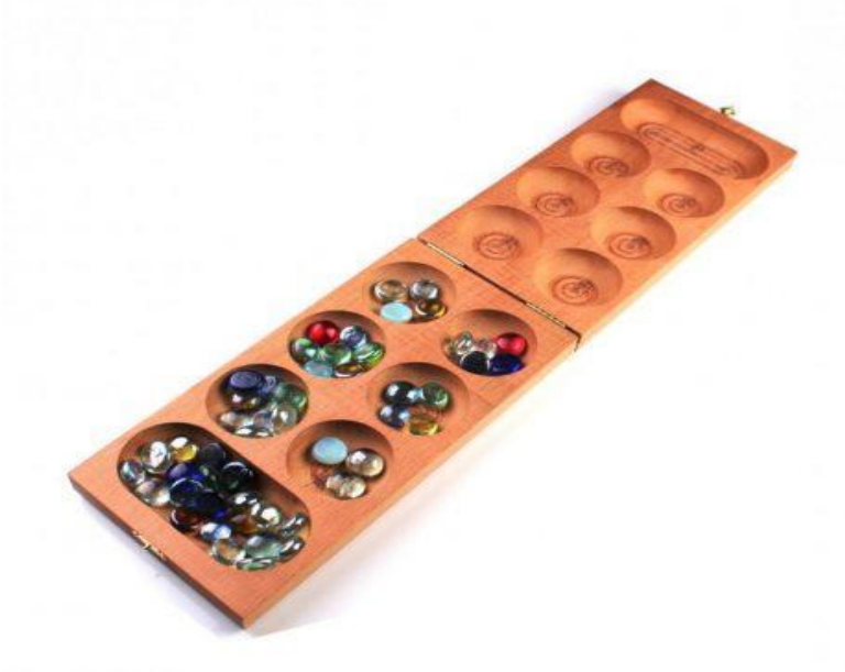
Şekil 6. Mangala Oyunu ( http://janjantasarim.com/shop/ahsap-oyuncak/mangala-2/ )

3.3.7. Dönemeç: Salıncak ile oynana oyun en az 2 kişi ile oynanır. Çift taraflı bir salıncığın iki köşesine kişiler oturur ortada kalan kısma salıncak dönerken ses çıkarsın diye kömür de konulabilir. Bu oyun daha çok özel günlerde çocukların sıra ile ve birlikte oynadıkları bir oyundur.