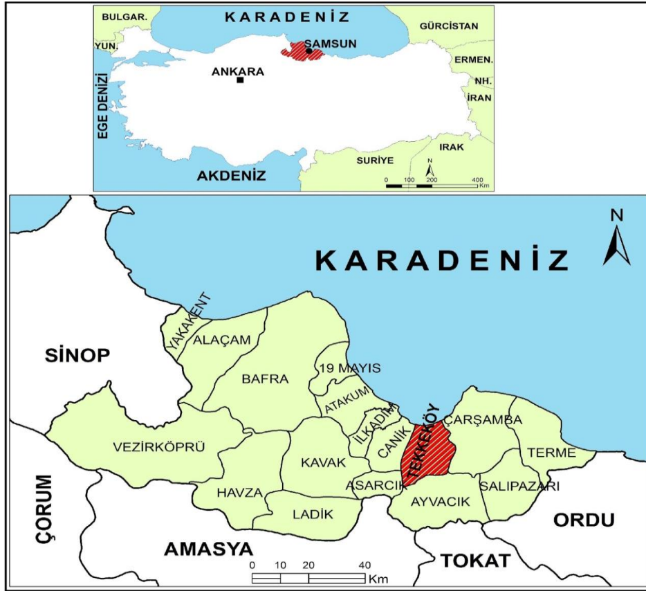
Şekil 1. Araştırma Sahasının Yer