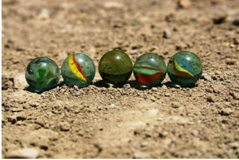
Şekil 4. Cicile Oyunu ( http://yasev.com/galeri/klasikoyun/581-misket-oyunu-nasil-oyanir.html )

3.3.5. Cuz: 2 Kişi ile oynana oyunda tahta parçaları ve taş kullanılır. Günümüz üçtaş oyununun eski versiyonudur.