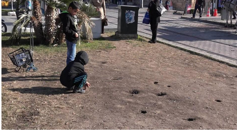
Şekil 3. Tumba Misket Oyunu ( https://www.youtube.com/watch?v=ztRq_p1p0m8 )

3.3.3. Tumba: Misket ile oynanan Tumba oyununda oyuncu sayısının fazlalığı önemli değildir. En az 2 kişi ile oynanır. Düz ve toprak olan zemine dört veya beş tane oyuk açılır bu oyuklar çok derin olmamalıdır. Daha sonra açılan oyukların biraz gerisinden misket atılır ve oyuklardan sıra ile geçirilmeye çalışılır.