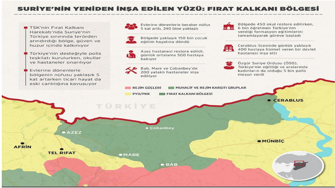
Şekil 2: FKH Sonucu Suriye'de Fırat'ın Batısında Oluşan Harita (Kako vd., 2018).

Harekâtın toplam süresi göz önüne alındığında yaklaşık 100 gün gibi bir süre DEAŞ'ın El-Bab'da direnmesi ki, bu durumda Rakka ve Musul'da DEAŞ'a karşı yürütülen operasyonların yavaşlaması (Kasapoğlu, 2017: 3) önemli bir faktör olup, terör örgütünün ne denli bir silah ve militan takviyesi yaptığını göstermektedir. El-Bab'ın da alınması ile Suriye'nin kuzeyinde 90 km uzunlukta 40 km derinlikte bir bölge ele geçirilerek güvenli hale getirilmiştir. Ancak Menbiç'e düzenlenmesi düşünülen harekât ABD'nin PYD/YPG-PKK terör örgütünün Fırat'ın doğusuna çıkarılacak sözü nedeniyle gerçekleştirilememiştir (Özalp, 2018: 169-186).