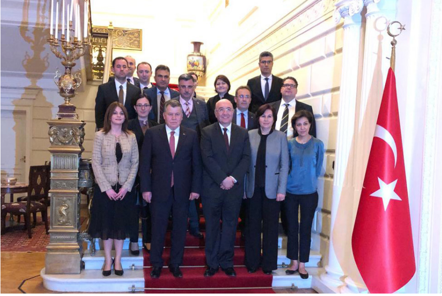
Rusya Federasyonu Ziyareti (11-17 Mayıs 2019)