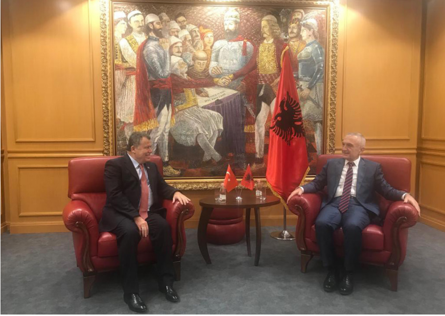
Arnavutluk Ziyareti (07-11 Kasım 2018)