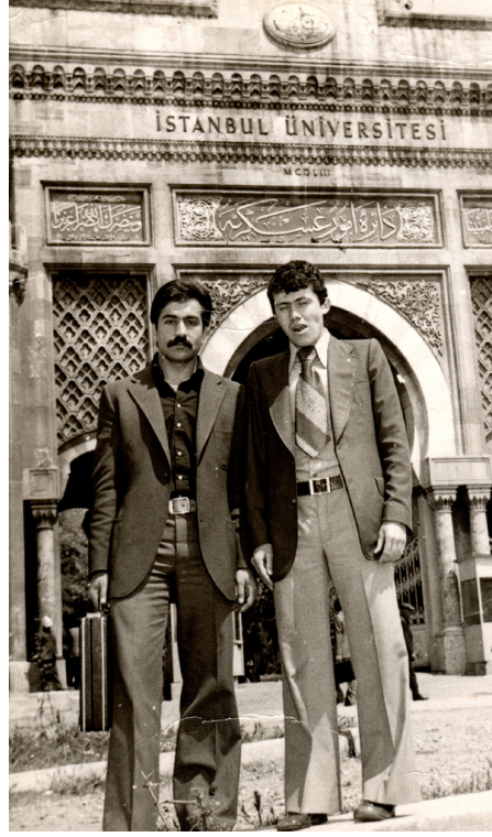
İstanbul Üniversitesi Hukuk Fakültesi Yılları