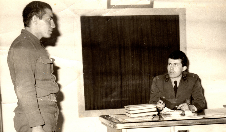
Şaovşat Askerlik Şubesi Başkan Vekilliği