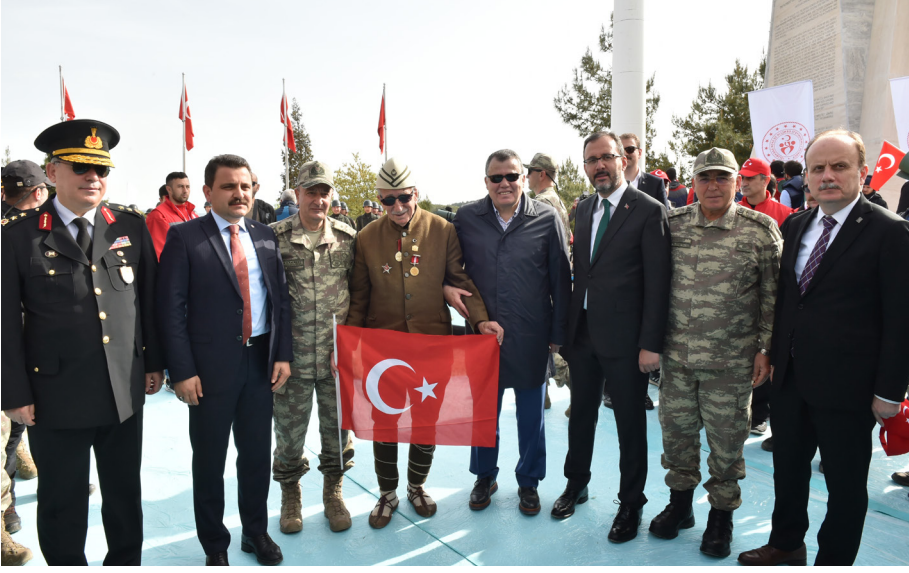
57. Alay Vefa Yürüyüşü (24-25 Nisan 2019)