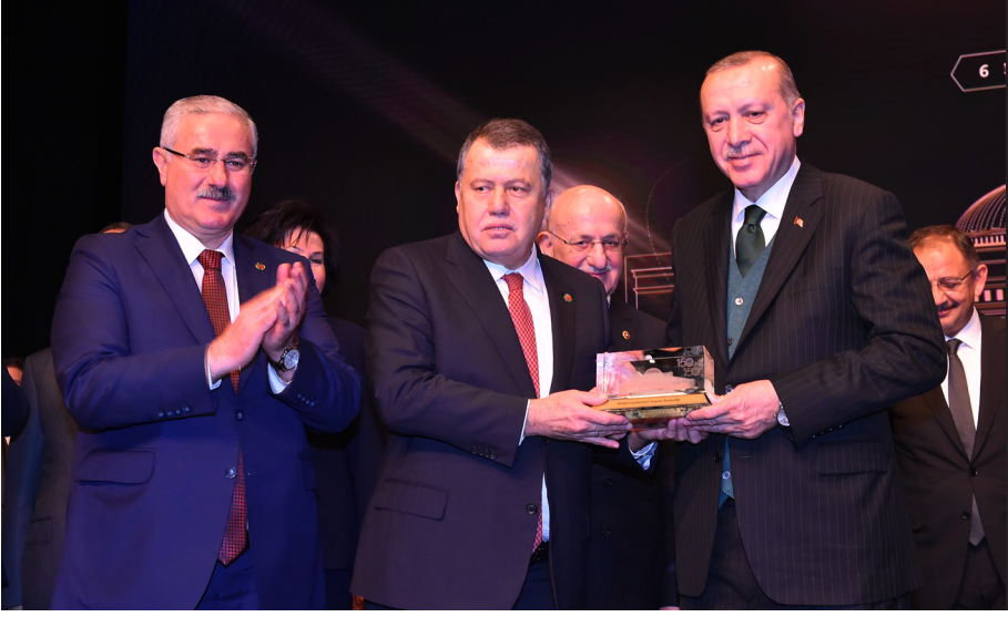
150. Yılında Yargıtay Sempozyumu ve Yargıtay Yeni Hizmet Binası Temel Atma Töreni (06 Mart 2018)