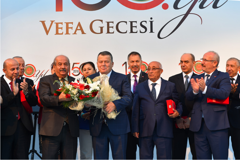
150. Yıl Vefa Gecesi (29 Haziran 2018)