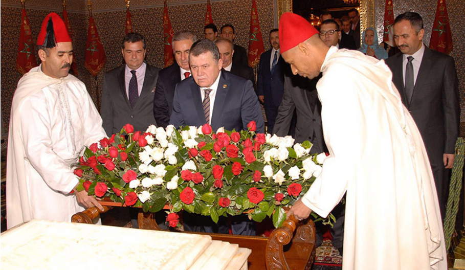
Fas Ziyareti (19-24 Ocak 2016)