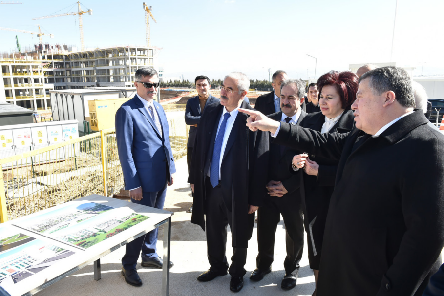
Yargıtay Yeni Hizmet Binası Şantiye Toplantısı (20 Şubat 2019)