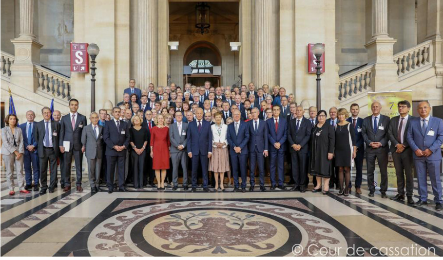
Avrupa Konseyi Yüksek Mahkeme Başkanları Toplantısı (14 Ekim 2019)