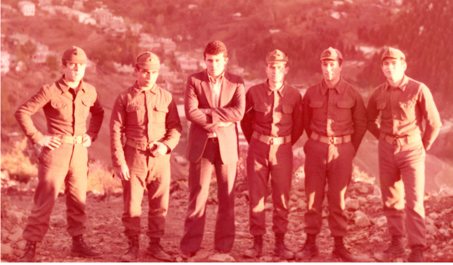
Şavşat Askerlik Şubesi Başkan Vekilliği