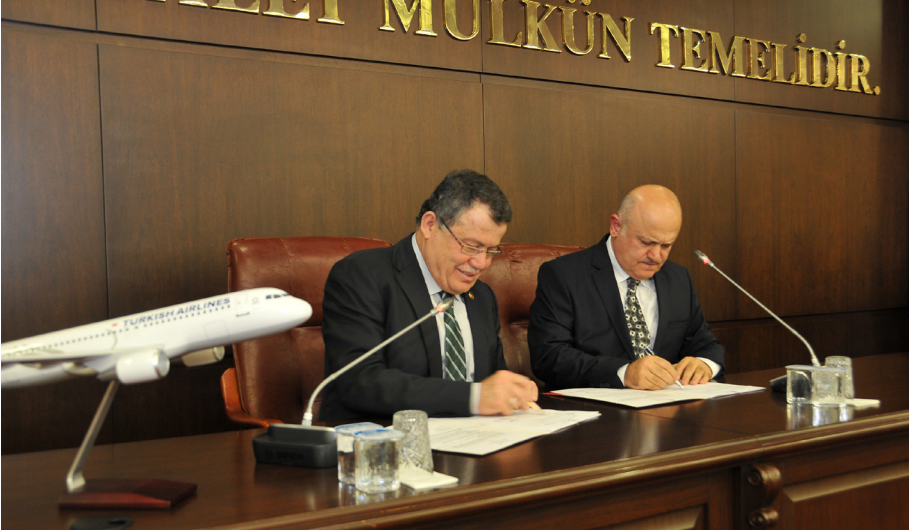
THY ile Protokol İmzalanması (23 Mart 2015)