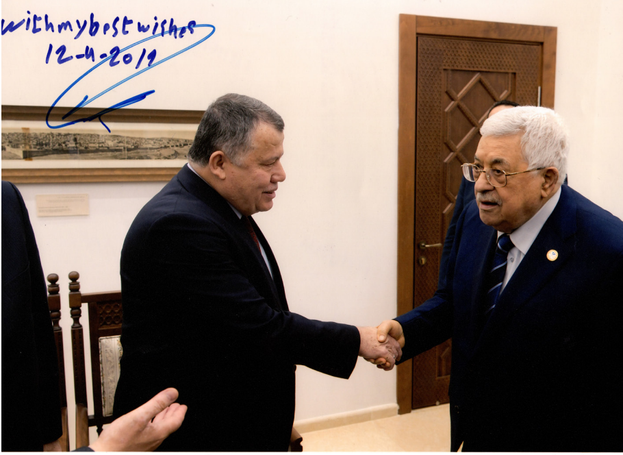
Filistin Ziyareti (10-14 Nisan 2019)