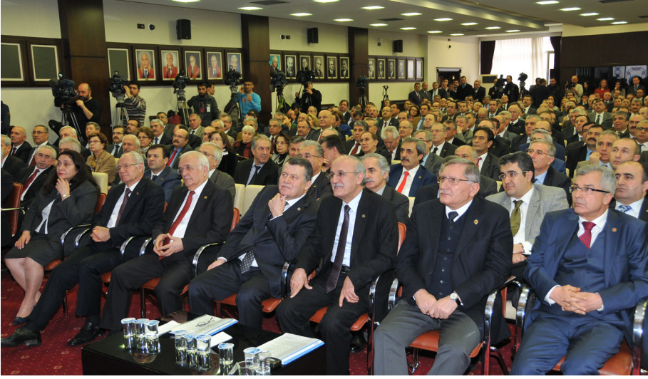
Mazbata Töreni (10 Şubat 2015)