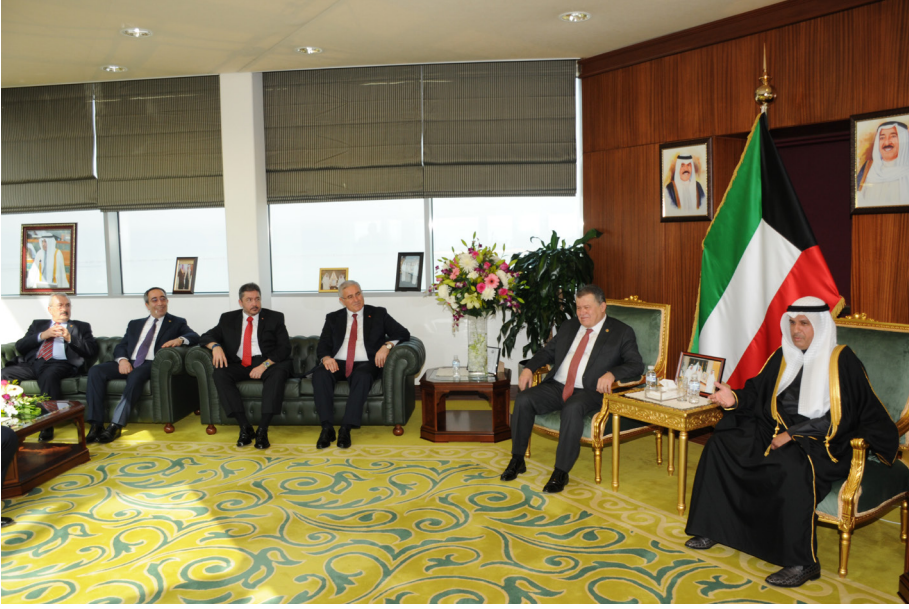
Kuveyt Ziyareti (4-9 Mart 2017)