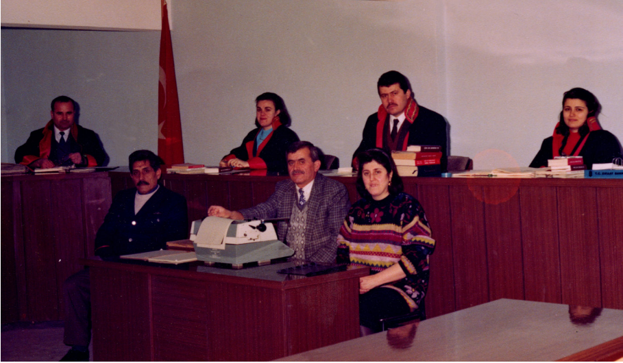
Zile Ağır Ceza Mahkemesi Başkanlığı