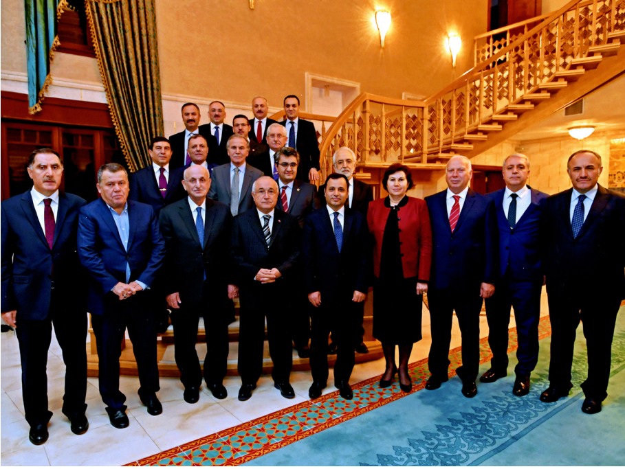
Türkiye Büyük Millet Meclisi Başkan Komutu