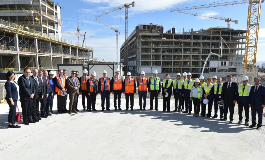
Yargıtay Yeni Hizmet Binası Şantiye Toplantısı (24 Şubat 2019)