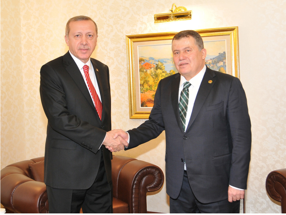
Cumhurbaşkanı Sayın Recep Tayyip ERDOĞAN'ın Yargıtay Başkanlığım Ziyaretleri (26 Mart 2015)