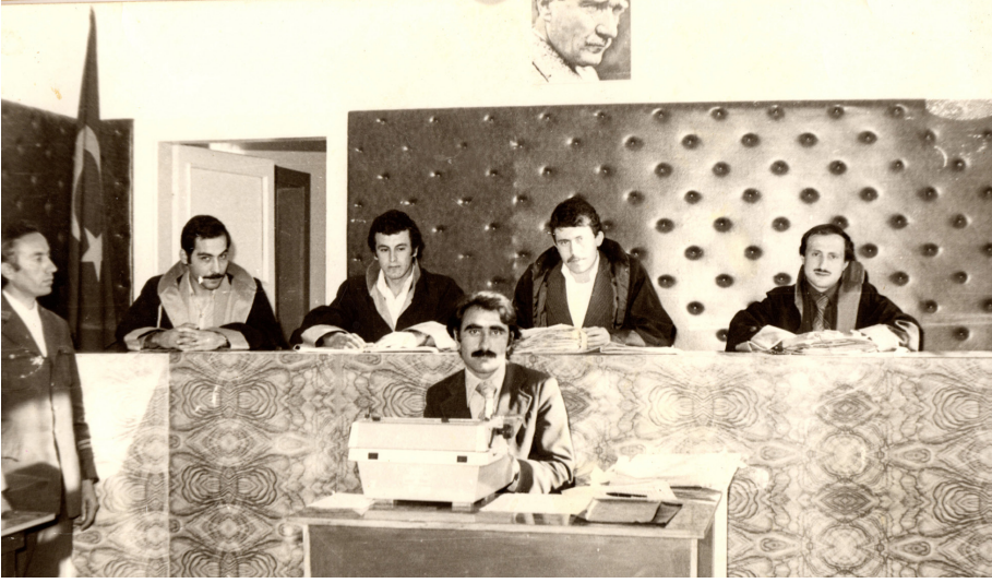
Hakkari Ağır Ceza Mahkemesi Başkanlığı