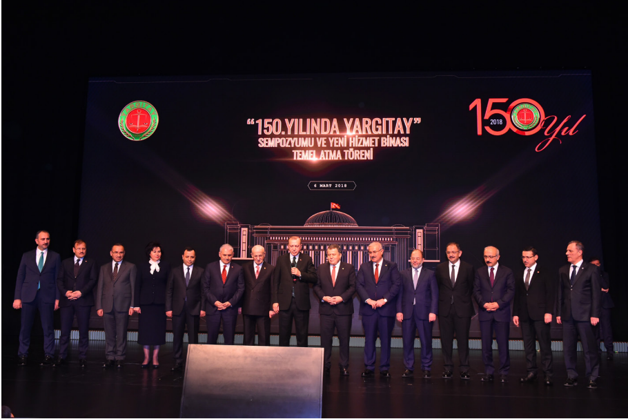
150. Yılında Yargıtay Sempozyumu ve Yargıtay Yeni Hizmet Binası Temel Atma Töreni (06 Mart 2018)