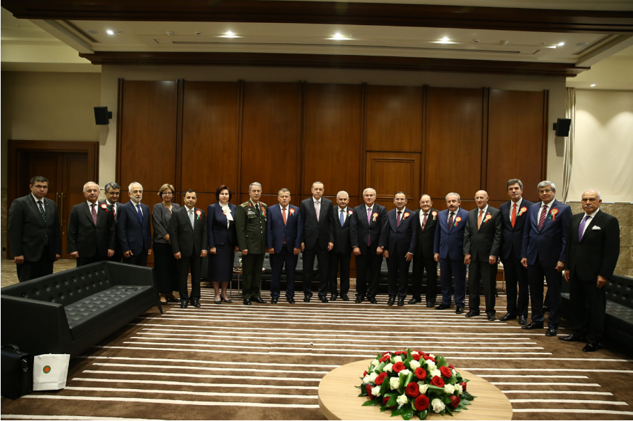
Adli Yıl Açılışı Töreni (2016-2017)