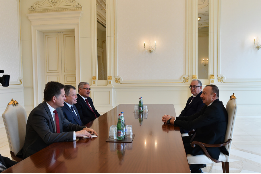
Azerbaycan Ziyareti (17-22 Nisan 2016)