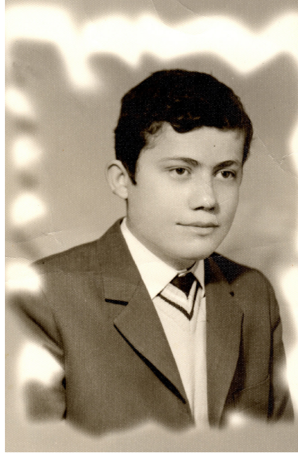
İzmir Namık Kemal Lisesi Yılları