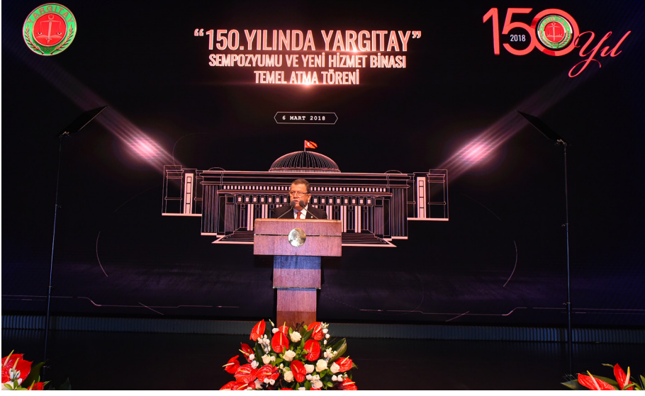
150. Yılında Yargıtay Sempozyumu ve Yargıtay Yeni Hizmet Binası Temel Atma Töreni (06 Mart 2018)