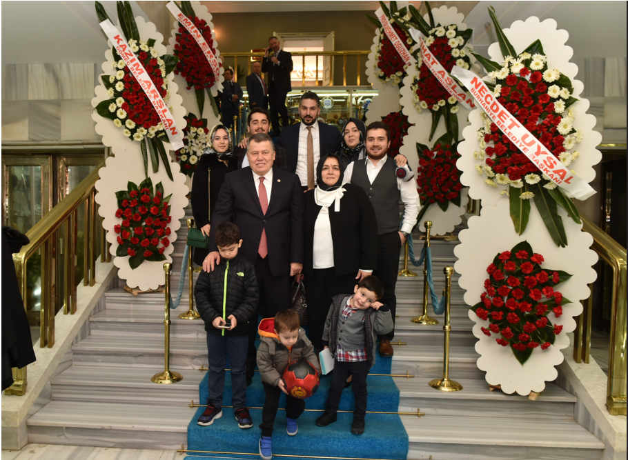
Mazbata Töreni (11 Şubat 2019)