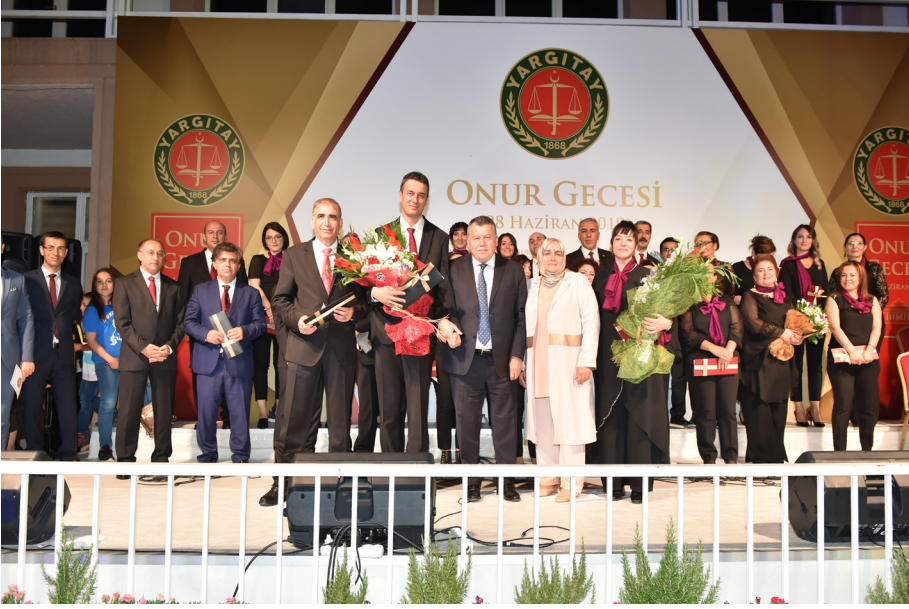
Onur Gecesi (28 Mayıs 2019)