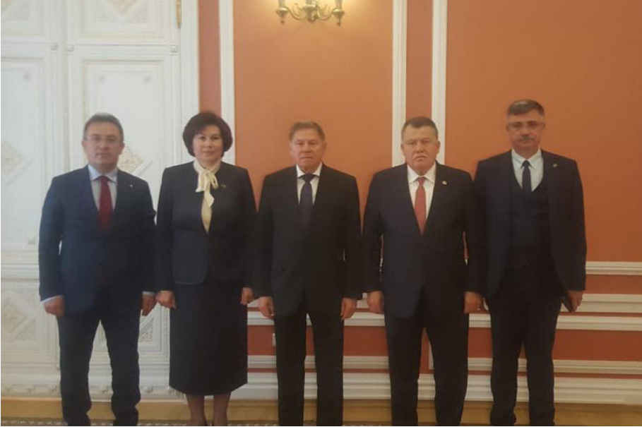
Rusya Federasyonu Ziyareti (11-17 Mayıs 2019)