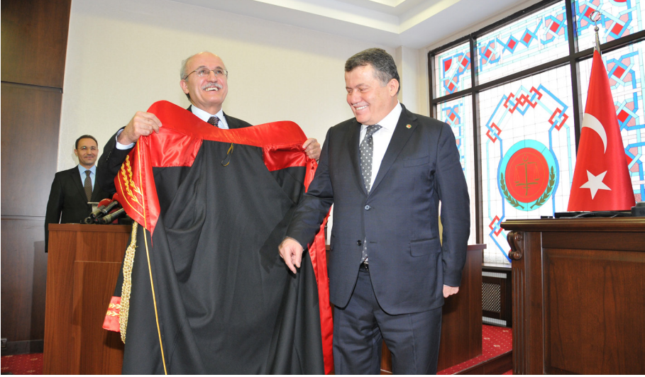
Mazbata Töreni (10 Şubat 2015)