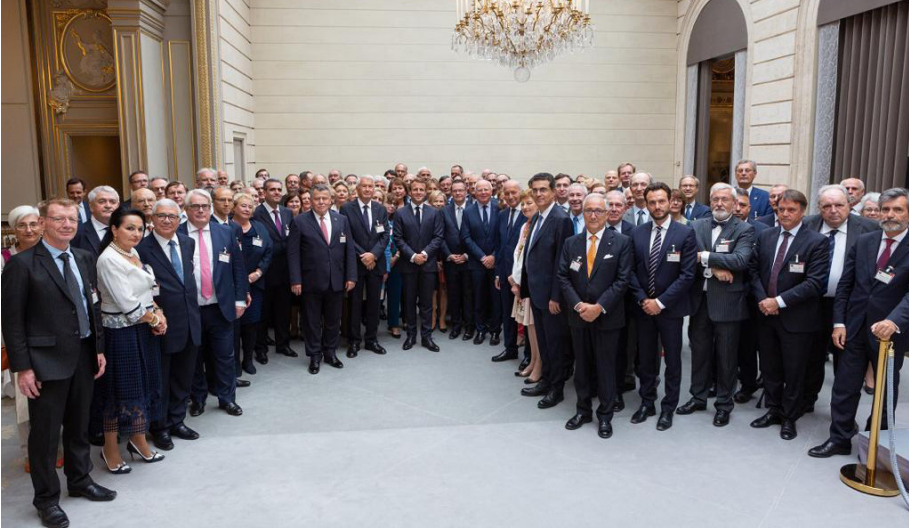
Avrupa Konseyi Yüksek Mahkeme Başkanları Toplantısı (14 Ekim 2019)