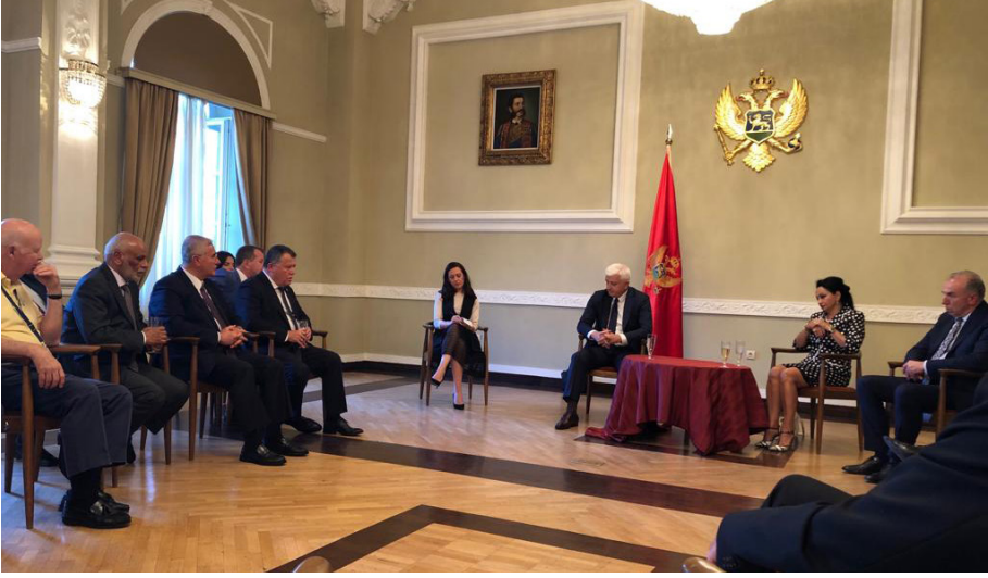
Karadağ Ziyareti (24-26 Haziran 2019)