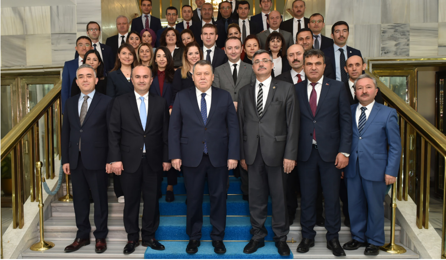
Yargıtay Başkanlığı (10 Şubat 2019)