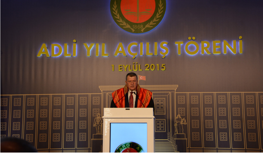
Adli Yıl Açılışı Töreni (2015-2016)