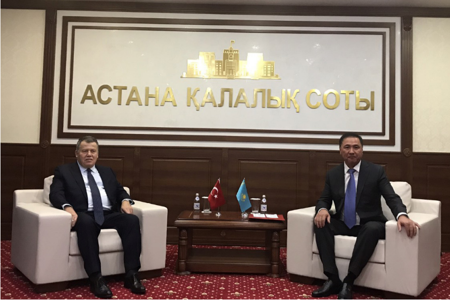
Kazakistan Ziyareti (21-27 Ekim 2017)