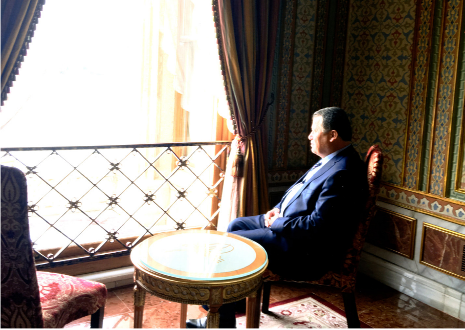
İstanbul 1. Hukuk Kurultayı Dolmabahçe Sarayı (17 Ekim 2016)