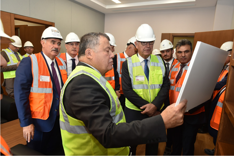
Yargıtay Yeni Hizmet Binası Şantiye Toplantısı (24 Eylül 2019)