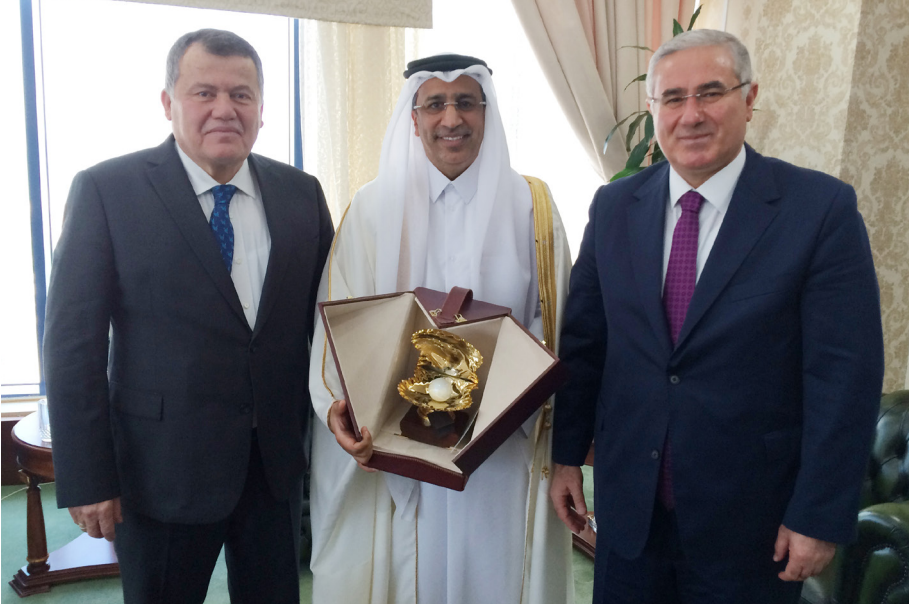
Katar Ziyareti (30 Kasım-3 Aralık 2016)