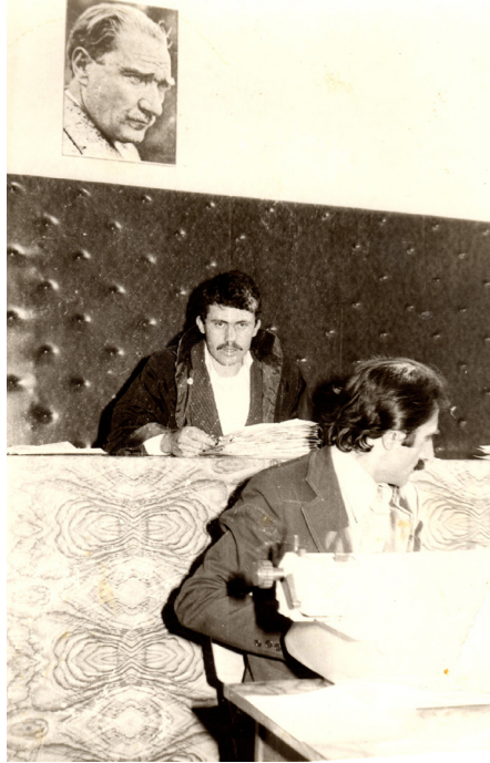
Hakkari Ceza Mahkemesi