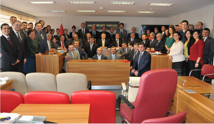
13. Ceza Dairesi Başkanlığı Günleri