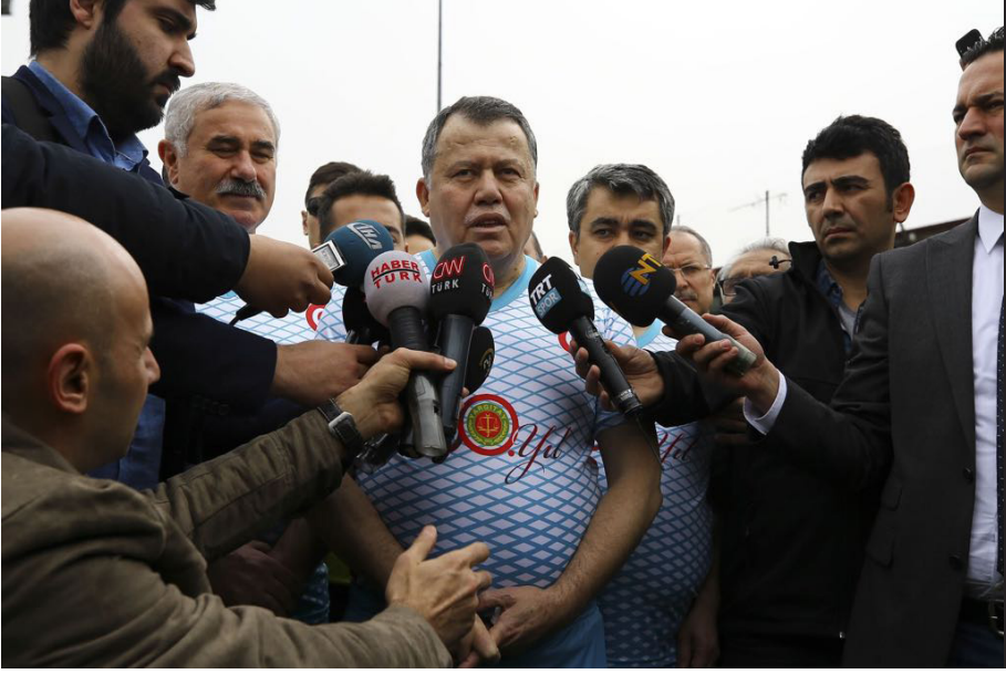
Yargıtay Başkanlığı ile Ampute A Milli Futbol Takımı Gösteri Maçı (23 Mart 2018)