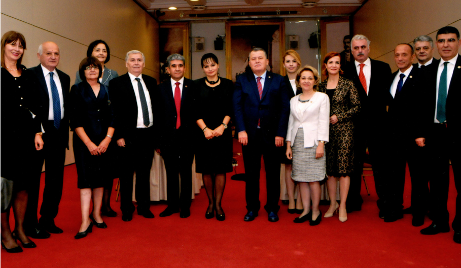
Karadağ Ziyareti (28 Eylül-02 Ekim 2015)