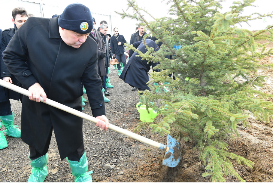
150. Yıl Hatıra Ormanı Fidan Dikim Töreni (01 Mart 2018)