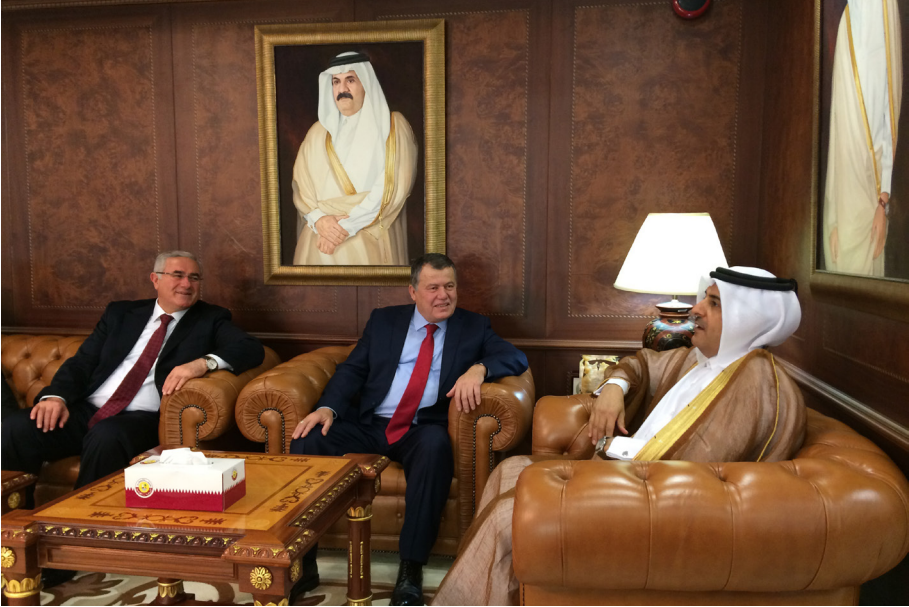
Katar Ziyareti (30 Kasım-3 Aralık 2016)