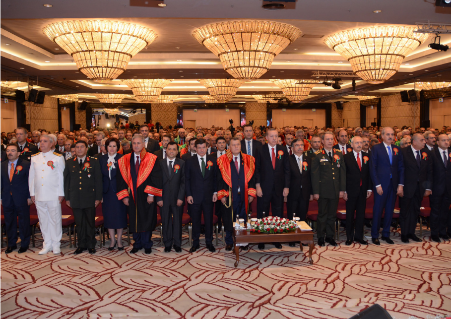
Adli Yıl Açılışı Töreni (2015-2016)