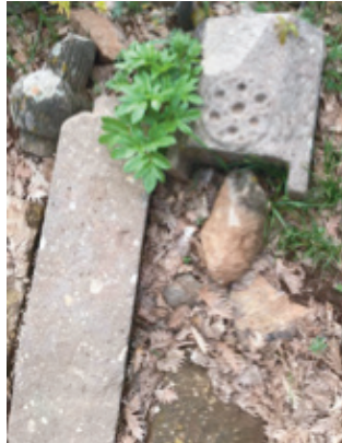
Foto 1.2.19. İpınar Ky Ky Dışındaki Mezarlıkta XX No.lu Mezar

Bu mezar tamamen tahrip olmuş olup mezara ait taşlar çevreye yayılmıştır. Aynı yerde bulunan ve sadece üst kısmı bulunan şahide taşı, bir ayak taşı ve kapak taşının bir kısmı bulunmaktadır. Şahide taşı taşırılmış kavuk şeklinde olup üst tarafı düz yivlerle hareketlendirilmiş bir kavuk ile son bulmaktadır. En dikkat çeken unsur ise kapak taşından kalanlardır. Büyük kısmı tahrip olmuş kapak taşının üzerinde kabartma şeklinde dairesel bir motif bulunmaktadır dairenin içinde ortada bir adet, etrafında daire oluşturacak şekilde dizilmiş altı adet toplam yedi adet oyuk bulunmaktadır. Bu motife benzer motifler, Kiğı Açıkğüney Ky'nde bulunan Arnavut mezarlarında bulunmaktadır. Açıkğüney köylüleri bu motife Hızır yıldızı ismini vermektedirler. Ancak bu motifin kahve tepsisini sembolize ettiğini çeşitli çalışmalar ve yine Açıkğüney köyündeki bazı mezar taşlarındaki bu motif ile birlikte verilen kahve veya su ibrikler göstermektedir.