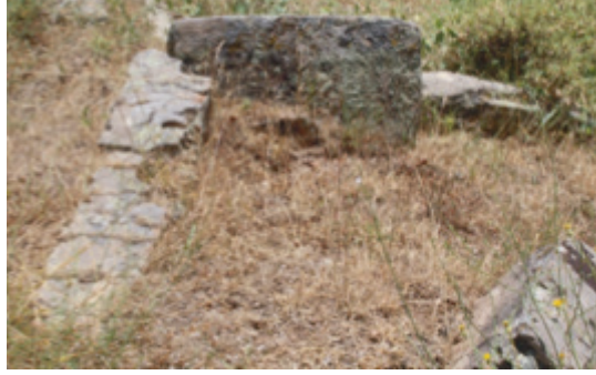
Foto 1.1.6. İçpınar Köyü Eski Mezarlıkta VI No.lu Mezar

Bu mezar yaklaşık 15 metre uzunluğunda devam eden sandukanın bitiminde yer alan bir ayak taşı ile son bulmaktadır. 15 metrelik kuzey tarafta bulunan yan kapak birkaç mezara ait olmalıdır. Aralarda bulunan bazı taşlar bunun göstergesidir. Ancak şahide ve ayak taşları tahrip edilip yerlerinden edilmiştir. Güney tarafta bulunan kapak taşı da mezarlar boyunca uzanmaktadır. Kapaklar oldukça kalın tutulmuş kimi yerde 30 cm'ye yaklaşmaktadır. Var olan ayak taşı dikdörtgen şeklinde olup kapaklar ile aynı formda oldukça kalın tutulmuştur. Yapılacak kazı çalışmaları neticesinde mezar taşlarının tam mahiyeti ortaya çıkacaktır.