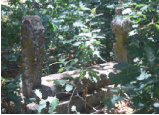
Foto 1.2.12. İcınar Köyü Köy Dışındaki Mezarlıkta XIII No.lu Mezar

Bu mezar ağaçların arasında kalmış ve aşırı derecede yosun tutmuştur. Mezarın sandukası, şahidesi ve ayak taşı sağlam bir şekilde günümüze ulaşmıştır. Sanduka beşgen prizma bir kapak ile örtülmüştür. Beşgen prizma şeklinde olan kapak kısmının şahide ve ayak kısımlarında birer dikdörtgen bilezik açılmış ve ayak ile şahide taşı bu bileziklere geçirilmiştir. Şahide taşı dikdörtgen bir gövdeye sahip olup daha sonra 7 cm bir girinti ile boyun kısmı oluşturulmuştur. Boyun kısmı dairesel olup buradan da taşırılmış ve üzerinde yivler olan bir kavuk kısmı meydana gelmiştir. Taşırılmış bu kavuk üst kısımda düz yivlere sahip bir üst kısım ile sonlanmıştır.