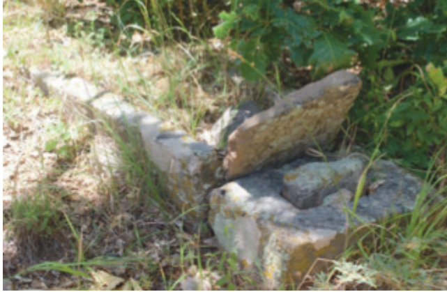
Foto 1.2.9. İçpınar Köyü Köy Dışındaki Mezarlıkta X No.lu Mezar

Yan kapakları ve şahide taşının geçirildiği taban taşı dışındaki taşlar bulunmamaktadır. Herhangi bir süslemesi bulunmayan mezarın yan kapakları ve şahide taban taşından anlaşıldığı kadarıyla ince işçiliğe sahip bir mezardır. Üst kapağı bulunmayan mezarın yan kapakları da toprak altında kaldığından bir süsleme unsuru olup olmadığı hakkında fikir edinilememektedir.