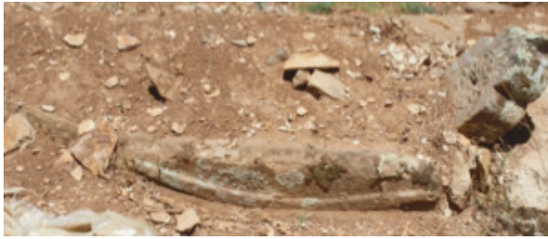
Foto 1.2.5. İcınar Köyü Köy Dışındaki Mezarlıkta VI No.lu Mezar