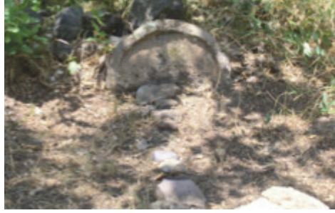
Foto 1.2.14. İçpınar Köyü Köy Dışındaki Mezarlıkta XV No.lu Mezar

Şahide ve ayak taşı sağlam olan bu mezarın sanduka kısmı toprak altında kalmıştır. Şahidesi ve ayak taşı da büyük oranda toprak altında olan mezarda süsleme olup olmadığı anlaşılamamaktadır. Şahidesi yuvarlak kemerli bir kitime kısmına sahiptir. İç tarafta yer alan bu kısımda herhangi bir süsleme ya da yazı bulunmamaktadır.