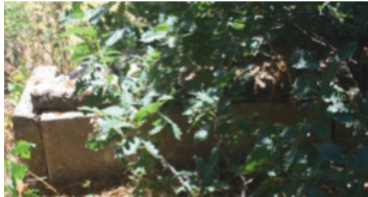
Foto 1.2.13. İcınar Köyü Köy Dışındaki Mezarlığında XIV No.lu Mezar

Bu mezarın sandukası sağlam olup şahide ve ayak taşı tahrip olmuştur. Sandukanın yan kapakları düzgün blok kesme taştır. Üst kapak yerinden sökülmüştür. Herhangi bir süslemeye sahip değildir.