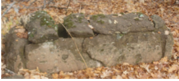
Foto 1.2.8. İçpınar Köyü Köy Dışındaki Mezarlıkta IX No.lu Mezar

Dikdörtgen bir sandukadan ibaret olan bu mezarın sandukası tahrip edilmiştir. Şahide ve ayak taşı bulunmayan mezarın sandukası parçalara ayrılmış olmasına rağmen bir bütün halinde bir arada durmaktadır. Çevrede bulunan bazı şahidelerin bu mezara ait olması gerekmektedir. Bu haliyle mezarda herhangi bir süsleme veya yazı tespit edilememiştir.