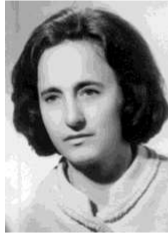
Res. 2 Elena Ceausescu.

https://upload.wikimedia.org/wikipedia/commons/0/01/Nicolae_Ceau%C8%99escu.jpg (ET: 09.2020) https://upload.wikimedia.org/wikipedia/commons/9/93/Elena_Ceausescu_portrait.jpg (ET: 09.2020)