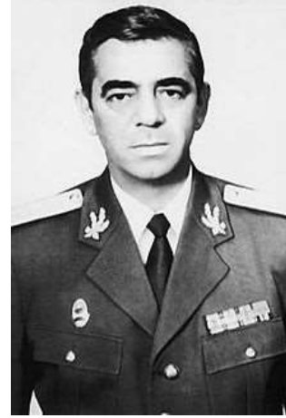
Res. 10 Darbeci Genelkurmay Başkanı Ştefan Guşa .

https://upload.wikimedia.org/wikipedia/ro/1/11/StefanGusa2.jpg (ET: 09.2020)