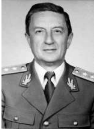
Res. 9 Darbeci General Victor Stanculescu .

https://static01.nyt.com/images/2016/06/22/world/22victor-obit/22victor-obit-articleLarge.jpg?quality=75&auto=webp&disable=upscale (ET: 09.2020).