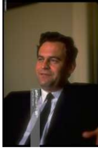
Res. 5 Provokatör Macar Papaz László Tókés .

https://www.regisautographs.com/wp-content/uploads/2017/11/Scan-123-5-e1511957047432.jpeg , (ET: 09.2020)