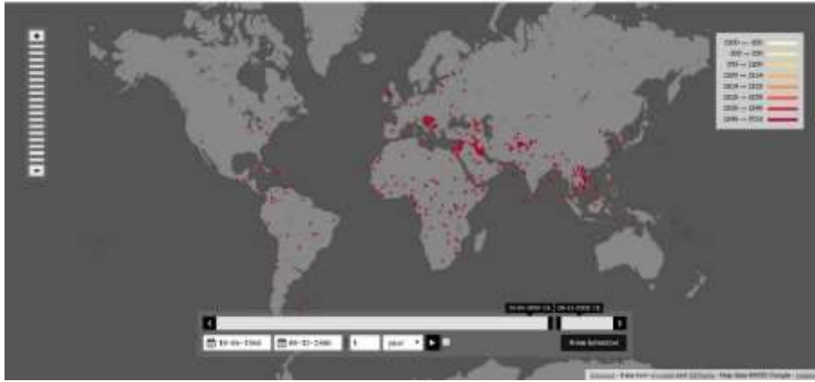
Şekil 1: 1960-2006 Yılları Arasında Dünyada Meydana Gelen Silahlı Çatışmalar 1

Yazının devamında şekiller ve grafikler üzerinden dünyada yaşanan savaşlara bakacak olursak;