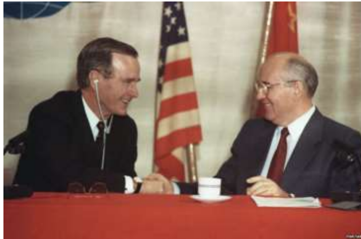
Res. 3 G. H. W. Bush (sol) ve M. Gorbaçov (sağ) 3 Aralık 1989.

https://reconsideringrussia.files.wordpress.com/2014/04/bush-gorbachev.jpg , ET: 25.09.2020)