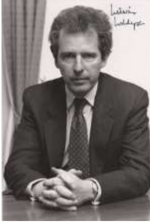
Res. 4 İngiliz Müsteşar William Waldegrave .