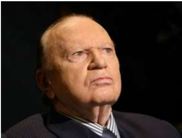
Res. 7 Darbenin fikir babası Silviu Brucan .

https://en.wikipedia.org/wiki/File:CFSN_Revolution_Roumaine.jpg (ET: 09.2020)