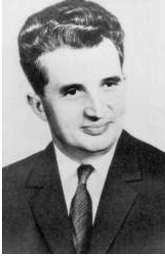
Res. 1 Nicolae Ceausescu.

https://upload.wikimedia.org/wikipedia/commons/0/01/Nicolae_Ceau%C8%99escu.jpg (ET: 09.2020) https://upload.wikimedia.org/wikipedia/commons/9/93/Elena_Ceausescu_portrait.jpg (ET: 09.2020)