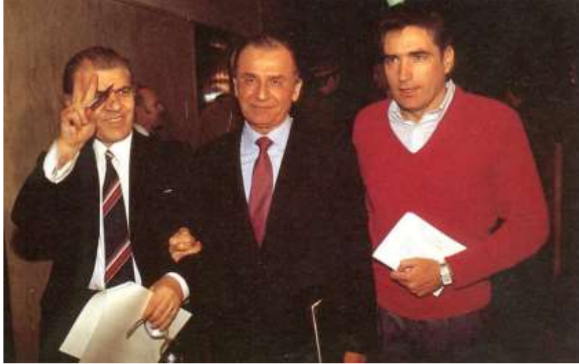
Res. 6. Dumitru Mazilu, Ion Iliescu ve Petre Roman. (soldan sağa doğru)