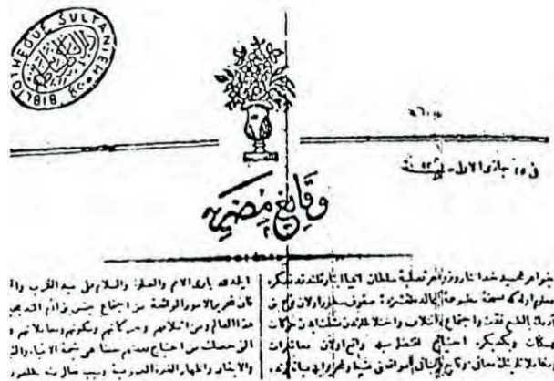
Resim 1. Vakayii Mısriyye'nin 1. Sayısının Başlığı (Koloğlu, 2010: 8)

Yeni bir görünüme bürünen Mısır'da bir iletişim aracı ihtiyacı ortaya çıkmıştır. İşe planlı olarak başlayan Mehmet Ali, Nikola Musabek'i 1815'te harf dökme ve baskı sanatını öğrenmesi için İtalya'ya göndermiş ve basımevinde çalışacak birçok kişiyi yetiştirmiştir (Koloğlu, 2014:22). 1820'de Bulak Basımevi kurulmuş ilk eserler 1822'de verilmiştir. Gazeteye yönelik ilk adım 1826'da Bulak basımevinde Curnalu'l Hidivi isminde bir bülten çıkarılmasıyla atılmıştır. Dar bir çerçeve içinde kalan Curnalu'l-Hidivî, 100 adet basılarak üst kademe yöneticilere ve askerlere gönderilmiştir (Yazıcı, 1991: 268). Mehmet Ali, Divan'da ele alınan konulardan seçilmiş olanların yazılması için 1828 yılında Vakayii Mısriyye gazetesini çıkarmaya karar vermiştir. 4 Aralık 1828'de gazetenin ilk sayısı 4 sayfa olarak yayınlanmış, iki sütundan oluşan sayfaların sağ tarafı Türkçe, sol tarafı Arapça yazılmıştır. Gazetenin iki dilde yayınlanmasının sebebinin Koloğlu gazetenin 34. sayısından aktarmıştır (Koloğlu, 2014:61); "Mısır ahalisi Türk ve Arap karışımı olup her iki tarafın da yararlanabilmesi için Vakayii Mısriyye Türkçe ve Arapça dilleri ile ve hüner bir tarz icad etmektedir." Gazetenin Arapça bölümünün Türkçe bölümünde yazılanların çevirisi olduğu bilinmektedir. Önce Türkçe metinler hazırlanarak valinin onayına sunulmuş, onaylanan metinler Arapçaya çevrilerek hem Türkçe hem de Arapça metin gazetede yayınlanmıştır.