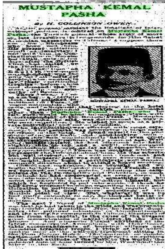
Resim 1. 12 Mart 1920 tarihli Daily Mail Gazetesi

Bununla beraber, gazete Mustafa Kemal Paşa'nın "Ermeni katliamını yapan ordunun" mensubu olduğunu belirtmekte ve bu tavrıyla Türk Kurtuluş Savaşı'na kara çalmaya çalışmaktadır. Gazeteye göre, o dönemdeki her Türk gibi Mustafa Kemal'de İngiliz gazetelerine konuşmaya can atmaktadır. 1918 yılında Paşayla Pera Palas otelinde mülakat yaptığını belirten muhabir, "Mustafa Kemal'in şu sıralarda Anadolu'da sorun çıkarmaya hazırlandığını " da sözlerine ekledikten sonra konuyu yeniden Ermenilere getirerek, Anadolu'daki İngiliz çıkarlarını desteklediğini ve Türk Kurtuluş Savaşı'nı "sorun" olarak nitelendiğini açıkça belirtmektedir (Daily Mail, 12 Mart 1920). Bu noktada gazetenin yayın politikasının, Mustafa Kemal ve Millî Mücadele hareketini mümkün olduğunca yıpratmak ve tahkir etmeye çalışmak olduğunu söyleyebiliriz.