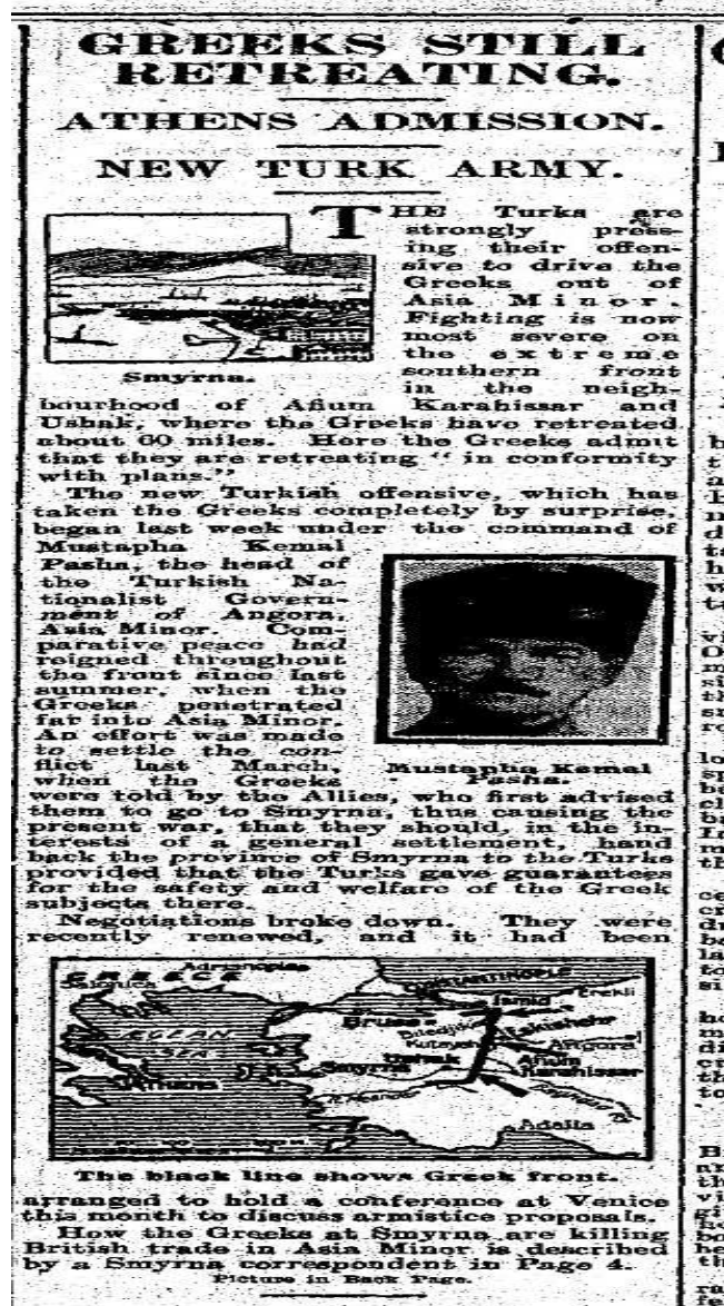
Resim 2. Daily Mail Gazetesi'nin 2 Eylül 1922 tarihli nüshası: "Yunanlılar Geri Çekilmeye Devam Ediyor"

2 Eylül 1922 tarihli Daily Mail Gazetesi, "Yunanlılar Geri Çekilmeye Devam Ediyor" başlıklı haberinde, "Yeni Türk Ordusu" alt başlığını kullanmış ve Mustafa Kemal Paşa'yı "Ankara'daki Milliyetçi Türk Hükümeti'nin Başı" olarak açıkça tanımıştır. Haberde ayrıca Paşa'nın gerçek bir fotoğrafı kullanılmıştır ( Daily Mail , 2 Eylül 1922). Gazetenin Türkiye muhabiri G. Ward Price'nin özel haberi ile, Yunanlıların telaş içinde adalara doğru kaçtıklarına yer verilmiştir. Bu süreçte İngilizler olaylara müdahale etmekten kaçınmış çünkü İngiliz sömürgelerinden Hindistan'daki Müslümanların Türk-Yunan Savaşı'ndaki İngiliz tavrını dikkatle izledikleri belirtilmiştir. Bu yüzden General Harrington, olaylara müdahale etmeyeceğini açık bir biçimde taahhüt etmiştir ( Daily Mail , 13 Eylül 1922). Bu haberde önemli olan nokta, başarıya ulaşan Türk Kurtuluş Mücadelesi'nin artık Anadolu sınırlarını aşmış, tüm mazlum milletlere örnek olduğunun tasdik edilmiş olmasıdır.