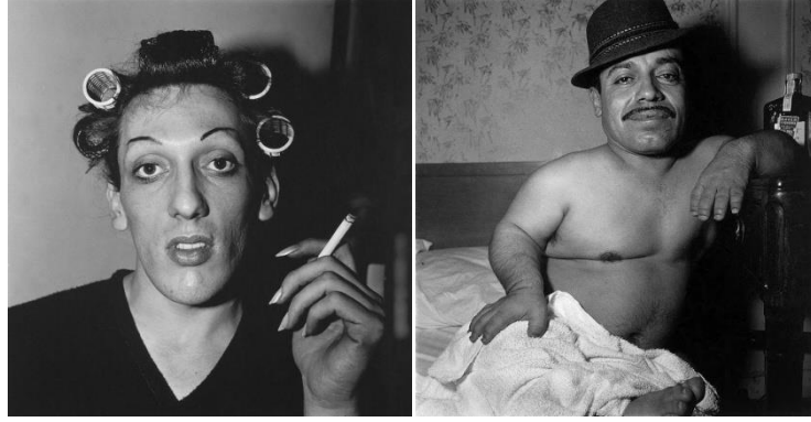
Görsel 1-2. Bigudili Genç Adam (1966) - Meksikalı Cüce (1955), Daidane Arbus.

bu tarihe kadar toplum tarafından ötekileştirilenleri çalıştıkları yerlerde veya evlerinde, onları sadece gördüğü anda fotoğraflamamış, onların hayatına girerek, birlikte zaman geçirerek, onlarla yaşayarak, kendini kabul ettirerek fotoğraflamıştır. O fotoğraflarında yer alan kişilere toplum tarafından bakıldıkları gibi değil, aralarından biri olarak onları görmüş ve fotoğraflarına da bu bakış açısını yansıtmıştır.