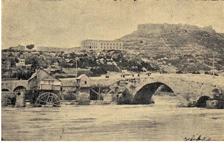
Resim 5: Taş Köprü'nün Ayağındaki Değirmen ( https://www.pinterest.com/pin/337277459574522426 ). Erişim Tarihi: 23.03.2021.