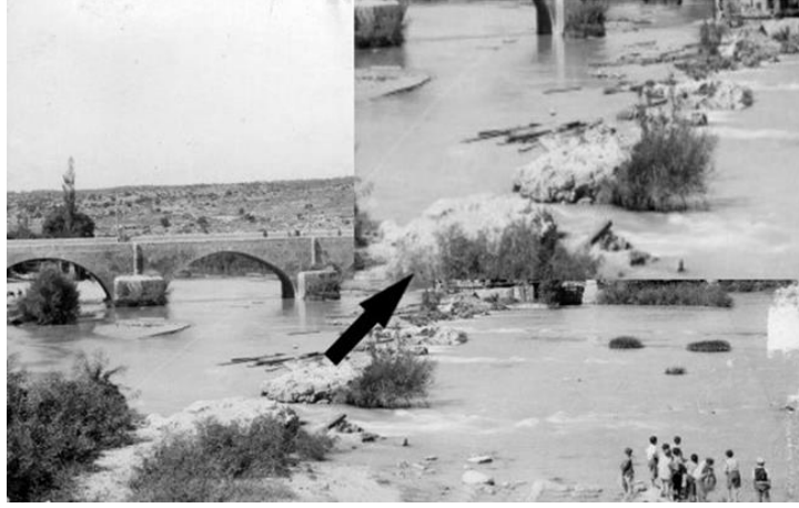
Resim 4: Taş Köprü'nün Alt Tarafındaki Su Bendi Kalıntısı.

(aşağıdaki fotoğrafta kalıntıları görülen) sulama amaçlı bendin tarımsal sulama için kullanılmadığı anlaşılmaktadır.