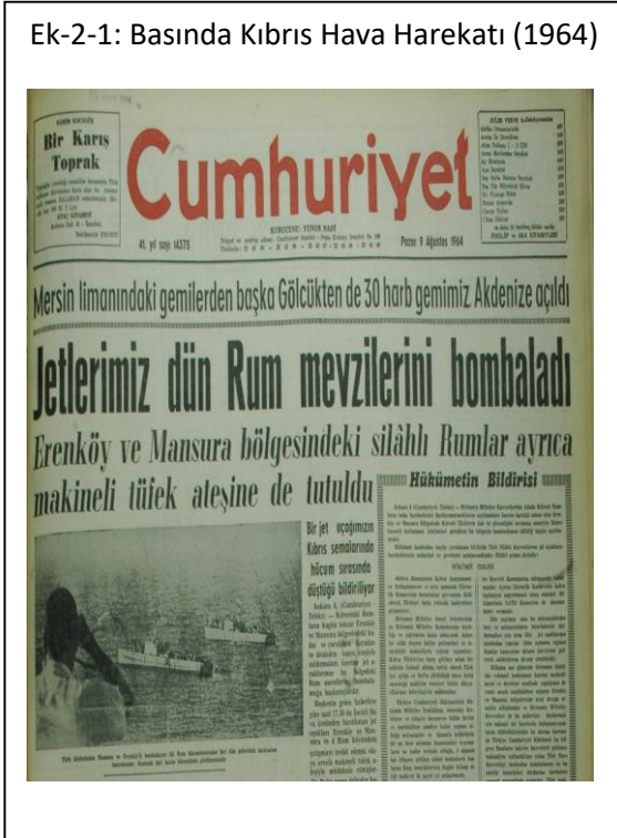
Ek-2-1: Basında Kıbrıs Hava Harekatı (1964)