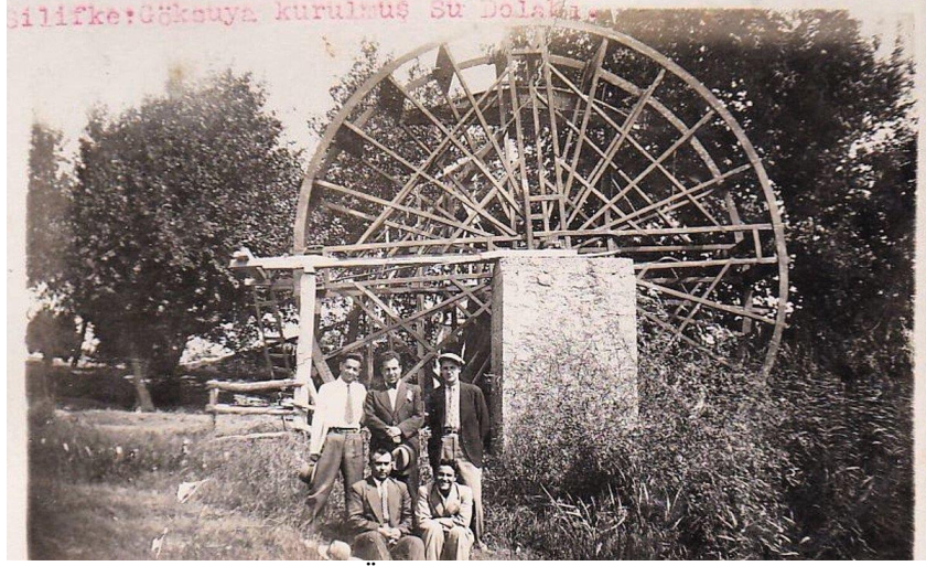
Resim 3: Göksu Nehri Üzerinde Bir Su Dolabı (1950'li Yıllar)

bu yatırımlardan önce, Mutasarrıf Şahabettin Efendi devrinde bir su dolabı (Resim: 3) yaptırıldıysa da nehrin azgın sularından dolayı bu dolabın mahvolduğu da hatırlatılır 15 (BOA. ŞD. 2135.3/5). Bu belgeden anlaşıldığı kadarıyla eski İçel Mutasarrıfı Şahabettin Bey ve yeni Mutasarrıf Mehmet Nüzhet Paşa devrinde 16 köprü geçiş vergisi tahsilat yetkisi, belirli aralıklarla ihaleye çıkarılmakta ve ihaleyi alandan tahsil edilmektedir. Tahsil edilen tutardan, geçiş vergisi alımında görev yapan memurların maaş giderlerinin de düşüldüğü görülmektedir.