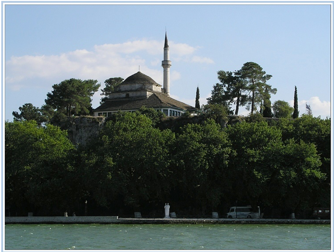
Fig. 3- Yanya/Ioannina Fortress, Aslan Pasha Mosque