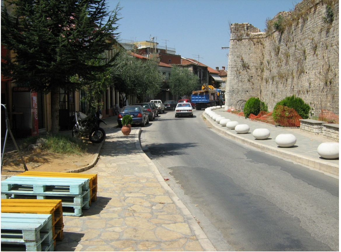
Fig. 10-The Wall of the Fortress