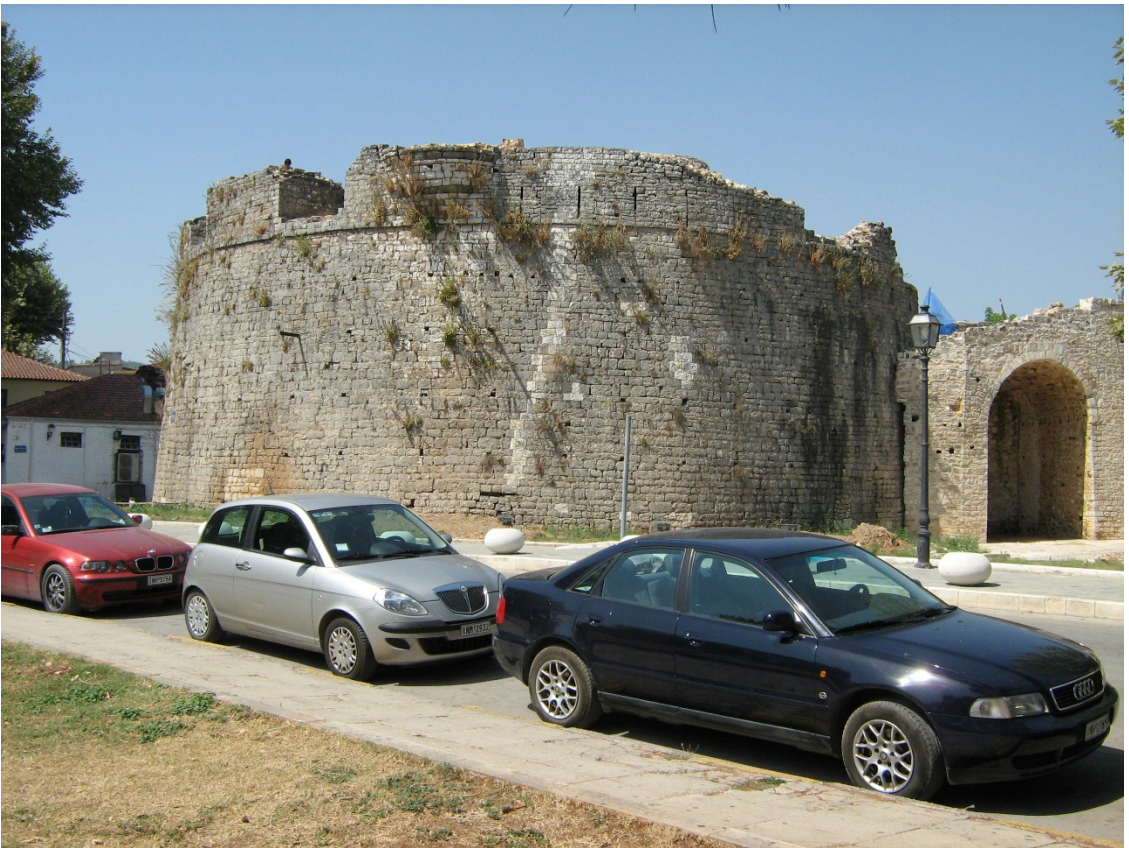
Fig. 9-Butcher Bastion