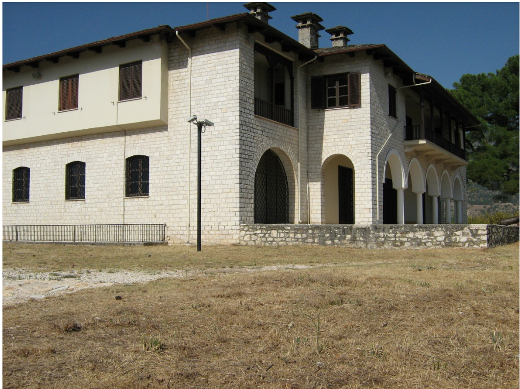
Fig. 5-The Pasha Seraglio