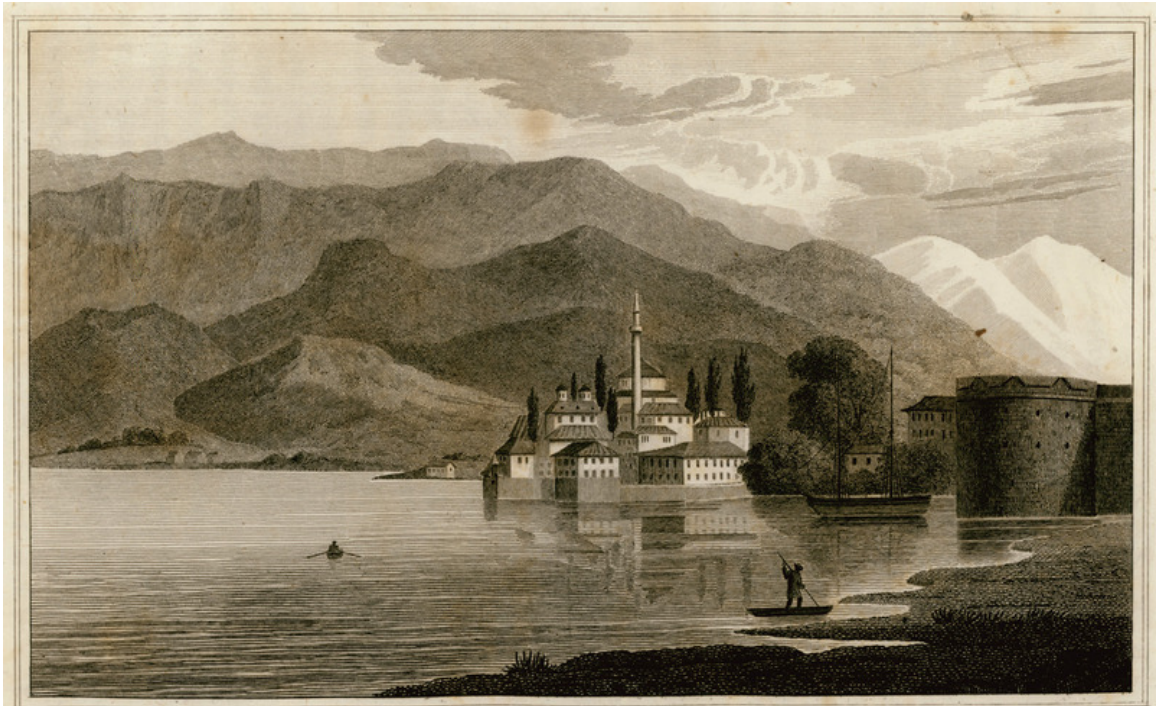
Fig. 11- The Mosque of Aslan Pasha and the Fortress (From. Henry Holland 1812) https://en.travelogues.gr/collection.php?view=36