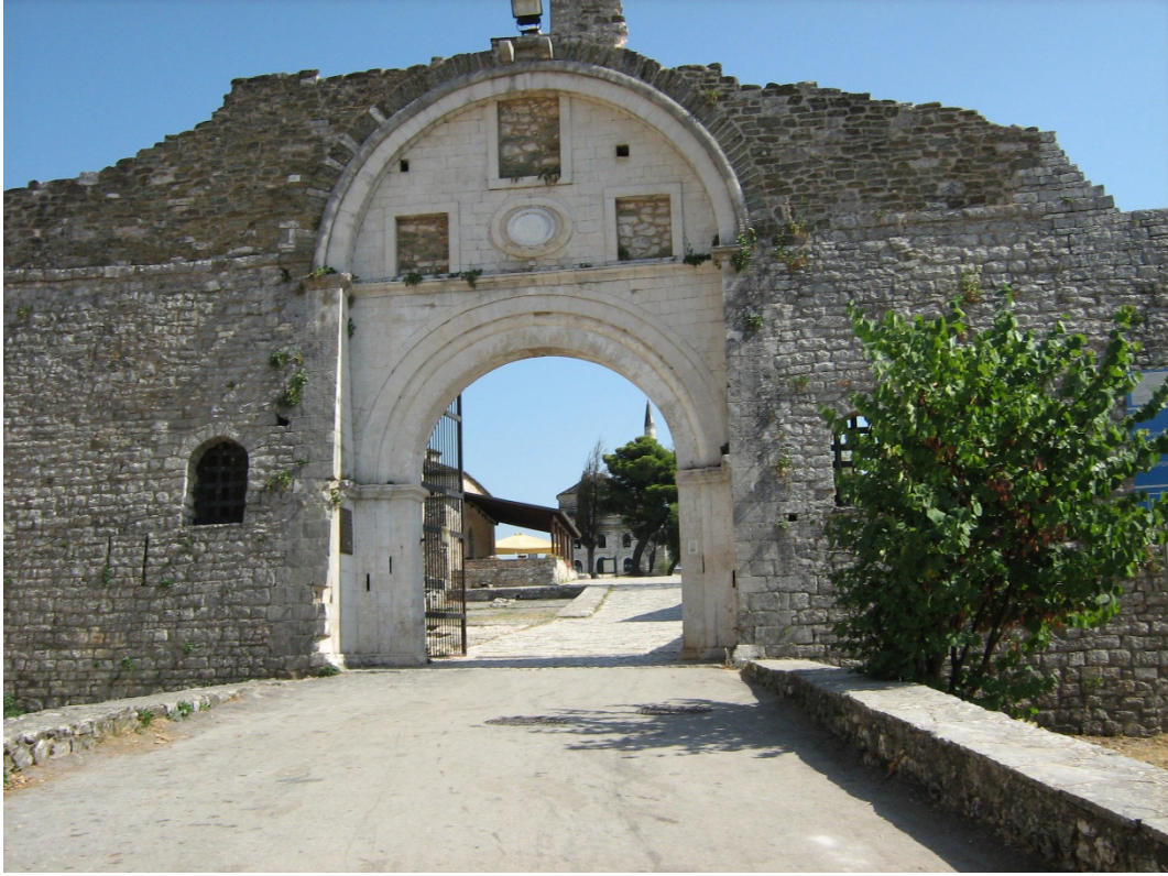
Fig. 4- Main Gate of the Interior Fortress