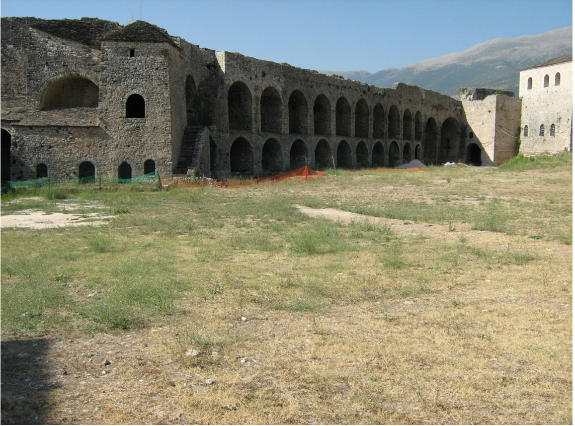
Fig. 8-The Bastion of the Sahin Room