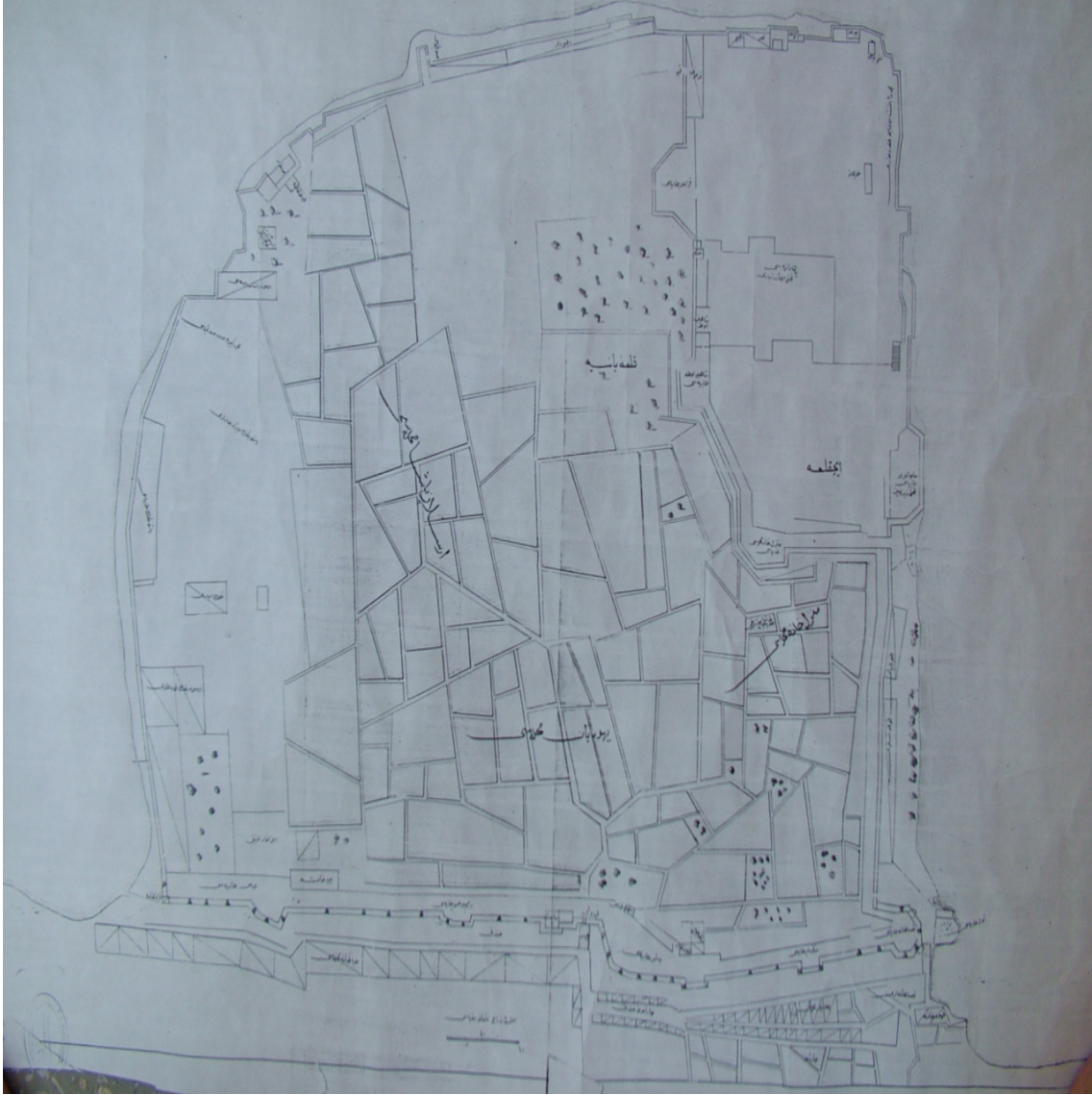
Fig. 1- Chart of Yanya/Ioannina

(Catalogue of Plan, Project and Drawing of the Ottoman Archives, İstanbul, Numbered 872)