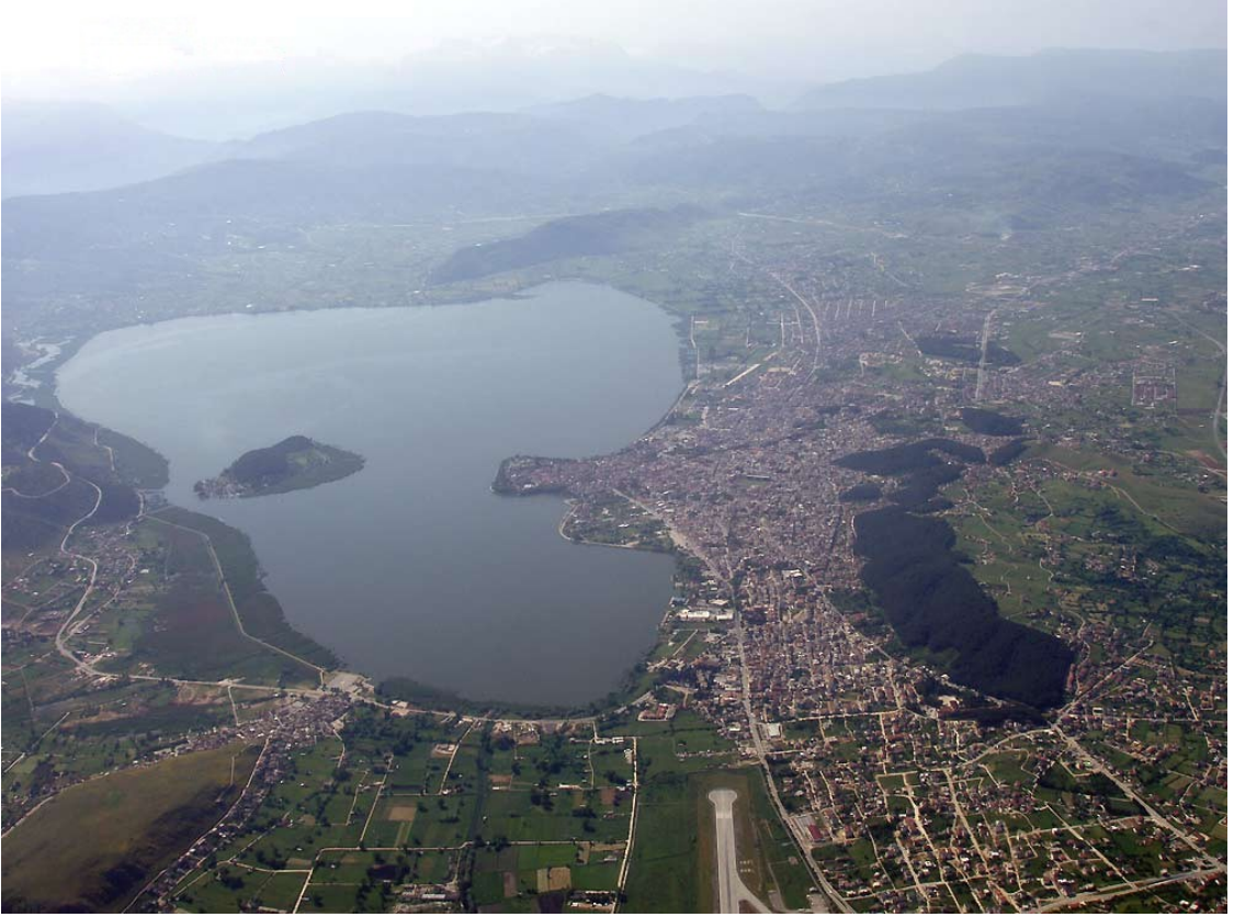
Fig. 2- Yanya/Ioannina city, General View from West Side