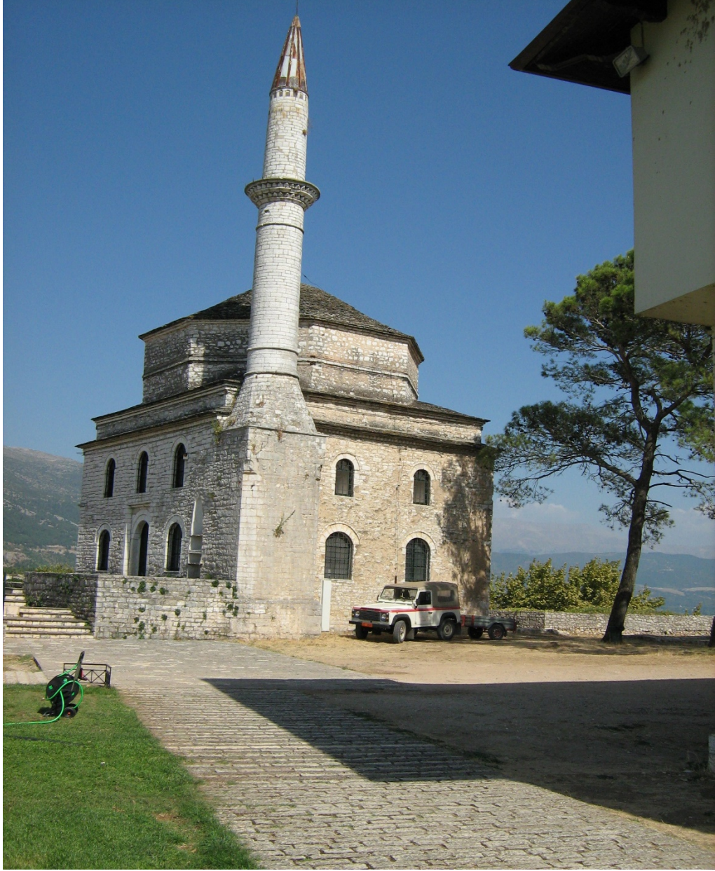
Fig. 6- Fethiye Mosque