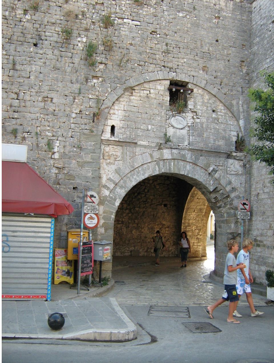
Fig. 7 -The Main Gate