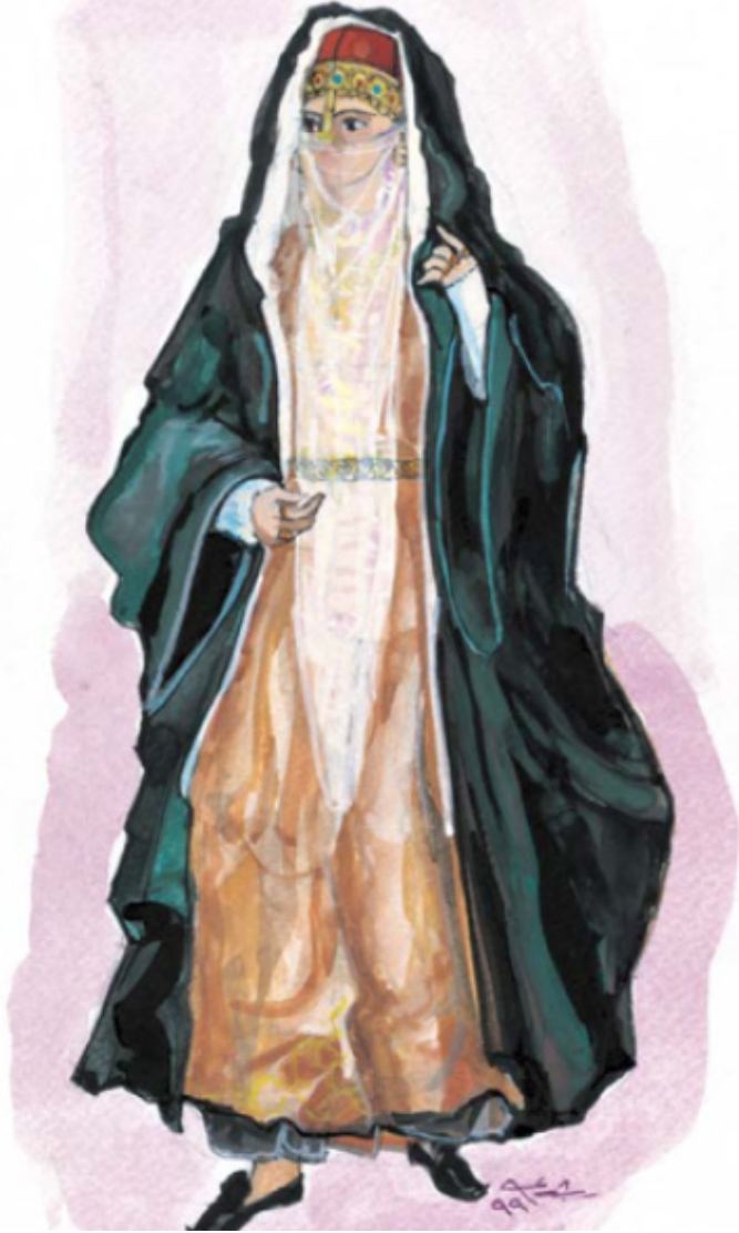
Ek 1: Mohamed Rushdy Tarafından Çizilen Bir Memlük Kadını 1 .