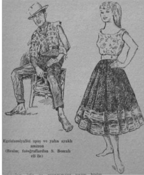
Resim 7-10. Yalın Ayaklı İstanbullular