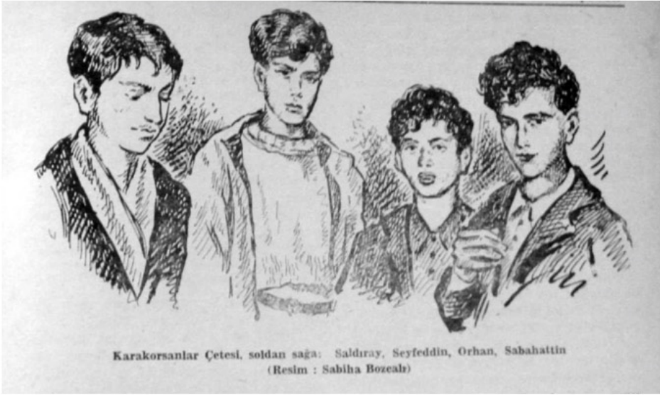
Resim 1 ve 2. Çocuk Hırsız Çeteleri

Öte yandan bu ilgi, arşivin gelecekle kurduğu bağı dramatize eden bir öge olarak da karşımıza çıkar. Derrida'nın (1995: 27) söylediği gibi, arşiv geçmişten çok gelecekle ilgili bir şeydir; arşiv sorusu "[g]eleceğe dair bir sorudur, geleceğin kendisine dair bir soru, bir cevabın, geleceğe duyulan sorumluluğun sorusudur." Her arşiv, gelecekteki insanların onu tanınması, ona erişmesi ve onu okuması amacıyla var edilir . Heteronormal gelecek sathında ise "Çocuk" figürü durur (Edelman, 2007: 474). Resmi arşivler, gelecek nesillerin atalarını tanıyabilmesi için biriktirilip korunur. Çocuk figürü, aileye dayalı gelecek tahayyüllerini ulusun geleceğiyle örtüştürür. Geleceğe umutla bakan genç Türkiye Cumhuriyeti de milliyetçi, disipliner, pedagojik, fütürist ve ailesel yatırımlarının kesiştiği bir figür olarak çocuğu yüceltmıştır. Koçu, Osmanlı'ya duyduğu melankolik