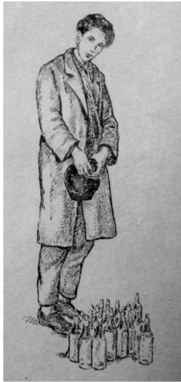
Resim 3-5. Çocuk Hırsız Çeteleri