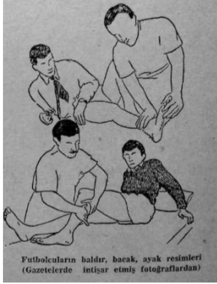
Resim 12. Baldır, Bacak, Ayak Masajı

“Bitirim Abdullah” maddesinde gördüğümüz üzere Koçu, çeşitli biçimlerde edindiği veya bir ihtimal İstanbul sokaklarında dolaşırken çektiği fotoğrafları (Emre Ayvaz, kişisel görüşme, 22.03.2021) arşivine katar. “Andriomenos (Nikola) ve Andriomenos Fotoğrafhanesi” maddesinde yetmiş senelik bu müessesenin tasnif ve muhafaza edilen bir arşivi olmamasından yakınır ve böyle bir arşivin, mutlaka devlet tarafından satın alınmağa değer olacağını söyler (Koçu, 1959: 852). Kayıp olayın en gerçekçi ikameleri olarak değerlendirilebilecek olan fotoğraf, Koçu nezdinde arşivlenerek muhafaza edilmesi gereken bir malzemedir. Korunmaya alınmadıklarında bu arşivesel kayıtlar dağılmakta, solarak yitip gitmektedir. Bu aşamada da devreye fotoğrafik kaydı ikame eden çizimler alır.