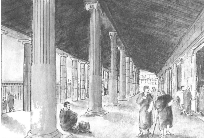
Priene Kutsal Stoa (Wycherley, 2011)

değiştirmekte ve kendine uygun hale getirmektedir (Can, 2003). Kentlerin yalçın noktalarında yağmur sularının rahatça akabilmesi için taş döşenmesi gerekmiştir (Wycherley, 2011). Bir diğer yandan, mekan tasarımları yapılırken hava şartlarının göz önüne alındığı antik dönem kentlerinden sıklıkla görülmektedir. Örneğin; Yunan kentlerinde stoa isimli mimari yapılar inşa edilmiştir. Ön tarafında sütunlar, arka tarafında duvar bulunan bu çatıya sahip mekan (Gates, 2015) sıcak havalarda insanların güneşten kaçmalarını ve kötü hava şartlarında sığınmalarını sağlamıştır (Wycherley, 2011). Doğa olaylarına müdahale edemeyen insan, kent yapılarını doğaya uyumlu hale getirerek kendini koruma yolları geliştirmeye çalışmıştır.