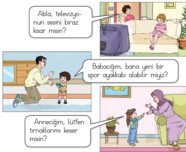
Görsel 3. İlkokul 1. sınıf HBDK'de saygı değeri ile ilgili görsel

"Otobüs, dolmuş gibi toplu taşıma araçlarına binmek için durakta sıraya girerek beklemeliyiz. Araçların ön kapısından sıra ile binmeliyiz ve arka kapısından inmeliyiz. İnmek için taşıtın tam olarak durduğundan emin olmalıyız. Araç içinde yüksek sesle konuşarak sürücüyü ve yolcuları rahatsız etmemeliyiz. Taşıt pencerelerinden elimizi, kolumuzu uzatmamalıyız. Taşıtları temiz kullanmalıyız."(s.127). İlkokul 2. sınıf HBDK'deki metinde geçen bu paragrafta toplu taşıma araçlarına binmek için sıraya girerek beklenmesi gerektiği ifade edilmektedir. Sabır ile ilgili tutum ve davranışlar arasında beklemeyi bilme ifadesi yer almaktadır. Dolayısıyla sıraya girme, bekleme davranışları sabır değeri ile ilgilidir.