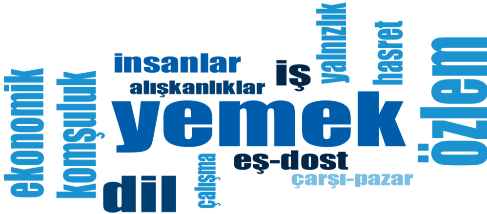
Şekil 1. Göç Sonrası Sorun Yaşanan veya Yabancılaşma Çekilen Konular

Katılımcıların Muş yemeklerine ilişkin bilgi düzeyleri de ölçülmüş ve sonuçlar Tablo 2’de raporlanmıştır. Katılımcıların %80’i (24 kişi) Muş yemekleri hakkında bilgi sahibi olduğunu ifade etmiştir. Bilgi sahibi olmadığını ifade eden katılımcıların çoğunluğu İstanbul’a göç etmiş kadınlardan oluşmaktadır. Bu kişilerin genellikle uzun süre önce göç etmiş kişilerden oluştuğu görülmektedir. Bu durumun ortaya çıkmasında belirleyici unsurlardan birinin bu olduğu söylenebilir. Ayrıca İstanbul’un metropol bir kent kimliğine