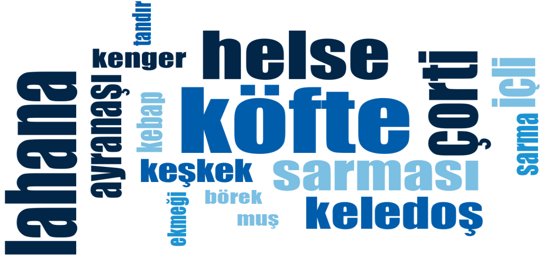
Şekil 2. Muş Yemekleri Bilgi Düzeyi Kelime Bulutu

Katılımcıların genellikle göç öncesi geleneksel ve ünlü Muş yemeklerini yaptıkları Tablo 3'ten anlaşılmaktadır. Sadece dört katılımcı göç öncesi yemek yapmadıklarını vurgulamaktadır. Bu kişilerin yaşları genellikle küçüktür. Ayrıca bu kişiler gerekçe olarak da bu yemeklerin aile içinde yapıldığını ancak kendilerinin değil başka aile bireylerinin (genellikle anne) bu yemekleri yaptıklarını vurgulamışlardır. Bu bulgular Muşlu kadınların göç öncesi yaşamda şehir kültürünün belirleyici unsurlarından olan yemekleri yaptıklarını göstermektedir.