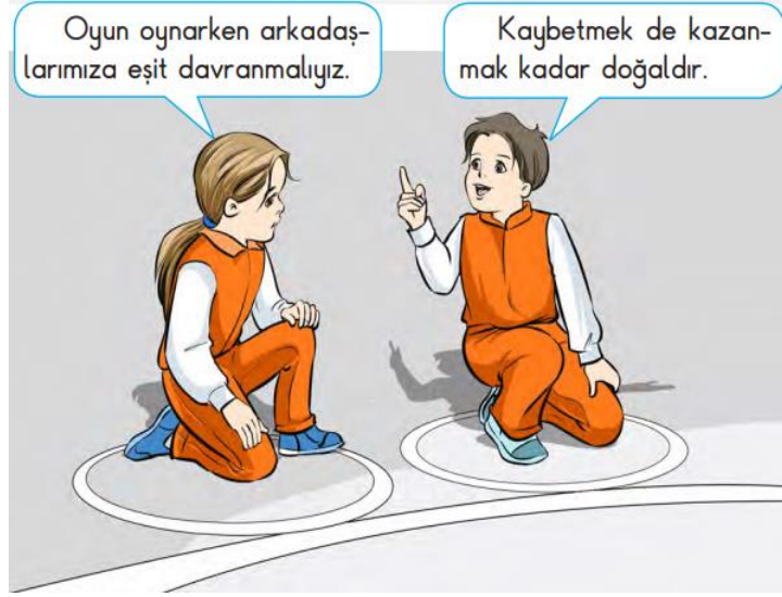
Görsel 1. İlkokul 2. sınıf HBDK’de adalet değeri ile ilgili görsel

Görsel 1 (s.42)’de öğrenciler arasında geçen diyalogda oyun oynarken eşit davranmanın gerekliliği üzerinde durulmuştur. Eşit davranma adalet değeri ile ilgili tutum ve davranışlar arasında yer almaktadır.