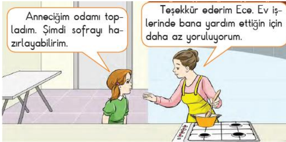
Görsel 4. İlkokul 2. sınıf HBDK'de sorumluluk değeri ile ilgili görsel

Görsel 4(s.76)'te odasını toplayarak sofrayı hazırlayabileceğini ifade eden çocuk ve ona teşekkür eden annesi resmedilmiştir. Görselin hemen altında şu ifadeye yer verilmiştir. “Evimizdeki sorumluluklarımızı yerine getirerek aile bireylerimize yardımcı olmalıyız.”. Görselde de altında yazan ifade de öğrencilerin evdeki sorumlulukları ifade ederek sorumluluk değeri vurgulanmaktadır.