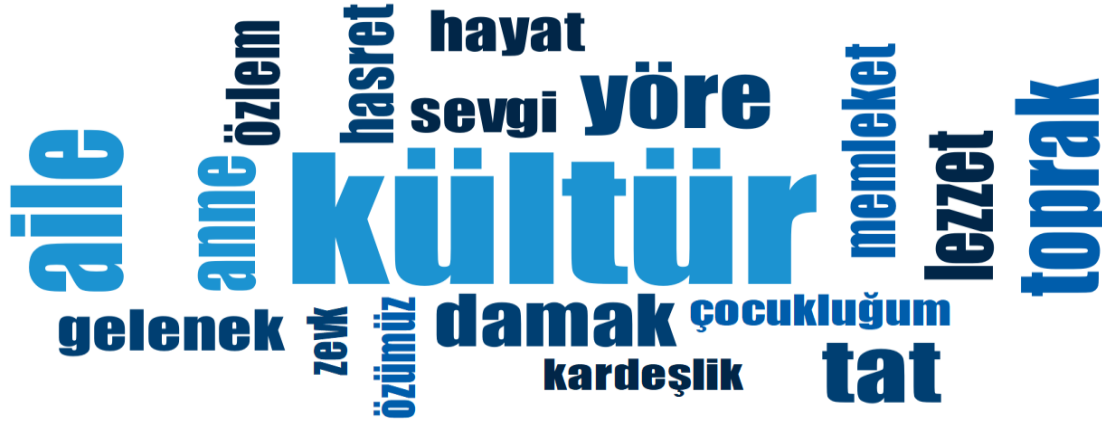
Şekil 4: Muş yemeklerinin Göç Edenler İçin Anlamı