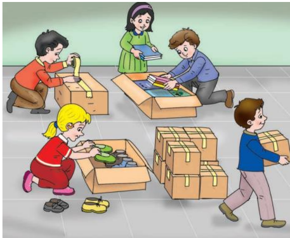
Görsel 2. İlkokul 3. sınıf HBDK’de dostluk değeri ile ilgili görsel

İlkokul 1. sınıf HBDK’de yer alan “ Ülkemize göç etmiş olan bu insanlara yardımcı olmak için neler yapabiliriz? Yazarak anlatalım. ”(s.154) soru ifadesinde başka ülkelerden gelen insanlara yardım etmek için öğrencileri düşünmeye sevk ederek yardımlaşmanın önemi üzerinde durulmaktadır. Dostluk değeri ile ilgili olan tutum ve davranışlar arasında yardımlaşma yer almaktadır.