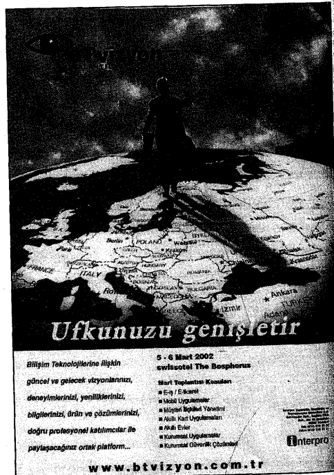
R5 - BT Vizyon