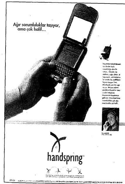
R8 - Handspring