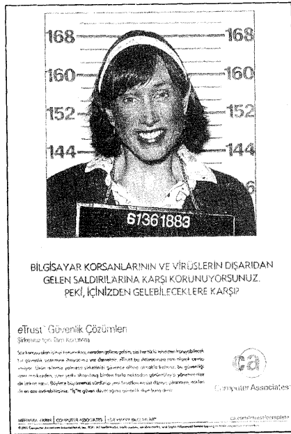
R10 - CA