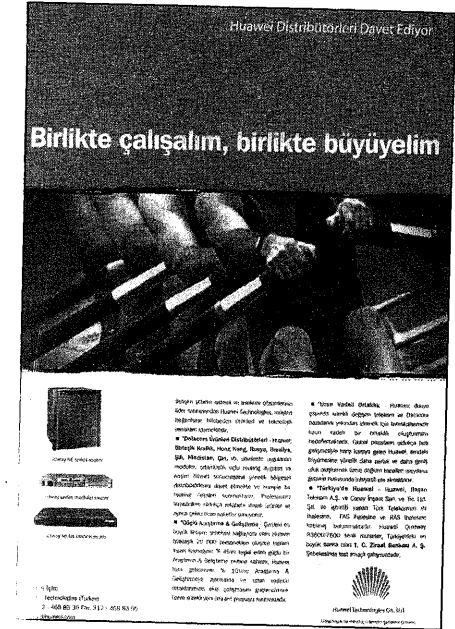
R7 - Huawei Technologies