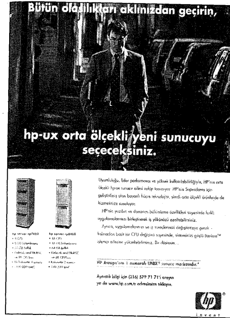
R6 - HP UX Sunucu

Huawei Technologies (R7) reklamında kullanılan erkek kürek takımı fotoğrafı ile profesyonellik ve takım ruhu vurgusu bir kez daha tekrarlanmaktadır. Aynı zamanda kasları gelişmiş vücutlardan da anlaşıldığı üzere uzmanlaşmak ve özveri ile çok çalışmak gerekmektedir. Distribütörleri çağıran bu reklam ile "biz" duygusu yaratılmaya çalışılmaktadır. "Birlikte çalışalım, birlikte büyüyelim" sloganı ile eğer güçlerimizi, uzmanlıklarımızı, gerekiyorsa sermayemizi biraraya getirerek birlikte çalışalım ve bunun getirisi olarak da birlikte büyüyelim, kazanalım, kâr edelim denmektedir. Bu reklam metnindeki çağırma teması oldukça sınırlı bir hedefe yönelmektedir. Çinli Huawei Technologies bu reklamı Türkiye'de ve Türkçe yayınlayarak, hedef kitlesini Türkiyeli distribütörlerle (dağıtıcı) sınır-