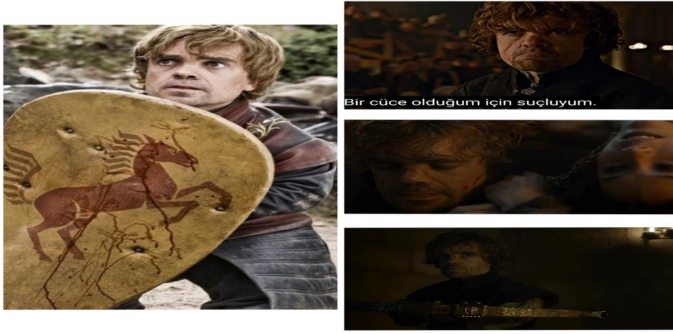
Fotoğraf 7: Tyrion'ın karakteristik dönüşümünün görsel yansımaları