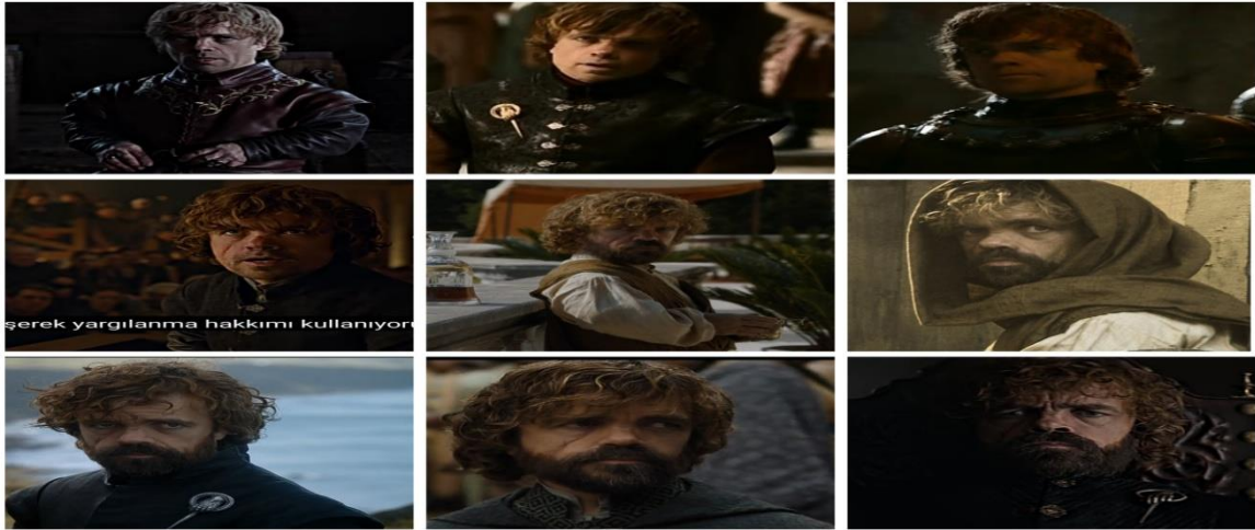
Fotoğraf 6: Tyrion Lannister karakterinin dizi boyunca görsel değişimi

Tyrion karakterinin ilk sezondan son sezona kadar fiziksel anlamda saç ve sakal gibi özellikleri belirginleştirilerek –tıpkı Deanerys'ın gücü arttıkça saçındaki örgülerin sayısı ve kalınlığının artması gibi- fiziksel görünüşü ve kıyafeti erkekliğini vurgulayacak şekilde belirginleştirilmiştir. Karasu savaşında yara alarak yüzünde bir yara izi kalması erkekliğini tanımlayan bir unsur olmuştur.