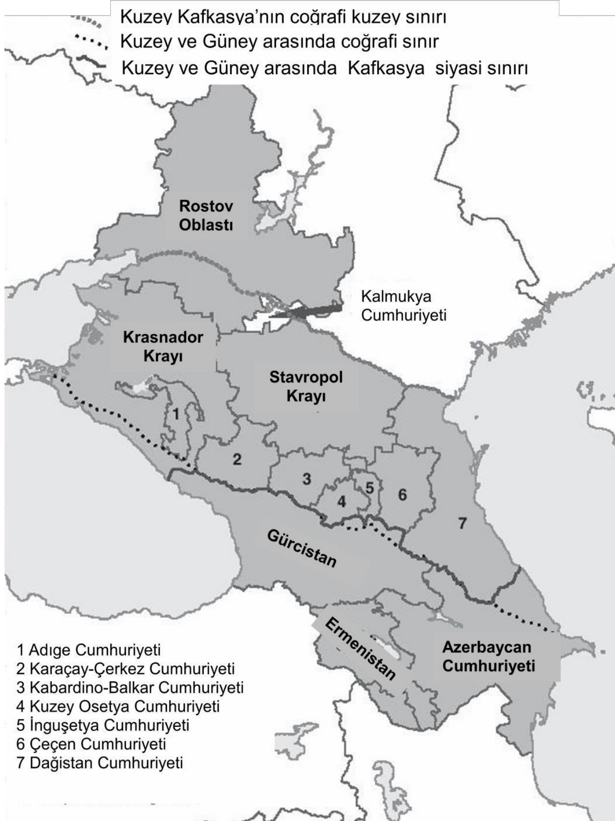
Şekil 1. Kafkasya İdari Bölümleri.

kazandı ve Balkarların dönüşüne izin verildi. Kendi yönetimleri olan on bölge ve üç şehirden meydana gelmektedir.