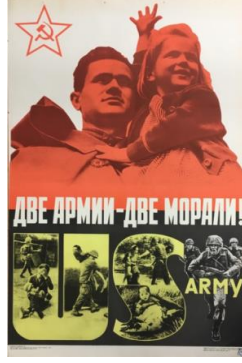
Resim 5. Ahlak Konulu Propaganda Posteri