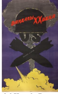
Resim 4. Vandal Konulu Propaganda Posteri