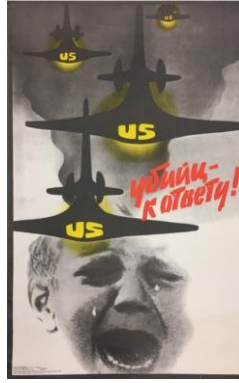
Resim 7. Hesap Konulu Propaganda Posterleri

Hesap konulu propaganda posterleri, Arseenkov Viktor Fedorovich tarafından 1986 yılında hazırlanmıştır. Posterin sağında Katiller suçlarının hesabını vermeli! (Убийц - к ответу!) yazısı bulunmaktadır. Görüntüsel gösterge boyutunda incelendiğinde posterde ağlamakta olan küçük bir çocuğa yer verildiği görülmektedir. Posterin üstünde de havalanmakta olan siyah renkte üstünde “US” yazısı yer alan uçaklar bulunmaktadır.