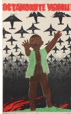
Resim 2. Katil Konulu Propaganda Posteri

Katil konulu propaganda posteri, Artsrunyan Eduard Simonovich tarafından 1965 yılında hazırlanmıştır. Posterin üstünde Katilleri durdurun! (Остановите убийц!) yazısı bulunmaktadır. Görüntüsel gösterge üzerinden ele alındığında posterde ağlamakta olan siyahî küçük bir çocuğun resmedildiği görülmektedir. Çocuğun üstündeki yekek dışında herhangi bir kıyafeti bulunmamakta ve iki elini havaya kaldırarak ağlamaktadır. Posterin arka planında da üstünde “US” yazıları bulunan çok sayıda siyah renkte uçağın uçtuğu resmedilmektedir. Çocuğun arkasında da ateş yanmaktadır.