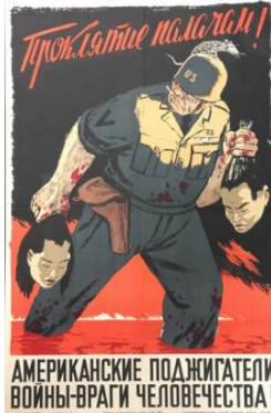
Resim 1. Cellât Konulu Propaganda Posterleri

Cellât konulu propaganda posterleri, Samoilov-Babin Lev Samoiloviç tarafından 1952 yılında hazırlanmıştır. Posterde Cellâtlara lanet olsun! Amerikan savaş çığırkanları insanlığın düşmanıdır! (Проклятие палачам! Американские поджигатели войны - враги человечества!) yazısı bulunmaktadır. Görüntüsel gösterge boyutunda incelendiğinde posterde bir askerin bir elinde bir erkeğin kesik başını, bir diğer elinde de bir kadının kesik başını taşıdığı ve her iki elinin de kan içerisinde olduğu resmedilmektedir. Askerin başında bulunan miğferin ve sol göğsünün üstünde "US" yazısı bulunmaktadır. Asker, ağzında sigara, başında da bir fareyle birlikte yürümekte, yürüdüğü yer kan içerisinde resmedilmektedir. Posterin fonunda ise siyah renk kullanılmaktadır.