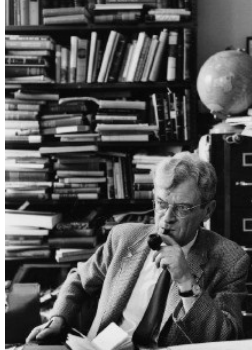
Prof. Dr. Alexander Gerschenkron.

devrimi üstüne bir çalışması yayınlanan sosyolog Thorstein Veblen'den sonra (Veblen, 1915), tarihçiler sanayileşen diğer ülkelerin/ulusların İngiliz modelini mi izlediklerini, yoksa ondan ayrıldıklarını mı?, gecikenlerin (late-comer) kendilerinden öncekilere oranla birtakım üstünlüklerden yararlanıp yararlanmadıkları gibi konularda odaklaşmışlardır. Bu alandaki önemli isimlerden biri de Rus asıllı Amerikalı iktisat tarihçisi ve kalkınma iktisatçısı Prof. Dr. Alexander GERSCHENKRON'dur.