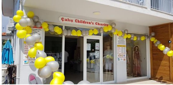
Photograph-1. The shop front of Çalış Children's Charity, Fethiye.

The 3Cs Charity – Çalış Children's Charity - is based in Çalış, Fethiye, Turkey. It raises funds through its retail outlet, winter car boot sales and fun events to enhance the lives of local, disadvantaged children.