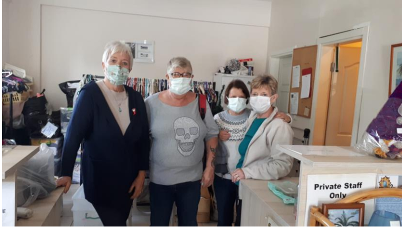
Photograph 2 – Volunteers at the Çalıř Children's Charity, Fethiye.