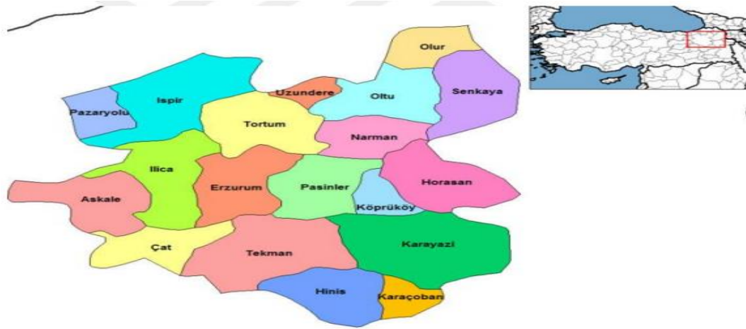
Şekil 1. Uzundere İlçesinin Coğrafik Haritası

Uzundere'de ekonomik anlamda tarım sektörü hala canlılığını korumakla beraber, hayvancılıkta önemli gelir kaynaklarından. Tarihi açıdan da önemli bir yere sahip olan Uzundere mutfaktan, halk oyunlarına, folklor ve müziğe kadar ulaşan kadim Anadolu kültür zenginliğine sahiptir. Yine bunların yanı sıra tarihi ve doğal mekânlara da sahiptir. Bunlar; Tortum şelalesi, Tortum Gölü, Yedi Göller, Öşvank manastırı ve kilisesi, tortum çayı, Peri Bacaları, Üngüzek Kalesi, Sapaca Kalesi, İnçer Camii, Cevizli Camii, Şaşaroz Şapeli, Akkoyunlu ve Gürcü Mezar Taşlarıdır (URL2).