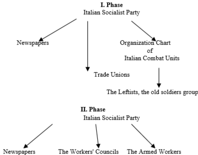
Schema 5 : Organization Chart of Italian Combat Units Before Mussolini Comes To Power

In I. Phase, Socialist Newspapers made propaganda for the Italian Socialist Party, they had a military system of the Leftists and the old soldiers' group due to the political void in Italy. Trade Unions were in charge of holding an armed, unarmed rally. In II. Phase, The Socialist Newspapers' importance for propaganda, The Workers' Councils would do effective armed actions. The Armed Workers' was professional soldiers more than the leftists' soldiers (Encyclopedia of revolutions and counter-revolutions-2, 1975: 240-246).