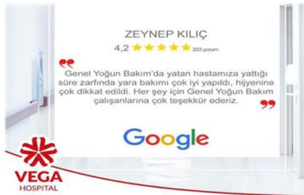
Şekil 1 : Paylaşım Metni