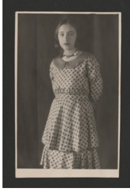
Görsel 5. Bilinmeyen Fotoğrafçı, 1930'lar, genç bir kadın portresi.

Fotoğraf tekniğindeki gelişmeler, fotoğrafın ucuzlaması ve modernleşme programının kadınlara görece özgürlükler sağlamasıyla birlikte kendi imgesine sahip olma ayrıcalığı toplumun geniş kesimlerine yayılır. Fotoğrafın anlamını stereotipler yoluyla üretmesi, fotoğrafta görülen bir kişinin pozundan ve giyim kuşamından toplumsal cinsiyet, sınıf, ırk ve din gibi kimlik işaretlerinin okunabiliyor olması, fotoğrafın stereotiplerin işleyişlerini kesintiye uğratma etkisini de üretebileceği anlamına gelir. 6