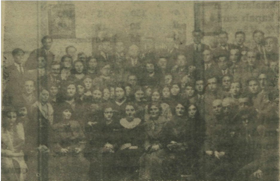
“Bolu Kadınlarının Bolu Halkevi’ndeki Toplantısından Bir Görüntü”, Ulus , 26 İlk Kânûn 1934, s.5.