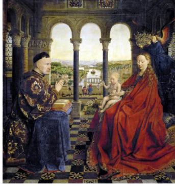
Resim 1. Jan van Eyck, “Rolin Meryemi”, Louvre, Paris (Kaynak: Bell, 1999, s.26)