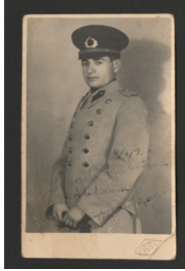
Görsel 4. Studio Foto Febus, 1936, Teğmen üniformalı genç bir erkek fotoğrafı. Fotoğraf: Fotoğraf: Akkasah Fotoğraf Arşivi (Akkasah: Center for Photography, ref172) Akkasah: Center for Photography, ref2051.

Akkasah Arşivi'nde yer alan 1930'lu yıllara ait genç bir erkek ve genç bir kadını gösteren fotoğraflar da toplumsal konum ve cinsiyetin kamera karşısında nasıl temsil edildiğiyle ilgili iki örnek olarak ele alınabilir. Her iki fotoğrafta da kılık kıyafet, cinsiyet işaretlerinin temel taşıyıcı simgeleridir. Görsel 4'de asker üniforması ve üniformanın omuzundaki işaretler fotoğraftaki genç erkeğin askeri rütbesinin yanı sıra toplum içindeki konumunu da tanımlar. Bu genç teğmen ileriye yönelmiş bakışları ve dik duruşu ile ordu gibi stratejik bir kurumun içinde yükselme potansiyeli taşımasının yanı sıra bir erkekten beklenen kararlılık, kendine güven gibi nitelikleri de sergiler. Üniforması içinde verdiği bu poz, onun hali hazırda kadınlardan ve sıradan orta sınıf erkeklerden görece üstün toplumsal konumunu yansıtır. Görsel 5'de görülen genç kadının elbisesi onun önce cinsiyetini ardından da sınıfını ve yaşını, vücudun hafif öne eğikliği ve belli belirsiz gülümsemesi de iffetinin işaretidir. Bu genç kadın, Erken Cumhuriyet Dönemi'nde modernleşme programını benimsemiş orta sınıf bir aileye mensup genç bir kadını gösterir ve bu imge "münevver genç kız" stereotipine uyar.