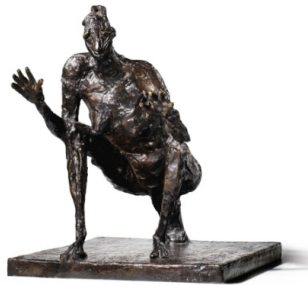
Resim 13. Germaine Richier, Büyük Çekirge, Dominique Lévy-Galerie, New York