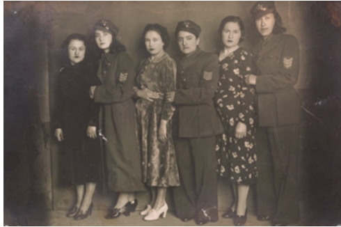
Görsel 10. Bilinmeyen Fotoğrafçı, 1930-1940'lar, Askeri üniforma giymiş kadınların da aralarında olduğu kadınlar.

Bu üniformaların görsel 10'de de görülebileceği gibi kadınların bedenlerine tam olarak oturmayışı askerlik mitolojisindeki üniforma disiplinini doğal olarak alaya alır. Yerlere kadar uzanmış pantolon paçaları ve bol gelen üniforma ile birlikte yana yatırılmış şapka asker-subay stereotipinin yapısını bozar. Bunun yanı sıra birçok örnekte görüleceği üzere asker fotoğraflarının genel yapısını ve dik ve kendine güvenli duruşun parodisi yapılır. Belirtilmesi gereken noktalardan biri de fotoğrafların hiçbiri ev ya da özel alanların içinde çekilmemiş olmasıdır. Fotoğraf stüdyolarında ve özel alanların kamusal alana açılan bahçe ve balkon gibi ara bölümlerinde çekildikleri anlaşılmaktadır.