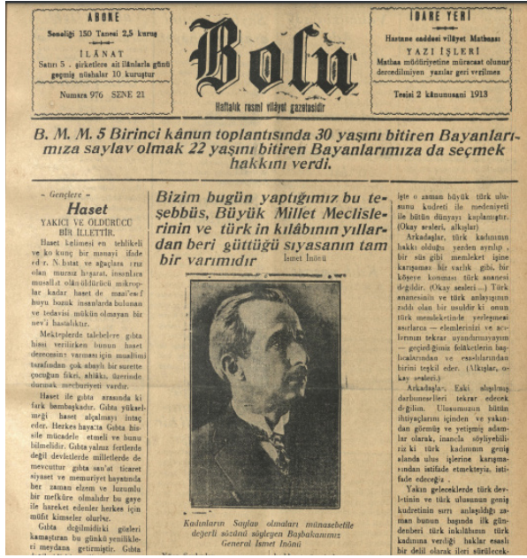
“Kadınların Milletvekili Seçme ve Seçilme Hakkına Kavuşmasına Dair Haber”, Bolu , 13 Birinci Kanun 1934, s.1.