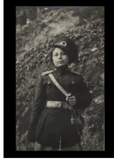
Görsel 6. Bilinmeyen Fotoğrafçı, 1931, Genç bir kadının askeri tören üniforması içinde portresi. Fotoğraf: Yazarın Koleksiyonu