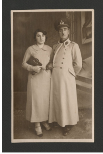
Görsel 3. Bilinmeyen Fotoğrafçı, 1930'lar, Türkiyeli bir çiftin portre fotoğrafı. Fotoğraf: Akkasah Fotoğraf Arşivi (Akkasah: Center for Photography, ref172)

içine girer. Aynı zamanda kolay kullanılan fotoğraf kameralarının amatörlere hizmet sunmasıyla kadınların ev içi ve günlük yaşamlarını gösteren karelerin sayısı da artar. Bu koleksiyonculuk ve değiş tokuş etkinliği, modern Türk kadını ve erkeği stereotiplerini yansıtan pozların tekrarını, yeniden üretimini ve toplumun geneline yayılmasını sağlar. Tekrar eden icra ve dolaşım, yerleşik toplumsal cinsiyet kodlarının fotoğraflar yoluyla etkisini sağlamlaştırarak stereotiplerin gücünü artırmasını sağlar.