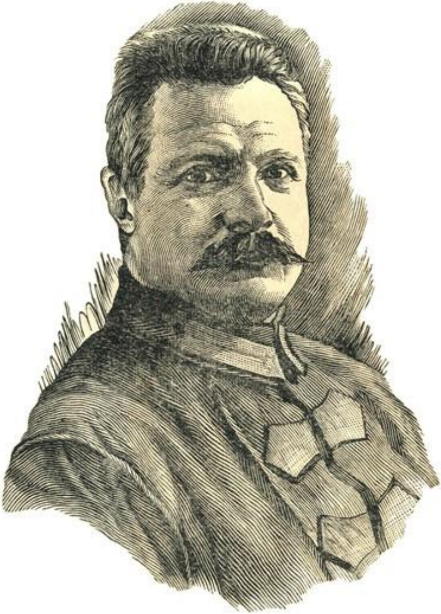
Resim 1: M.V. Frunze Pyataya Godovşına Sovyetskoj Vlasti adlı kitaptan