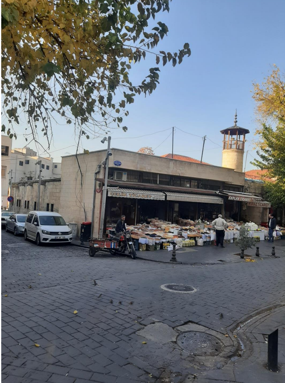
Resim 1 Tekke Cami (Mevlevihane) Doęu Tarafından Görünüşü