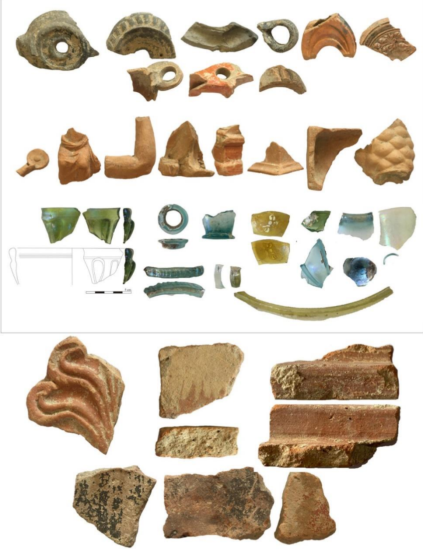
Fig.5. Geç Hellenistik-Erken İmparatorluk Dönemine ait kandil, figürin, cam kaplar ve mimari parçalardan örnekler