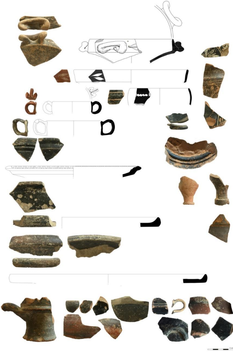
Fig.2. Hellenistik Dönem seramik örnekleri