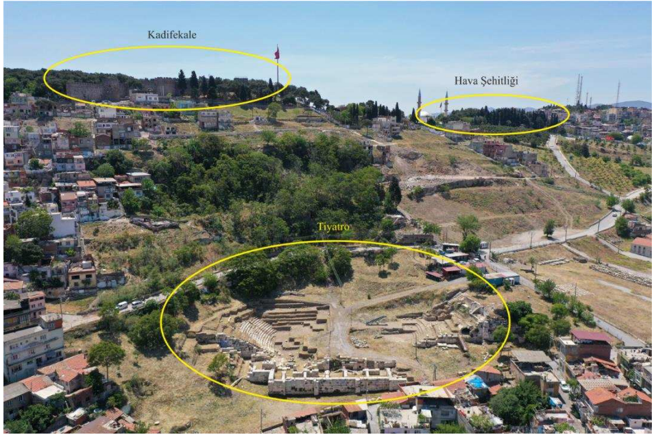
Figür 1. Kadifekale Hava Şehitliği genel görünüm

Figür 4. İmparatorluk Dönemine ait çeşitli formlar ve pişirme kapları Figür 5. Geç Hellenistik-Erken İmparatorluk Dönemine ait kandil, figürin, cam kaplar ve mimari parçalardan örnekler