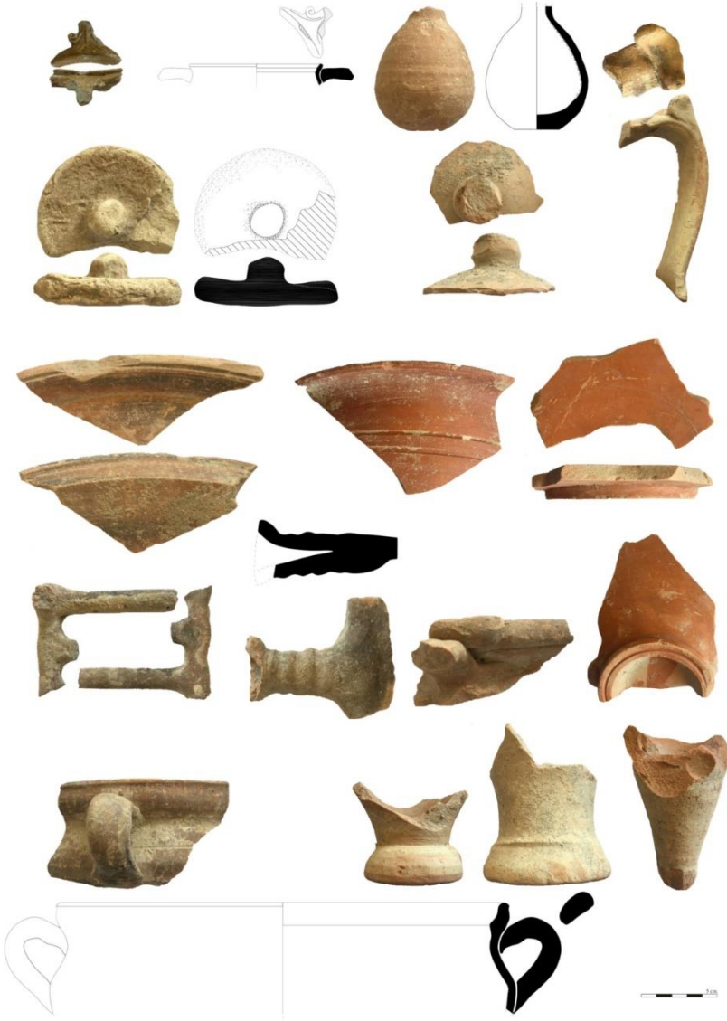
Fig.4. İmparatorluk Dönemine ait çeşitli formlar ve pişirme kapları