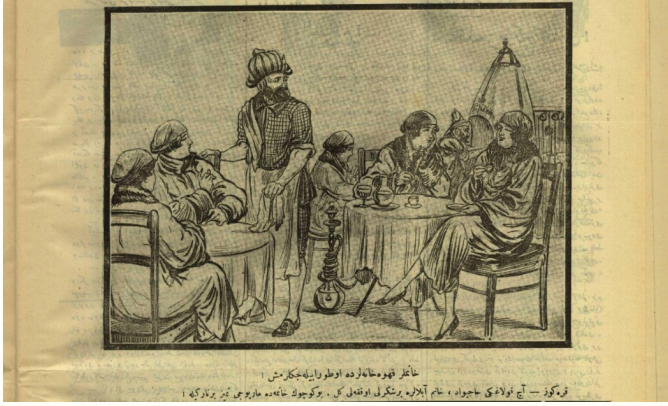
Resim 11. 28

oluştururken, bunun nedenine bakınca da erkek egemen toplumlarda erkeklik algısının kaybolacağı fikri korkusunun oluştuğundan bu tip eleştirilerin gündeme geldiği yorumu çıkarılır. Erkeklerle ait olarak kalıplaşmış mekanlardan en önemlisi ve günümüzde bile hala kullanılan kahvehane temalı bir çizim Karagöz Dergisi'nde karşımıza çıkar.