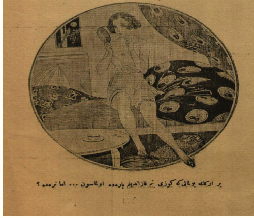
Resim 2. 7

dönemin gidişatını ve toplumsal eşitsizlikleri değerlendirmek açısından güzel bir örnek yine Resim 2 'de Gelincik'ten. Bir kadının tek başına konuşmasını konu edinen karikatür çalışan bir kadının düşüncelerindeki aykırılığı yakalamamızı bekler. Karikatürün yayımlandığı 1924 yılı ise kadınların ekonomik özgürlüklerini kazandıklarına dair bir fikir edinmemizi kolaylaştırır.