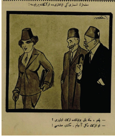
Resim 14. 34

Giyim hususundaki düşünceler ve bu düşünceleri destekleyen örnek karikatürlerden önceki sayfalarda bahsedilmişti. Kadınların süslenme mevzusu da işin içine girince moda ile ilgilenen kadınların nasıl algılandığına dair birkaç eleştirel tutum daha örnek olarak verilecektir. Yavaş yavaş sosyal hayata geçiş yapan kadınların kamusal alanda varlığını hissettirerek dergilerde onları moda düşkünü yaftası ile eleştirip meslek hayatında dahi kadınların itibarsızlaştırılmasına örnektir.