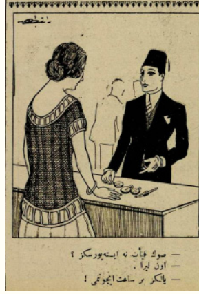
Resim 5. 29

Görselde verilen mesaj, kadınları istedikleri kalıba sokabileceklerini düşünen erkekler karşısında kadınların basit birer meta haline dönüşmesidir. Zira dergilerin her sayısının en az bir sayfasında kadınlar hakkında verilen cinsel içerikli mesajlar ve kadınların obje olarak sergilenmesi asla eksik edilmemiştir. Aynı dergiden duruma başka bir örnekle yaklaşırsak Resim 6'daki karikatürde asıl düşündürücü mesele, kadın ve erkek ilişkilerinin basına "rahat" bir tavırla yansıtılması ve kadın erkek ilişkilerinin neredeyse tamamının "yalnızca bu şekilde yürüyormuş" ve bir kadınla erkeğin arkadaşlığının hiçbir zaman normal arkadaşlık olamayacağı imajının verilmesidir.