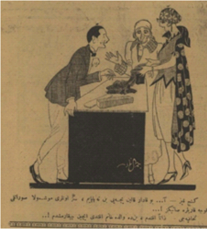
Resim 9. 24

Toplumsal yenileşmenin sonucunda oluşan değişimlerin basına yansımada kültürel değerlerin değiştiği tezini güçlendirdiği söylenir. Dergilerde gözlemlendiği kadarı ile peçeli ve tabiri caizse kapalı kadınlar yer alırken, karşılaştırmalı olarak karşısına daha Avrupai ve giyimde süse düşkün kadınlar konulmuştur. Dönem, yenileşme dönemidir ve akan sürece karşı koymak imkansızdır. Farklı coğrafi özellik, kültür ve yaş skalasını ele almadan iki karşılaştırmanın yapılması doğru bir yaklaşım değildir. Zira kırsal kesimde yaşayan bir insan ile şehir hayatının akışına ayak uyduran kimsenin yaşam tarzları bir olamaz. Bu duruma güzel bir örneği Akbaba'da görmekteyiz.