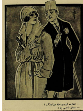
Resim 6. 30

Görselde verilen mesaj, kadınları istedikleri kalıba sokabileceklerini düşünen erkekler karşısında kadınların basit birer meta haline dönüşmesidir. Zira dergilerin her sayısının en az bir sayfasında kadınlar hakkında verilen cinsel içerikli mesajlar ve kadınların obje olarak sergilenmesi asla eksik edilmemiştir. Aynı dergiden duruma başka bir örnekle yaklaşırsak Resim 6'daki karikatürde asıl düşündürücü mesele, kadın ve erkek ilişkilerinin basına "rahat" bir tavırla yansıtılması ve kadın erkek ilişkilerinin neredeyse tamamının "yalnızca bu şekilde yürüyormuş" ve bir kadınla erkeğin arkadaşlığının hiçbir zaman normal arkadaşlık olamayacağı imajının verilmesidir.