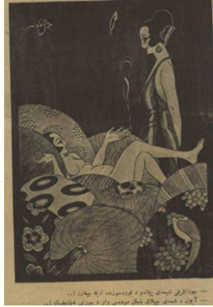
Resim 16. 36