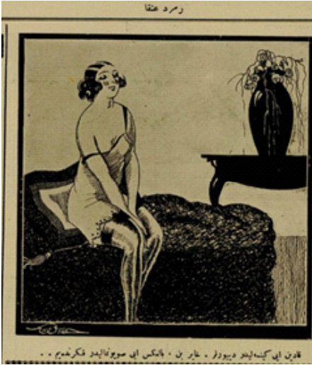
Resim 7. 22

miştir. Basın, kadının modernleşme aşamasında daha çok açık giyinmeye başladığını tasvir eder. Böyle bir durum varsa bile, modernleşme yalnızca kadına has bir durum olarak vukua gelmedi; erkekler de bundan payını aldı. Modern toplumlar, cinsiyete dayalı eşitsizlikleri üretir ve diğer toplumsal eşitsizliklerle iç içe sürdürür; modern toplumlarda cinsiyete dayalı toplumsal eşitsizliklerin esasen biyolojik farklılıklardan kaynaklandığı düşünülür. Fakat bu biyolojik farklılıklar, toplumda akseden cinsiyet farklarına sonradan verilen anlamlar olarak toplumun içinde vardır. 21 Toplum, bazı işlevleri cinsiyete özgü kılmaktadır, örneğin kadın anne olabilirken erkek asker olabilir. Anne ile asker arasındaki ayrım biyolojik değil, toplumdur. Bir başka deyişle bu ideolojik farklılıklar biyolojik determinizm ile toplum tarafından değişmez bir gerçek haline getirilir. İncelenen karikatürlerde bu sık rastlanan durum, kadın bedeninin dikkat çekici bir öğe olarak sergilenmesinde ve toplumsal rollerinin yalnız erkeğe hizmet etmek olarak gösterilmesinde büyük etkiye sahiptir.