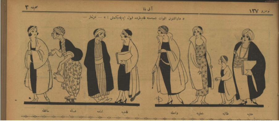
Resim 18. 37

Her kadının altında meslek isimleri kadın uyarlaması olarak yazılmıştır. Sağ baştan “Müftiha, talebe, hatibe, vaize, kadiye, imame, gassale, hafize” Kadınların meslekle tamamen alakasız sarık, elbise ve aksesuarlarla resmedilmesi mesleklerin onlara ne kadar zıt olduğu düşüncesini vurgular. Oysa kadınların da bu meslekleri yapmasında bir engel yokken, basın buna ters algı yaratmaktadır. Buna ek olarak basında sıkça gündeme gelen ve kadınların tek yaptıkları mesleğin o olduğu algısını oluşturan hizmetçilik, mizah basınına göre erkekleri baştan çıkarmak için kullanılan bir misyon haline gelmiştir.