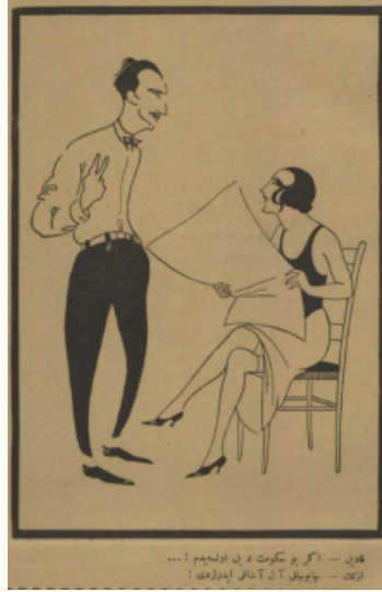
Resim 13. 32

Buna ek olarak çarpık ilişkiler sıklıkla gündemde tutulup, kadının kocasını aldatmasının çok alışlagelmiş bir durum gibi işlenmesi ve neredeyse tüm asri kadınların bu şekilde davrandığı aktarılmıştır. Dönem ve şartlar ne olursa olsun bir cinsiyet topluluğunu birkaç örnek üzerinden genellemeye koymak çok doğru bir tutum değil. Bilakis işlenmiş olan dönemde de kadınların hala bu denli açık fikirli oldukları ve kadın erkek ilişkilerinin bu derece geliştiği söylenemez.