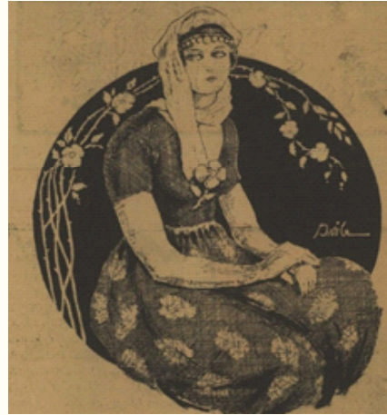
Resim 10. 25

Genç kız: "Bu kadar kalın peçeyi ben ne yapayım? Siz onları muşmula suratlı kocalara satınız!"