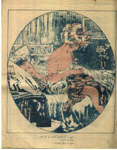
Resim 1. 5

gerektiği düşüncesi vardır. Ancak eğer bahsedilen kiracı bir erkekse, evli bir erkeğin yüksek sesle şarkı söyleyecek kadar neşeli olmadığı yorumlanabilir.