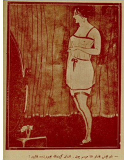
Resim 8 23

“Kadın iyi giyinmelidir diyorlar Bilakis iyi soyunmalıdır fikrindeyim.”