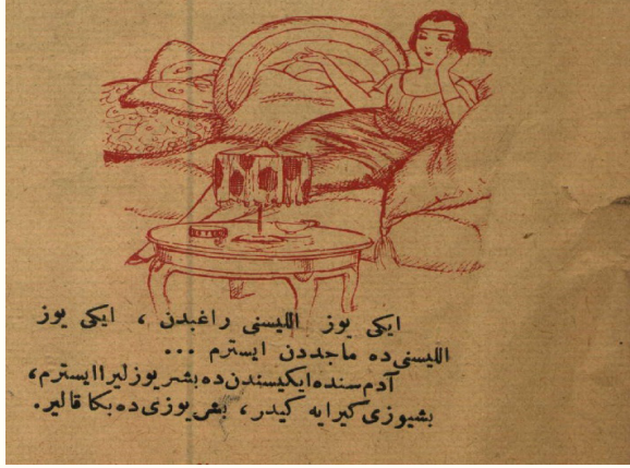
Resim 3. 8

si dayatılmaya çalışıldığı yorumlanır. Bu durumun dergi yazarları ve yayıncılarının erkek olmasından kaynaklı olduğu muhtemeldir. Kadınların ekonomik bağımsızlığını kazanmaya başladıklarına bu karikatür iyi bir örnek oluşturmaktadır.