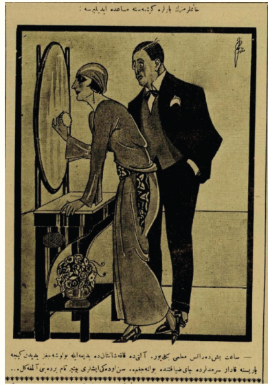
Resim 12. 31

Kadınların modernleşmesinde eleştirilerin bir başka nedeni, toplumsal yaşama ayak uydurmaya başlayan asri kadının evini unuttuğu düşüncesidir. Resim 12 'de "Hanımların Barlara Gitmesine Müsaade Edilirse" başlığı ile ele alınan karikatürde ayna karşısında süslenen kadının evdeki sorumluluklarını kocasına devrederek eğlenmeye gittiği çizilmiştir. Bu da toplumsal cinsiyet rollerinin değiştiği imajını vererek kocasına söylediklerinin sorumsuzca ve yanlış modernleşmeyi temsil ettiği fikrini doğurmuş, eleştiri malzemesi haline dönüşmüştür. Asri kadının kendine vakit ayırabilmesi bile karikatürden görüleceği üzere bir lüks olarak algılanmaktadır. Osmanlı toplumunda kadının tek görevi, evine ve çocuklarına bakmak algısı olduğundan yeniliğe ayak uydurmaya başlayan Türk kadınları eleştiri oklarından sıyrılamamışlardır.