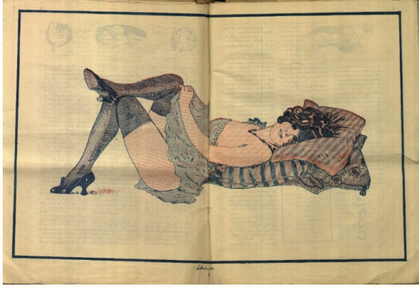
Resim 4. 18

ran kadının makyajına atıf yapmak istemiştir. 16 Derginin farklı sayısında, garip makyajlı iki kadın çizilerek, makyajı bazen abartarak yaptıklarına iğneleme yapılmıştır. 17 Harp döneminde enflasyondan dolayı ülkede her şey pahalılaştırken kadınların makyajdan etkilenerek gözlerine far olarak kömür ezip sürdüklerine dair bilgiler verilmiştir.