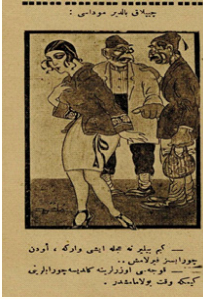
Resim 15. 35