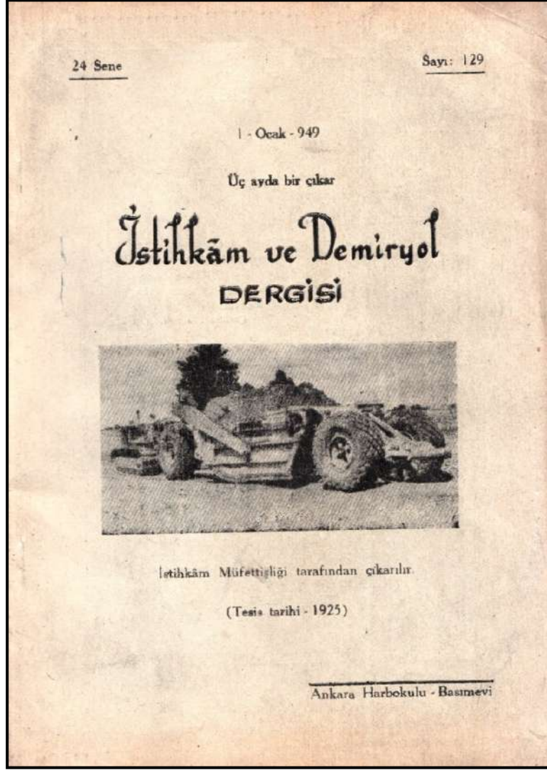
İstihkâm ve Demiryol Dergisi (İlk Sayı): Sayı: 129

Sonuç olarak denilebilir ki diğer sınıf dergileri gibi Fen Kıtaatı Mecmuası/Dergisi de Cumhuriyet Dönemi Türk Silahlı Kuvvetler Tarihi ile istihkâm, muhabere ve demiryol sınıflarına yönelik akademik çalışmalar yapacak olan akademisyenler için önemli bir kaynak özelliği göstermektedir.