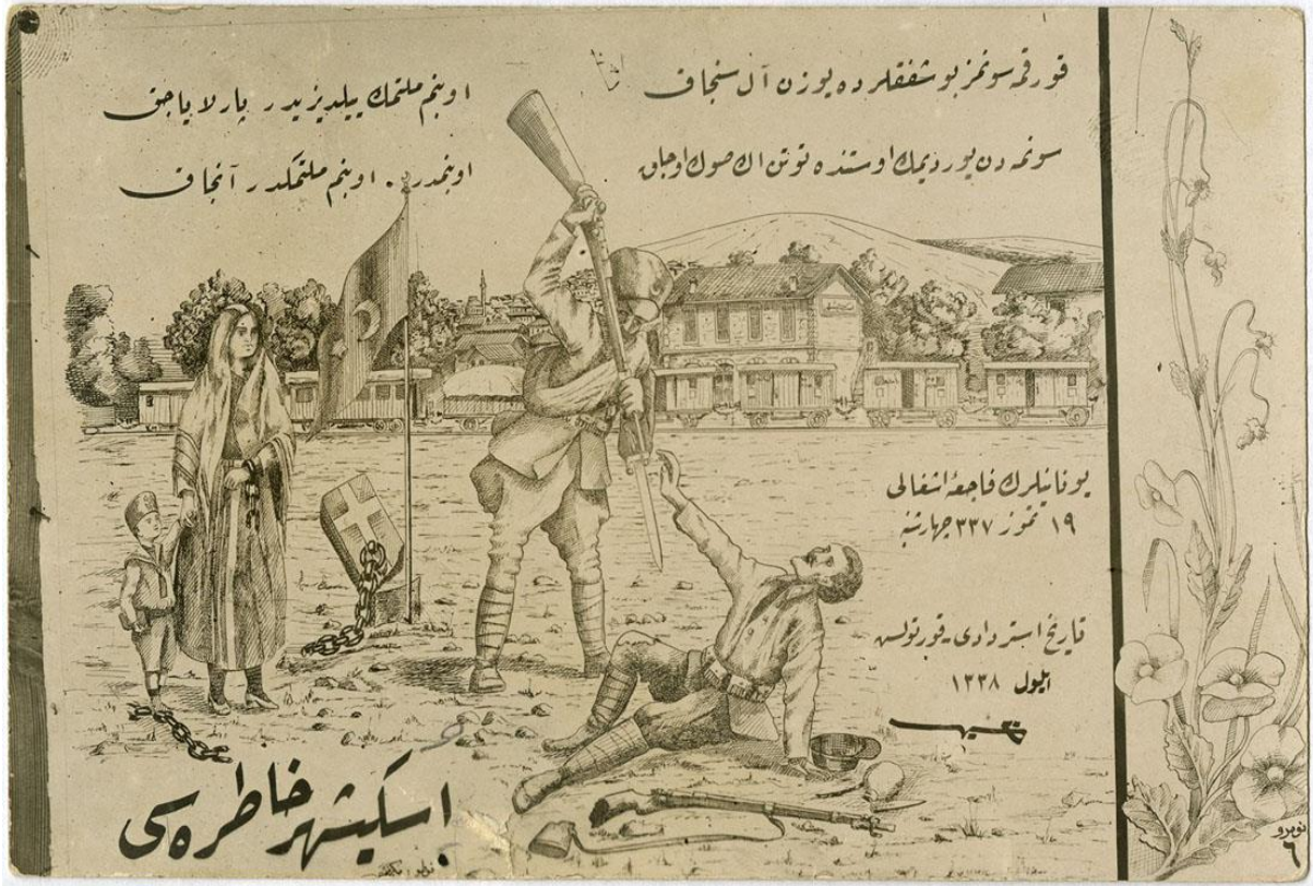
EK-5: İstiklâl Harbi Kartpostalları-Eskişehir Hatırası