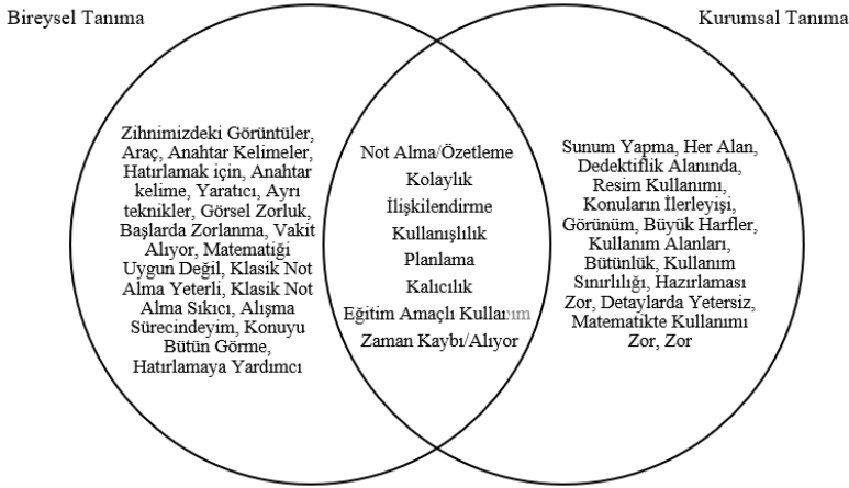
Şekil 1. Bireysel ve Kurumsal Arasındaki İlişkiye İlişkin Bulgular

Bu bölümde öğretmen adaylarının bireysel ve kurumsal tanımları arasındaki ilişki incelenmiştir. Öğretmen adaylarının verdiği cevaplara göre bireysel ve kurumsal tanımlarındaki farklar ve ortak noktalar Şekil 1’de yer almaktadır.