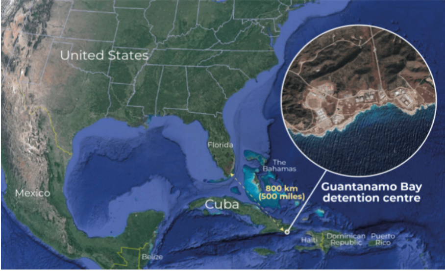
Harita 1: ABD'nin Küba'daki Guantanamo Üssü