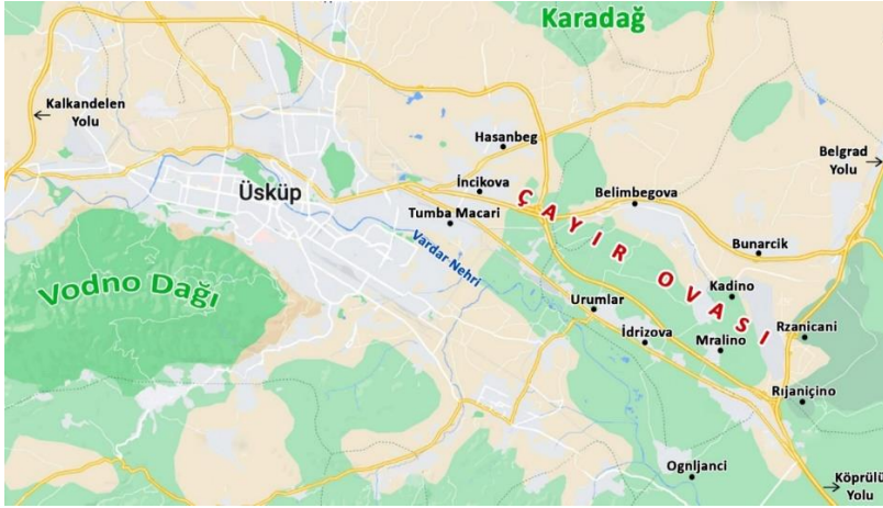
Harita 1. Üsküp Çayır / Çayır Ovası Olarak Adlandırılan Bölge ve Güherçile Üretilen Köyler*

Gerek yerel sakinlerle yaptığımız görüşmelerden gerekse Elezovic'in verdiği bilgilerden hareketle oluşturulan Harita 1'de de görüldüğü üzere Çayır Ovası / Çayır denilen sahanın, günümüzde Üsküp Şehri'nin Çayır semti tarafında bulunan Tumba Macari ve Hasan Bey köyleri hizasından başlayarak Üsküp Havalimanı'nın bulunduğu alana kadar olan köyleri kapsadığı anlaşılmaktadır. Diğer bir deyişle bu köyler, Vardar Nehri'nin akışına göre nehrin sol kıyısında yer almaktadır. Ayrıca bu köylerin Vardar Nehri ile Karadağ eteklerine doğru olan Vardar Ovası'nı içerdiği, ovadaki geniş tarlaları ihtiva ettiği görülmektedir.