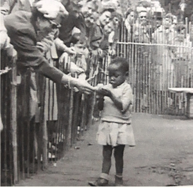
Brüksel-Kongo Köyü, 1958

(Fotoğraf Kalın, a.g.e., s. 84'ten alınmıştır.)