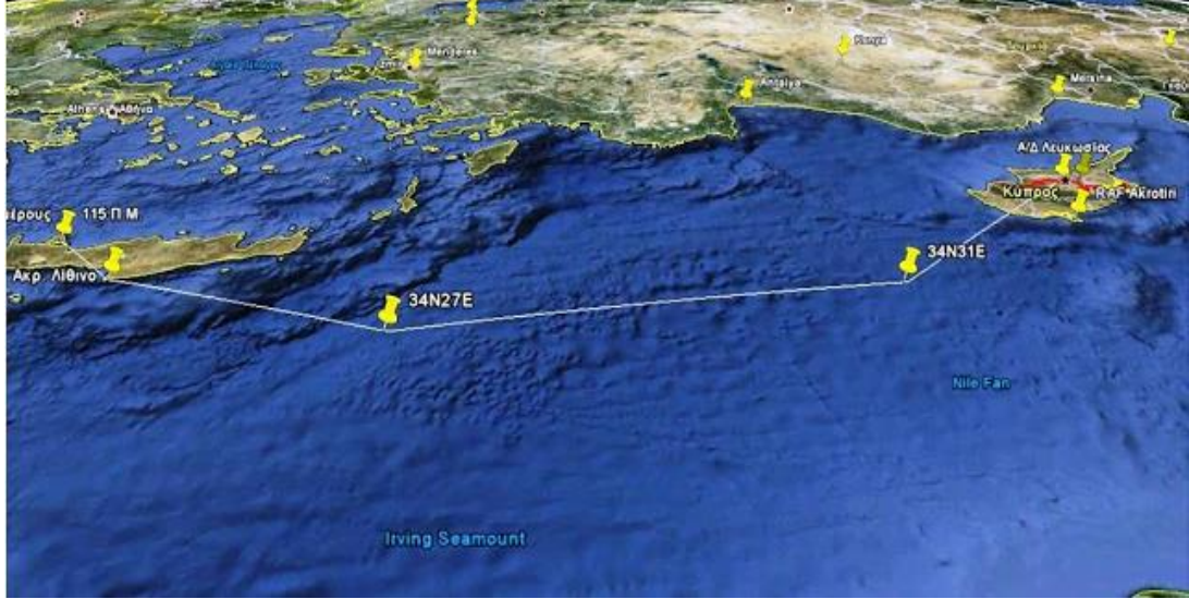
Noratlas Uçaklarının Uçuş Rotası

çevirmişlerdir. Artık önlerindeki bölge Türk Hava Kuvvetleri'nin kontrolündedir ve fark edilmeleri halinde kurtulmaları imkânsız olacaktır. Yunan Hava Kuvvetleri koruma sağlayamadığı için tek korunma yolları karanlığın sağladığı perde ve baskının yaratacağı sürpriz etkisidir. Seyrüsefer ( Navigasyon ) konusunda da yer desteği olmadığı için uçaktaki uçuş ve seyir subaylarına çok iş düşmektedir. Her uçak tek başına ve diğer uçaklarla görsel temas olmadan uçtuğu için uçuş ekibi diğerlerinin nerede olduğunu tahmin etmek ve olumsuz bir duruma karşı sürekli hazırlıklı olmak durumunda olmuştur.