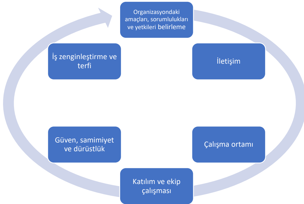
Şekil 1: Personel Güçlendirmede etkili olan Faktörler

Personel güçlendirme sürecine yönelik stratejik yolların daha etkin bir şekilde uygulanabilmesi için etkili olan faktörler Şekil 1’de özetlenmektedir (Karakaş, 2014).