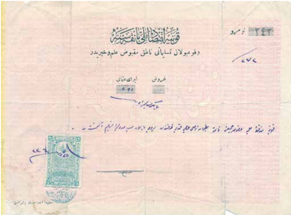
Konya İktisadi Millî Bankasına ait para makbuzu