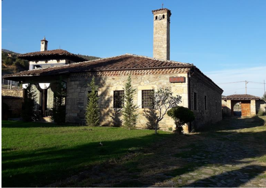
Resim 1. Harâbâtî Baba Dergâhı içinden görüntü

Bektaşî tarîkatının Balkanlar'daki önemli merkezlerinden biri olan Harâbâtî Baba dergâhı, duvar resimleri açısından Osmanlı resim sanatında önemli bir yere sahiptir. Bunun dışında Harâbâtî Baba Bektaşî dergâhında gelişmiş bir de tekke edebiyatı ve dini mûsîki olduğu bilinmektedir. Dergâh kitabelerinde ve mezar taşlarındaki yazılarda, nefes ve şiirlerde bunu görmek mümkündür.