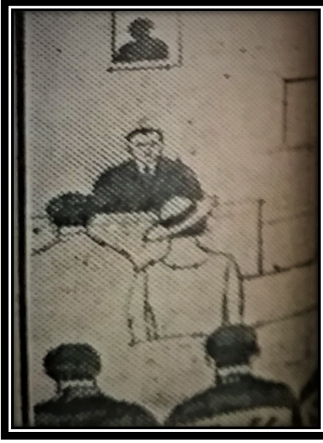
Resim 3. Karagöz/28.10.1933