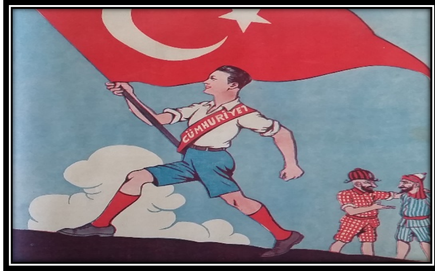
Resim 2. Karagöz /28.10.1933