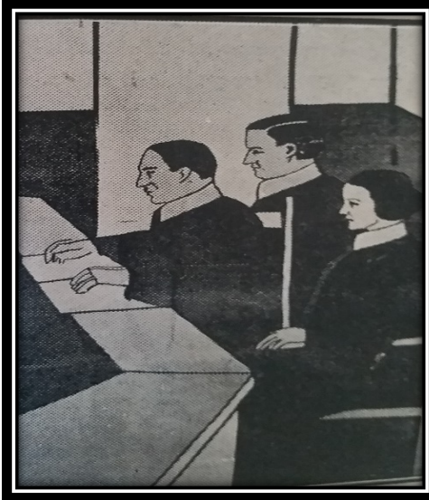
Resim 5. Karagöz/28.10.1933