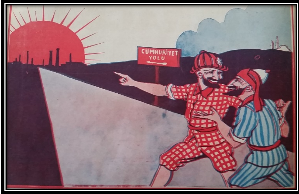
Resim 8. Karagöz/1/11.1933

“Eski devirle yeni devir arasındaki değişim” başlıklı yazının devamında “eski ve yeni” siyasetçilerin karşılaştırmasının yapıldığı görülmektedir. Bu karşılaştırmada sayfada yer alan diğer görsellerden farklı olarak karikatür yerine Atatürk’ün gerçekleştirdiği yurt gezilerinden bir fotoğraf karesi kullanılmıştır. Bununla beraber Atatürk’ün bulunduğu fotoğrafın yanında eski hükümeti veya padişahı gösteren bir karikatür kullanılmamıştır. Fotoğraf altı yazısında “ eskiden hükümet adamlarının yüzünü bile göremezdik ” ifadesi eklenmiş, “Osmanlı” hem görsel hem yazılı olarak sansürlenmiştir.