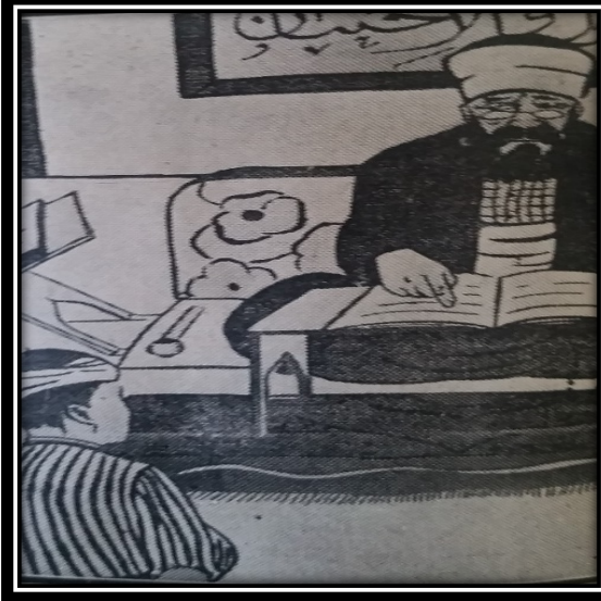
Resim 6. Karagöz/28.10.1933

Eski mektebin hapisneden farkı yoktu, eski mahkemede bir sarıklı tek başına aklına eseni yapardı, eski imam nikâhı bir sözle kıyar bir sözle bozulurdu! (1933, 28 Birinci Teşrin). Eski devirle yeni devir arasındaki değişim, Karagöz , s.4-5.