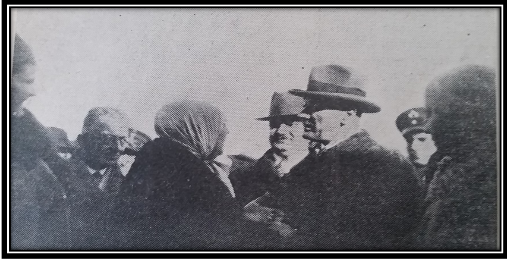
Resim 7. Karagöz/28.10.1933

Cümhur reisimiz büyük Gazi, Başvekilimiz İsmet Paşa kadın erkek köylü kentli her sınıf halkla konuşup herkesin isteğini dinleyip yerine getiriyorlar; eskiden hükümet adamlarının yüzünü bile göremezdik! (1933, 28 Birinci Teşrin). Eski devirle yeni devir arasındaki değişim. Karagöz , s.4.