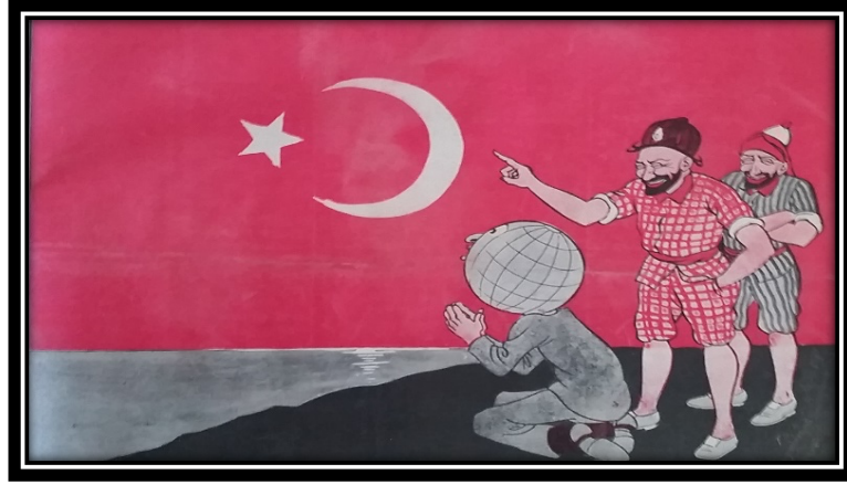
Resim 1. Karagöz/1.11.1933

Dünya- Ay yıldızın bu kadar yükseldiğini görmemişim...