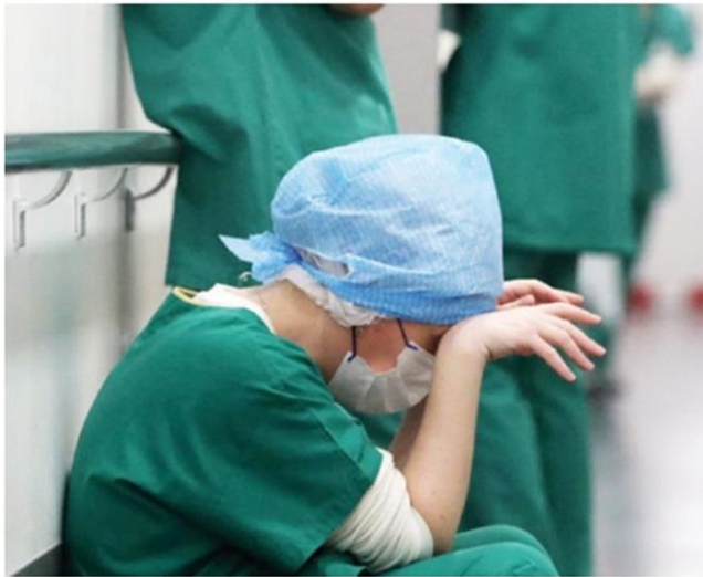
Image 5. 5-th News Image of a Tired Nurse