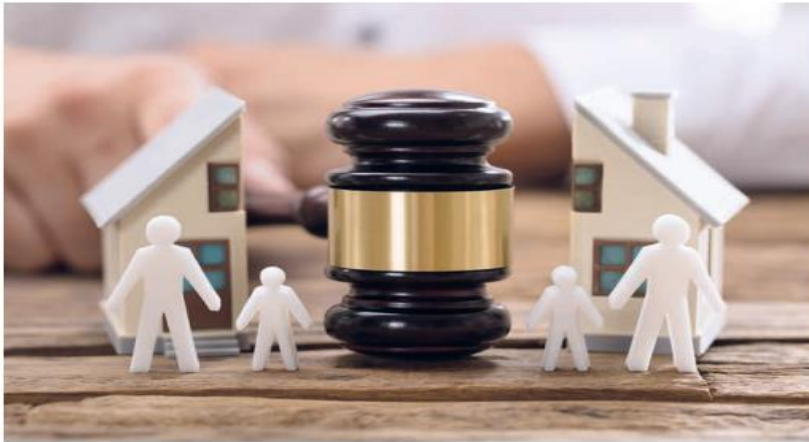
Image 3. 3-rd News Divorcing Family Image