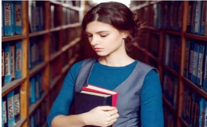
Image 4. 4-th News Image of a Girl Who Wants to Get an Education