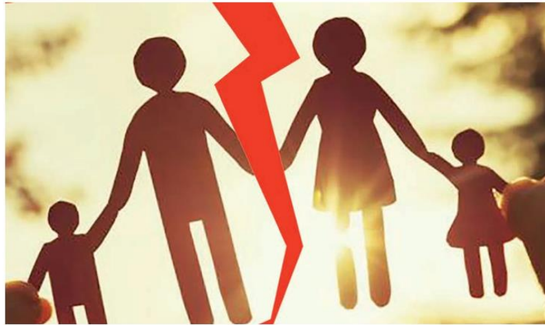
Image 1. 1-st News Divorced Family Image