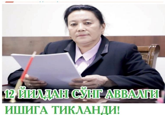
Image 2. 2-nd News Image of Woman Reinstated