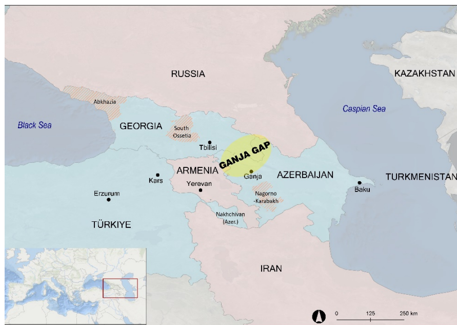
Figure 2: Map of Ganja Gap (The Geographic Information System of the Commission-GISCO activities-EUROSTAT EU, made with ArcGis 10.8.2.) (Authors' elaboration).

The Ganja Gap is the narrow border space between Georgia and Azerbaijan, roughly 60 km wide, which allows land transit between Asia and Europe bypassing Russia and Iran (Figure 2). It takes its name after the city of Ganja, the second largest city in Azerbaijan, and close to this space and north of Nagorno Karabakh. Ganja Gap breaks the continuity of the axis Russia – Armenia – Iran and allows the transit between Georgia and Azerbaijan, further expanding to Türkiye, the Black Sea and Europe to the West, and to Central Asia and the verge to China to the East.