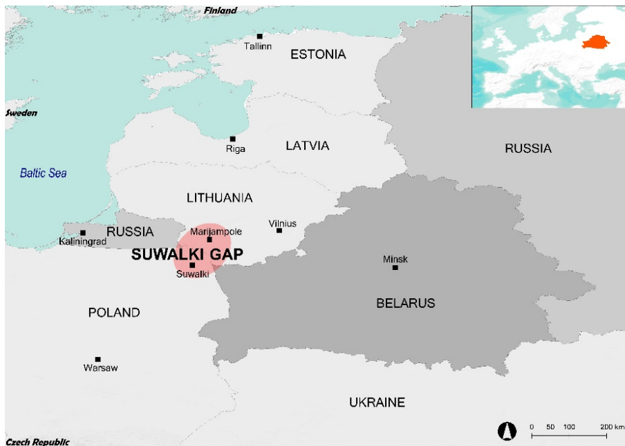
Figure 1: Map of Suwalki Gap (The Geographic Information System of the Commission-GISCO activities-EUROSTAT EU, made with ArcGis 10.8.2.) (Authors' elaboration).

This article intends to shed light on a gap that is often unnoticed but of great importance for the stability of the Caucasus region and the economy and development not only of the region itself but with wider consequences for Europe. First, a review of the foreign policy of each regional actor is done, highlighting their interests and concerns. The article focuses then on the importance of the Ganja Gap and its implications for wider security. Lastly, some reflections are provided due to the new security scenario after 2022. Our hypothesis is that the escalation of the confrontation between Russia and the West may affect the stability of the Caucasus region, where the Ganja Gap plays a vital role, both in international security preventing conflict and in terms of economic development.