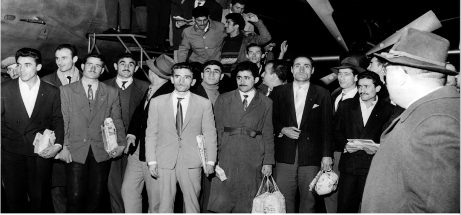
55 türkische „Gastarbeiter“ kommen am 27. November 1961 am Flughafen Düsseldorf an. Sie sind die ersten von 400 Bergleuten, die sich für ein Jahr Arbeit in Deutschland verpflichtet haben.

işçilerin ne de bu işçileri davet eden Almanya devletinin planlarında olduğu üzere, göçmenlerin Almanya'da bir iki yıl kalma ve çalışma sonrası ülkelerine dönmeleriyle nihayete ermemiştir.