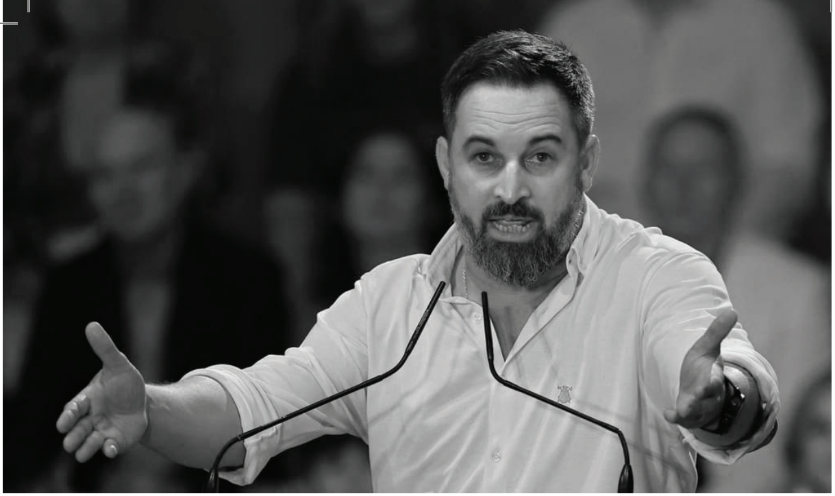
Photo: İspanyol aşırı sağcı lider Santiago Abascal, 24 Haziran'da Madrid'de düzenlenen bir seçim toplantısında bir konuşma yapıyor | Thomas Coex / AFP, Getty Images ile