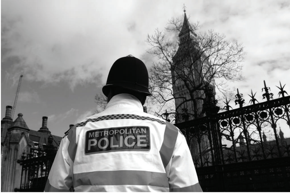
Photo: VIP vergi mükellefleri tarafından finanse edilen güvenlikle ilgili tüm kararlar, RAVEC olarak bilinen İngiliz devletinin gizli bir kolu tarafından alınır

geçen yıl yıllık izin ile dinlenme günlerinin iptal edilmesinden şikâyet ettiklerini ve özellikle Boris Johnson için “kendisini çabucak toparlamaya çalışmak için diğer ekiplerden memurları çektiklerini” söylediler. RASP ile bağlantılı ikinci bir kişi, bazı polis memurlarının Johnson’ı yurtdışı seyahatlerinde korumak için başka bir ekipten görevlendirildiğini doğruladı.