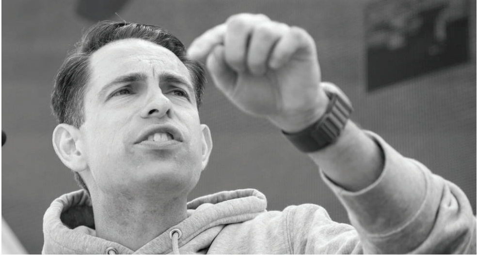
Photo: Vlaams Belang genel başkanı Tom Van Grieken, Flaman aşırı sağ partisinin 29 Mayıs’ta Brüksel’de düzenlediği protesto toplantısında bir konuşma yapıyor | Nicolas Maeterlinck/BELGA MAG/AFP, Getty Images ile

genel seçimler yapılacak olan Belçika’da aşırı milliyetçi Vlaams Belang partisinin başkanı Tom van Grieken, geçen hafta sonu, Fransa’daki isyanlar ve Belçika’daki benzer olaylar hakkında konuştu. Aşırı sağcı lider, huzursuzluğun “solun çok kültürlü rüyasının vatandaşlar için çok kültürlü bir kâbus olduğunu” yansıttığını söyledi. “Buralar, toplumumuzun kitlesel göç tarafından çekildiği ve hükümetin çok az kontrole sahip olduğu bölgeler” dedi ve Belçikalı yetkililerin sorunla başa çıkacak “cesaretleri olmadığını” da sözlerine ekledi. “Gerçek değişim ancak direksiyon başında Vlaams Belang olduğunda garanti edilebilir.” Chatham House’dan Kundnani, aşırı sağın iç siyaseti etkilemenin yanı sıra hâlihazırda AB’yi şekillendirdiğini söyledi. Kundnani, “Ursula von der Leyen’in merkezci Komisyonunun Avrupa yaşam tarzımızı Teşvik Eden bir Avrupa Komis-