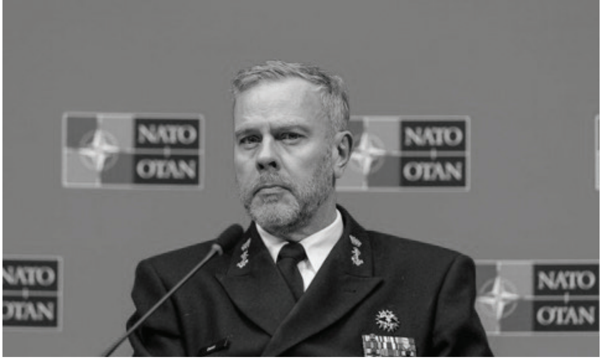
Photo: Amiral Rob Bauer, Kremlin güçlerinin hala bir tehdit olduğuna inanıyor | Omar Havana / Getty Images

Askerî komite başkanı, önümüzdeki hafta Vilnius'ta yapılacak önemli bir toplantı öncesinde konuştu.