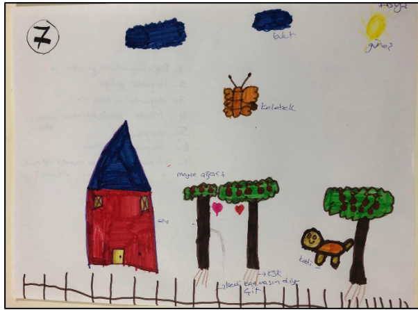
Şekil 1.3. KÖ7'ye ait doğa resmi