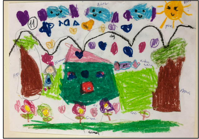
Şekil 1.2. KÖ11'e ait doğa resmi