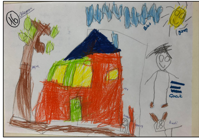
Şekil 1.4. EÖ16'ya ait doğa resmi