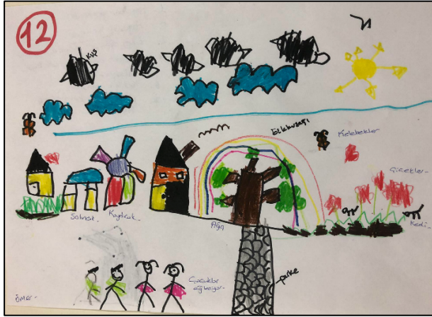
Şekil 1.1. EÖ12'ye ait doğa resmi