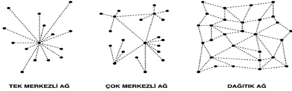
Şekil 1: Ağ Türleri (Usta & Doğantekin, Blockchain 101 v2, 2018).

Şekil 2’de yer alan ağ türlerinden de anlaşılacağı üzere tek merkezli ağ yapısı, bir merkez sunucunun tüm diğer kullanıcılar tarafından erişilebildiği, genellikle merkezi bir kontrol mekanizmasına sahip olduğu görülmektedir. Çok merkezli ağ yapısında da birden fazla merkezi sunucunun bulunduğu bir ağ türü olarak karşımıza çıkmakta ve bu ağlarda, sunucular genellikle farklı konumlarda bulunur ve bu sunucular arasında belirli bir düzeyde veri alışverişi olabilmektedir. Dağıtık ağ yapısı ise, herhangi bir merkezi sunucunun bulunmadığı bir ağ türü görevi yaptığından tüm kullanıcılar birbirleriyle doğrudan etkileşim halindedir ve tüm veri işlemi ile depolama işlemleri dağıtık olarak gerçekleştirilmektedir.