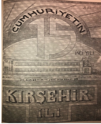
Cumhuriyet'in on Beşinci Yılı Kırşehir Kitabı