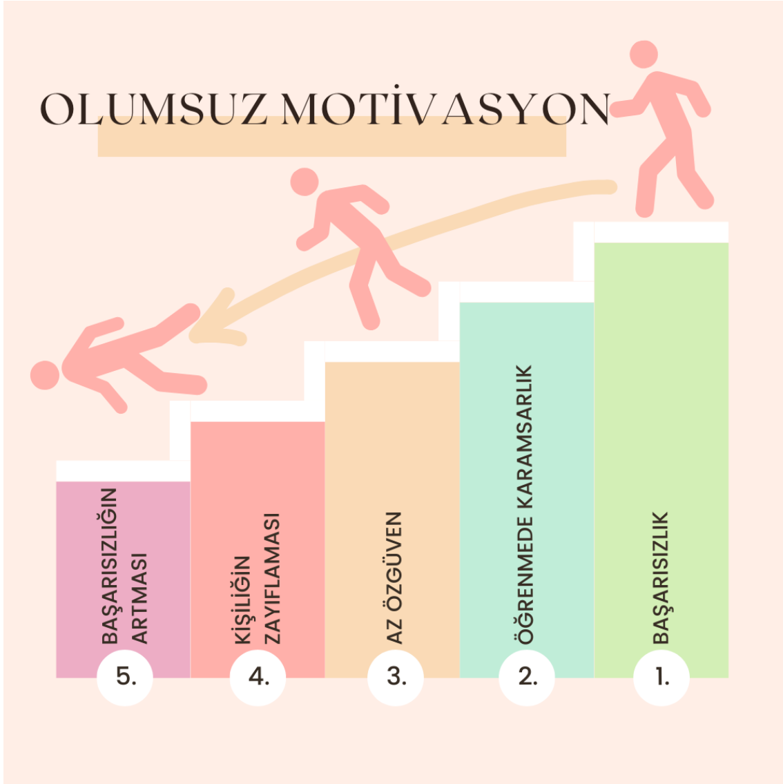
Şekil 2. Olumsuz Motivasyon

Birçok çalışma, motivasyonun öğrenme sonuçları üzerindeki olumlu etkisini ortaya koymuştur (Karakis et al., 2016; Wah, 2015; Turel & Sanal, 2018). Ancak, motivasyon stratejilerinin öğrencilerin bireysel ihtiyaçlarına göre uyarlanmadan uygulanmasının bazı olumsuz etkileri olabileceği belirtilmiştir (Song & Keller, 2001; Astleitner & Keller, 1995). Öğrenciler, öğrenme sürecinin başında motive olabilirken, zamanla bu motivasyonları azalabilir (Song & Keller, 1999). Bu, motivasyon stratejilerinin öğrencinin bireysel ihtiyaçlarına göre özelleştirilmesi gerektiğini gösterir. Ancak, bu tür bireysel ihtiyaçlara yanıt veren yaklaşımlar sınırlıdır. Li ve Keller (2018), öğrencilere uygun motivasyon stratejileri sunulması gerektiğini belirtmiştir.