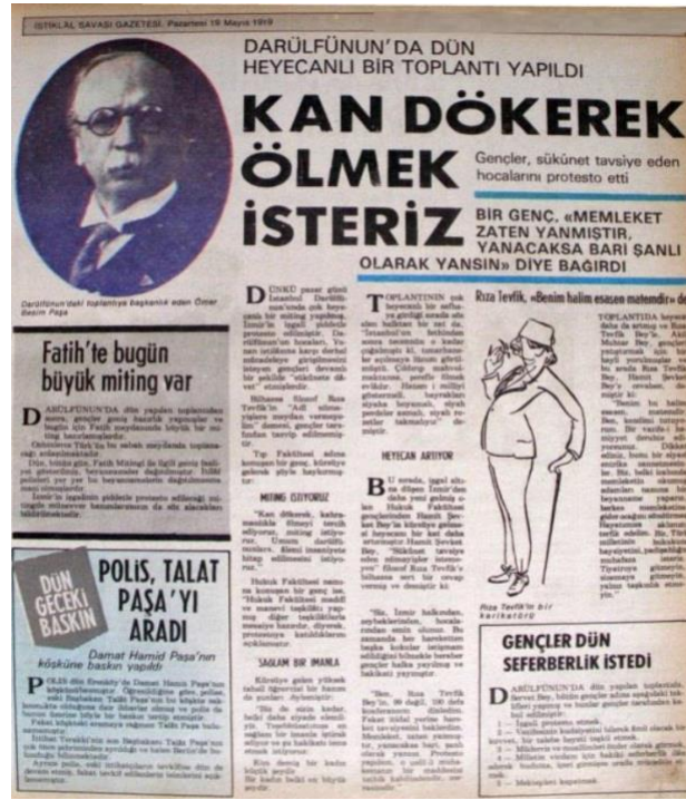
Şekil 3.1: 19 Mayıs 1919 Tarihli Darülfünun Mitingine Dair Gazete Haberi