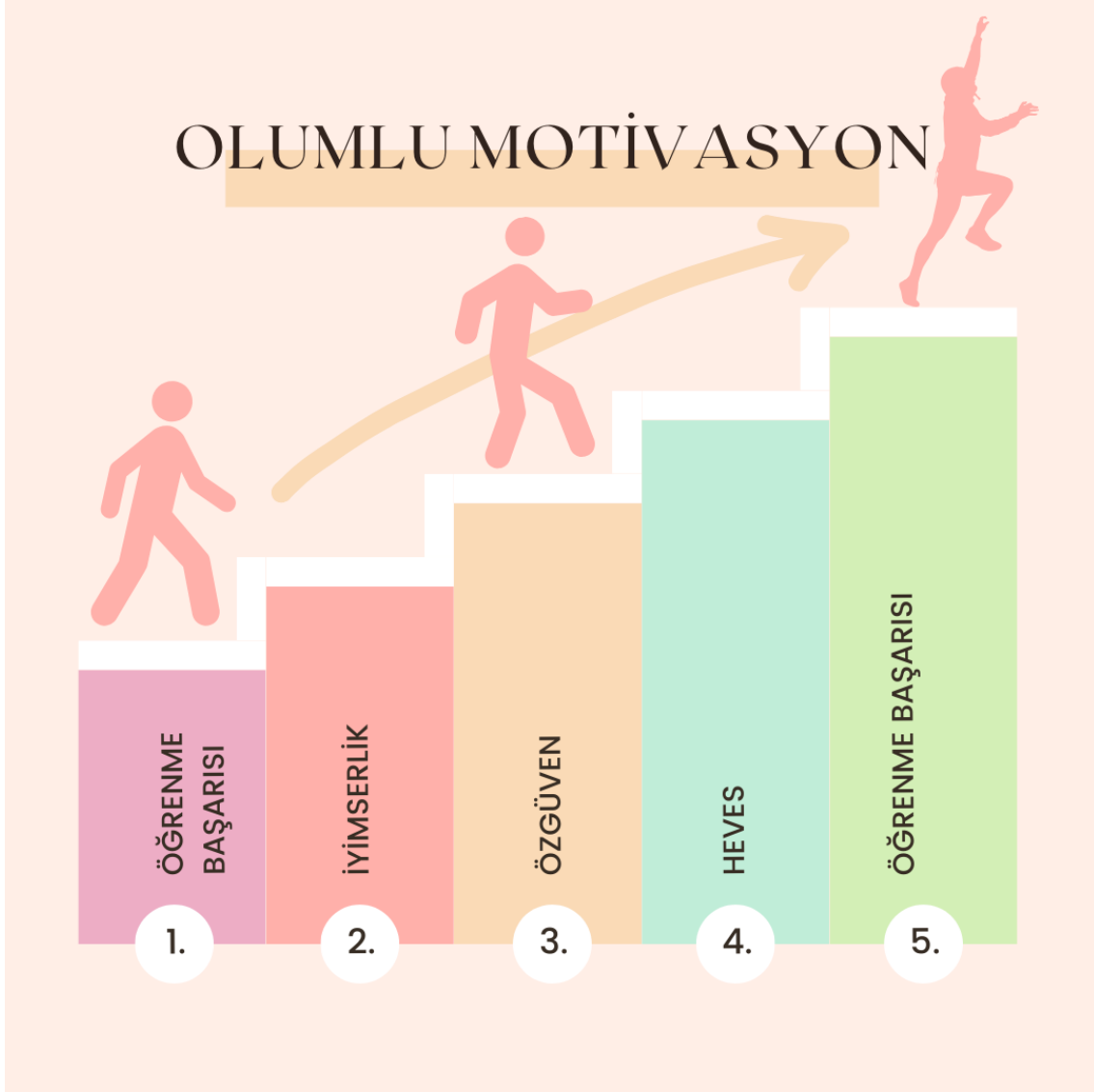
Şekil 1. Olumlu Motivasyon

artırır. Bu da öğrenme hevesini yükseltir ve öğrenme başarısını destekleyerek sürekli bir öğrenme arzusu oluşturur (DELLAL & GÜNAK, 2009).